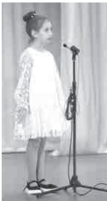
«Волшебное поэтическое слово» – одна из номинаций, в которой состязались ребята.

В пятом сезоне «Большой перемены» впервые примут участие школьники 1 – 4 классов. Ребята вместе со взрослыми будут выполнять задания дистанционного этапа.