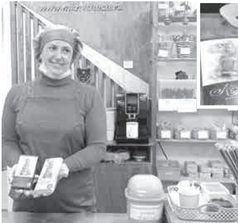
Шоколад под брендом «Амурский бульвар» покорила Москву

сяцев, белый шоколад – дольше одного месяца.