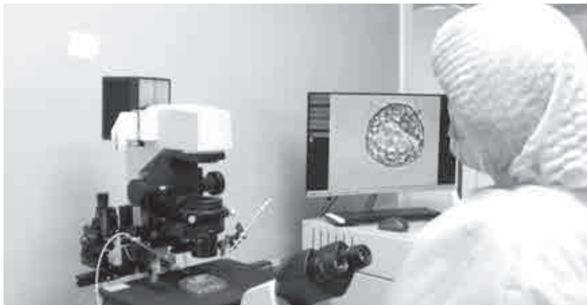
С помощью процедуры ЭКО с начала этого года на свет появилось более 4 тысяч детей.

гожданный ребёнок. О нём мы с мужем мечтали много лет, но забеременеть всё не получалось. Когда врачи обозначили проблему, я была в шоке. Ведь я полностью здорова, а выходит, что сама забеременеть не могу. Долго свикалась с этой мыслью. А потом обратилась за помощью к специалистам, – рассказывает женщина. – Я благодарна Центру за то, что моя первая попытка сразу же была положительной. В период вынашивания ребенка чувствовала себя замечательно, без всяческих осложнений и токсикоза. Сейчас я счастлива, что у меня есть сын. Видеть, как твоё чадо развивается, растёт, общается, учится новому – это радость, которую не передать словами.