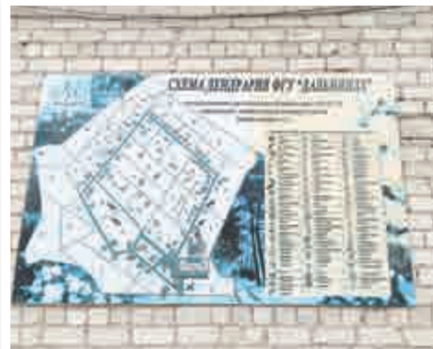
Схема дендрария поможет найти самые интересные растения.