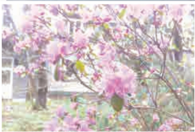
Сакура – цветок влюблённых.