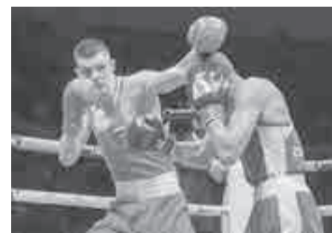
Боксеров 15 стран ждут в Хабаровске.

Ну, а сейчас с 14 по 18 мая в хабаровской «Платинум Арене» проходят бои международного турнира по боксу памяти Константина Короткова. Как напоминают в правительстве края, это один из старейших спортивных турниров в регионе, он проходит с 1961 года. Состязания организованы в рамках федерального проекта «Спорт – норма жизни» нацпроекта «Демография». В течение пяти дней на ринге встретятся боксеры из 15 стран – России, Узбекистана, Киргизстана, Таджикистана, Азербайд-