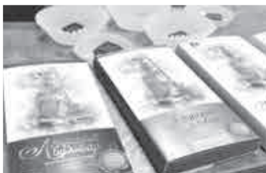
Хабаровский шоколад сделан на основе только натуральных ингредиентов

Но эта тертая масса очень сильно горчит. Ее нужно измельчать и длительно коншировать, то есть перемешивать. Для этого шоколадную смесь помещают в специальные резервуары, похожие на большие миксеры. В них она смешивается и подогревается длительное время.