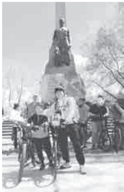
Участники акции у хабаровского «Памятника партизанам».

И спорт, и память объединились в одной акции