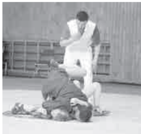
Девчонки тоже любят борьбу!

Как сообщили в Минспорта края, участниками турнира в Хабаровске стали юноши и девушки от 14 до 16 лет. Они разыграли медали в девяти весовых категориях. Всего на коврах СК «Авангард» встретились около 200 самбистов из восьми регионов страны – Хабаровского, Приморского, Камчатского, Забайкальского краев, Свердловской, Сахалинской, Амурской областей, ЕАО и Якутии. В копилке спортсменов из Приморья края оказалось пять золотых медалей, у Амурской области – три, по одной золотой медали у Бурятии и Магаданской области. Ну а на счету хабаровских борцов – 27 медалей. Из них – семь золотых, пять серебряных и 15 бронзовых. Эти соревнования стали также дополнительным отбором для участия в первен-