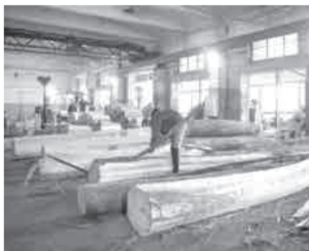
Здесь создано 70 рабочих мест.

Благодаря поддержке правительства Хабаровского края и региональному Фонду развития промышленности, предприятие получило