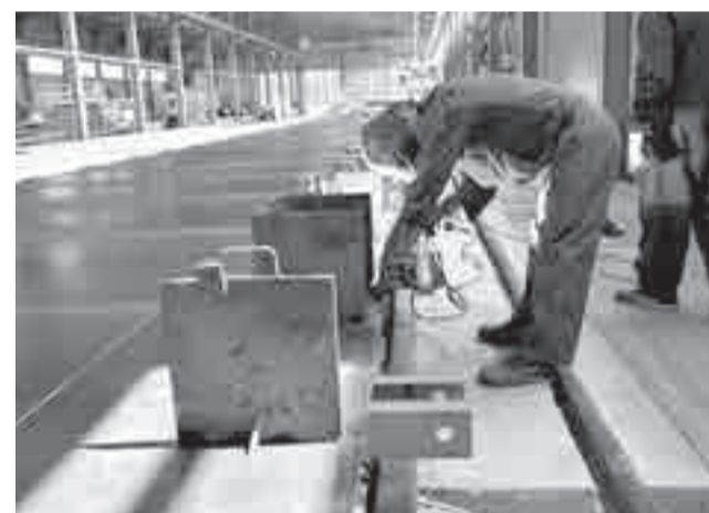
Дом из конструктивных элементов из железобетона можно собрать, как в конструкторе Лего.

очень нужны. Мы должны строить быстро, качественно, и без собственных предприятий, выпускающих строительные материалы, нам не обойтись. Предприятие это входит в промышленно-строительный кластер, созданный на территории края по поручению президента России Владимира Путина.