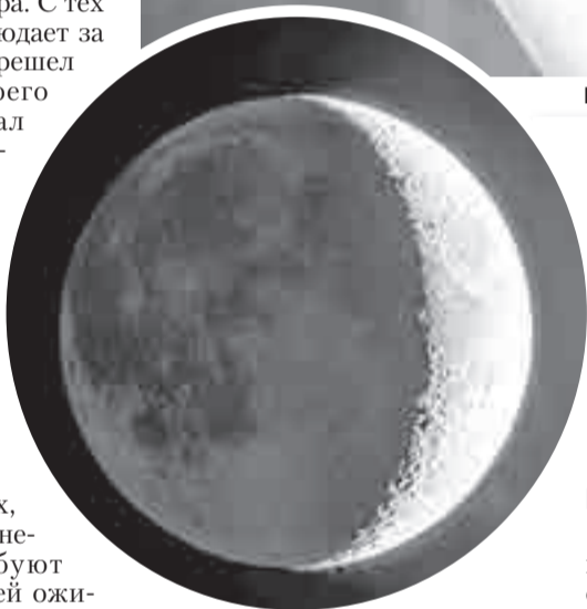
Лучше всего рассматривать Космос после грозы.