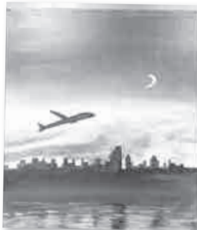
Её жизнь похожа на взлёт самолёта – к своей мечте.

маслом на курс «Магистратура живописи 5.0».