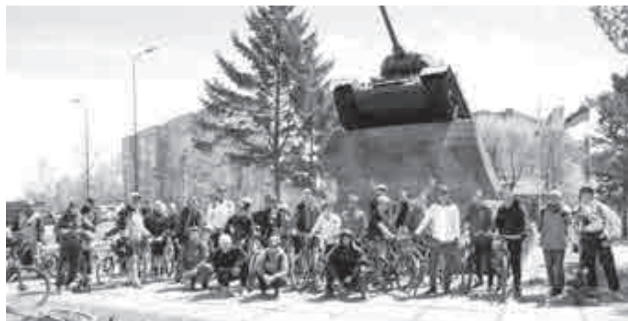
Велосипедисты возле памятного танка.

И вот первая остановка – у памятника «Танк Победы» Т-34 в районе завода «Дальэнергомаш». Напомним, эту боевую машину здесь установили