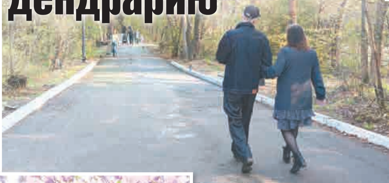
Дендрарий стал любимым местом прогулок хабаровчан.