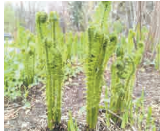
Любители искать цветок папоротника ждут в дендрарии в ночь на Ивана Купалу.