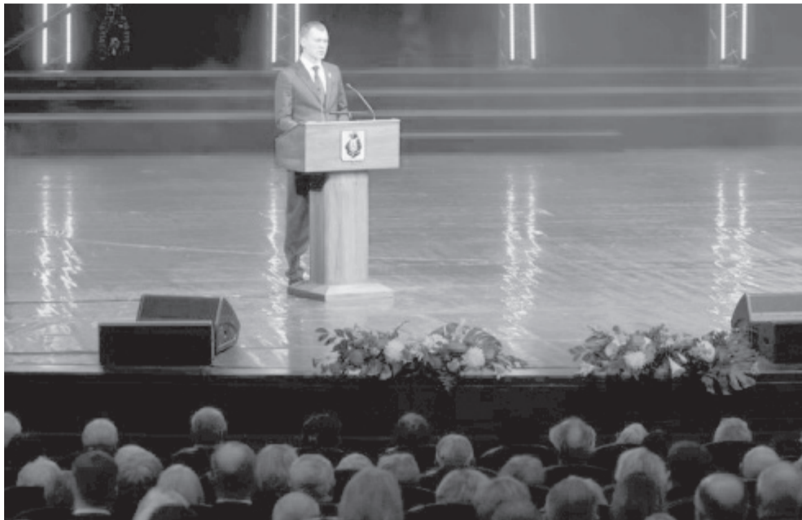
Фигуру Дегтярёва некоторые столичные эксперты сочли «символической».

«НГ» спросила у экспертов, возможен ли некоторый отход от нынешней концепции варягов-технократов, скажем, в порядке эксперимента. Например, в ходе чрезвычайных происшествий разного рода выяснилось, что назначенцы из федерального центра не всегда