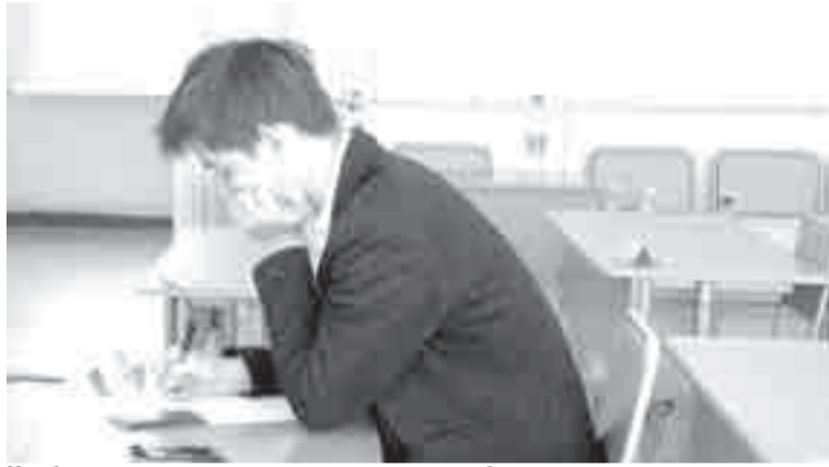
Чтобы получить аттестат, нужно написать базовую математику минимально на 27 баллов, а русский язык – на 24.

– При организации Единого государственного экзамена нет требований по проведению в зданиях школы. У нас на территории Хабаровского края определено 90 пунктов для сдачи ЕГЭ, а школ 380. Конечно, экзамены сдают не в каждой школе. Для массовых предметов, как