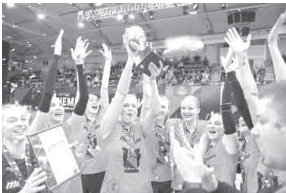
Радость игроков и болельщиков трудно передать.

Женский волейбол в Хабаровске – всерьез и надолго?