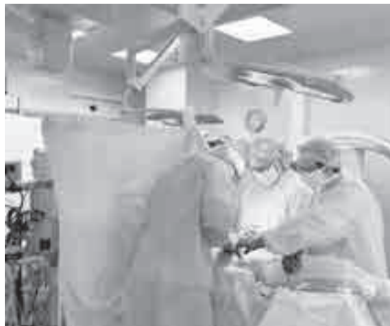
Операция по замене тазобедренного сустава длится около полутора часов.

– Благодаря эндопротезированию человек может