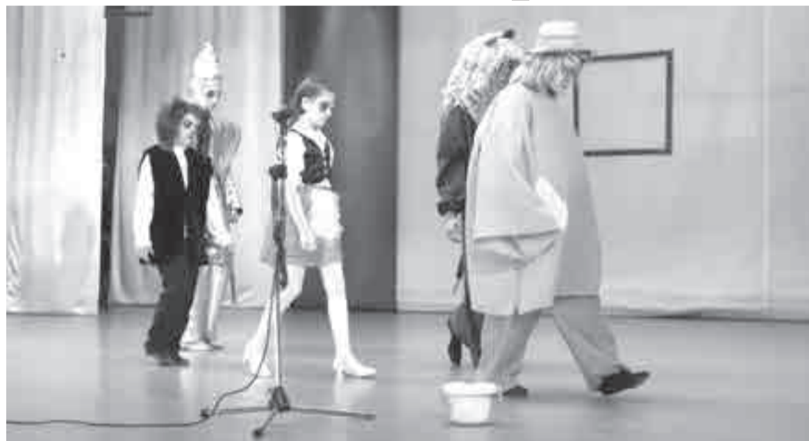
Фрагменты яркой постановки «Волшебник изумрудного города» показала театральная студия «Калипсо» из Перевьяславки.

яркой постановки «Волшебник изумрудного города» (0+) от театральной студии «Калипсо» из Перевьяславки.