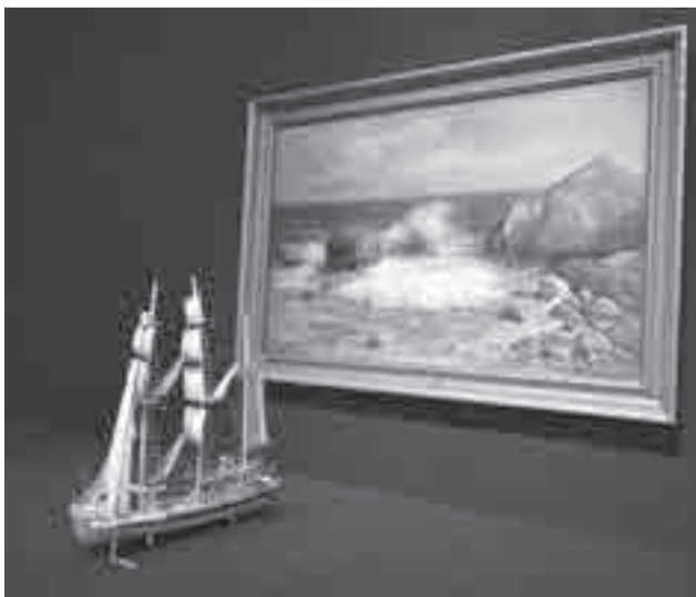
На выставке представлены экспонаты, рассказывающие о прославленном исследователе Витусе Беринге.