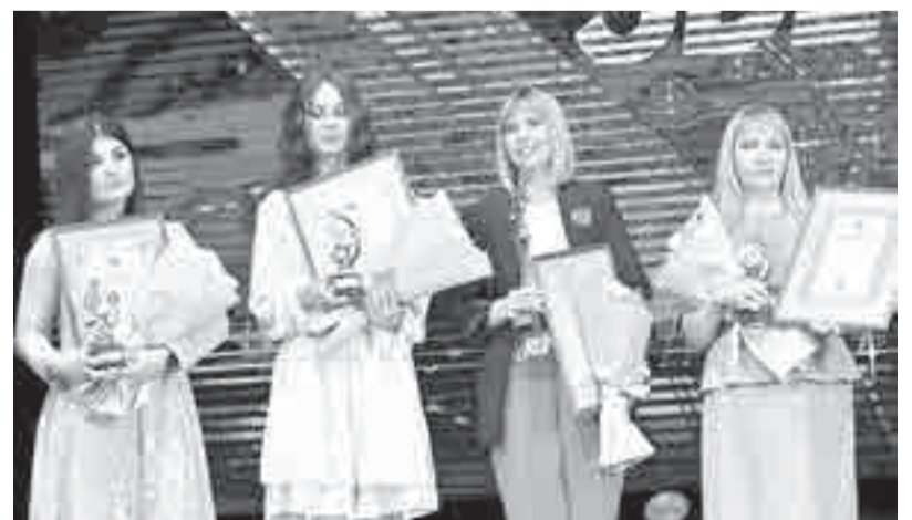
В этом году в конкурсе «Педагогический звездопад» приняли участие 90 человек. Фотокhv27.ru