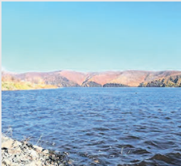
Вода продолжает убывать.

ем водного режима Амура и других рек ведется круглосуточно. Группировка спасателей готова оперативно отреагировать на любые нештатные ситуации.