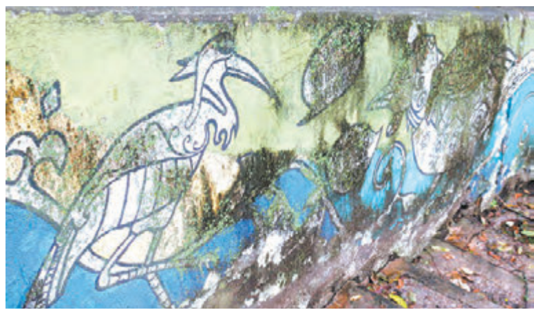
Археологи, раскопав когда-нибудь эти наскальные росписи, будут, наверное, гадать - почему местные племена не сберегли их?

А вопрос об исторической ценности объекта возник, потому что в мэрии однажды (в 2014 году) решили – лестница не нужна, а нужен сквозной автопроезд на бульвар. Тема даже выносилась на обсуждение, расколов общественность на две равные части: «за», то есть снести, и «против», то есть отреставрировать.