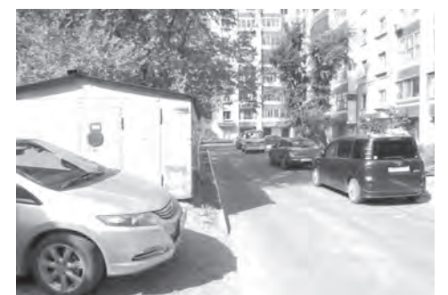
Большинство хабаровских дворов ныне представляют парковки, забитые машинами вдоль и поперек.