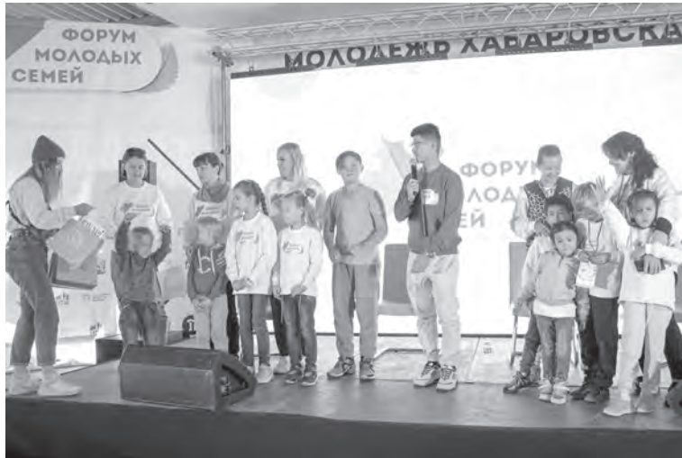
Награждение участников форума.

«Форум молодых семей» три осенних дня проходил на базе загородного оздоровительного лагеря «Мир детства». Все эти дни молодые семьи, среди которых были молодожены и семьи со стажем, без детей и многодетные, учились быть дружнее, разбирали свои проблемы с профессиональными психологами, узнавали способы ведения бизнеса, получали ответы от специалистов на вопросы, связанные с мерами господдержки и ипотекой, а еще ходили на мастер-классы и занимались спортом. В общем, жили на всю катушку!