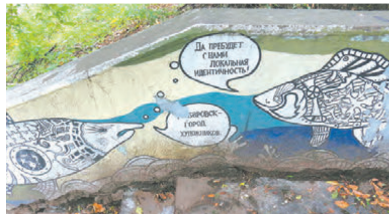
Рисунки выполнены в стиле иллюстраций Геннадия Павлишина и стимпанка.