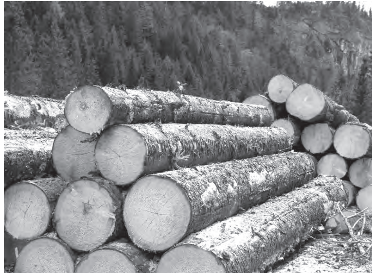
С нового года вступает в силу запрет на экспорт круглого леса, поэтому лесопромышленники начали модернизировать свои производства.

Создать в регионе дальневосточный кластер строительных материалов предложили недавно краевые власти. Эта инициатива получила поддержку президента страны.