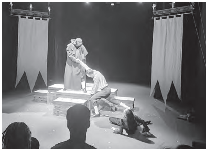
Не стоит давать руку Командору...