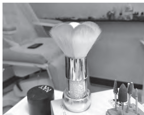
Инструменты только высшего класса.