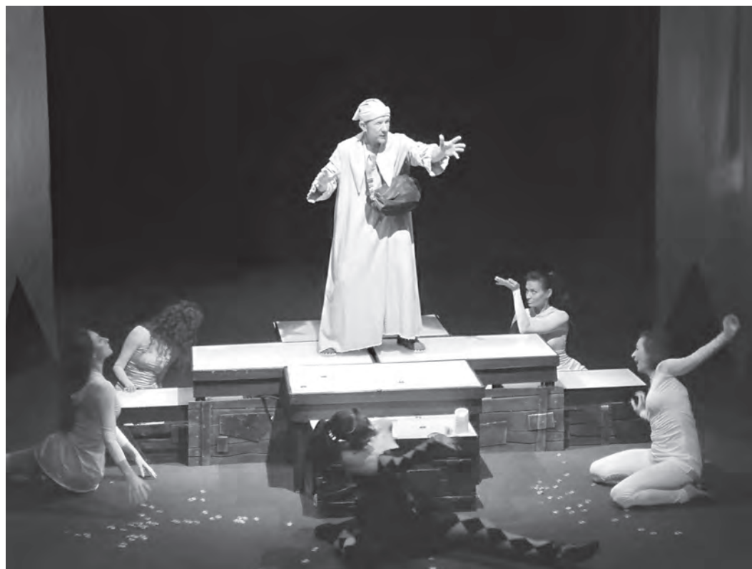
Скупому рыцарю среди сундуков нескучно.

Вот и ныне в новой, непросто давшейся труппе постановке главным закономерно