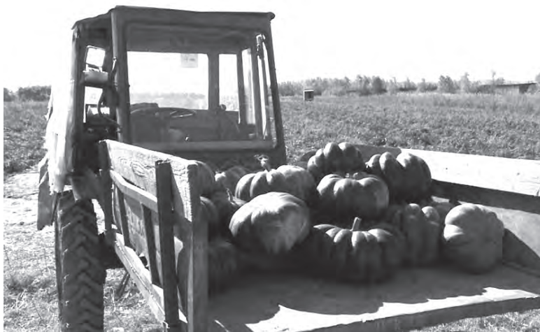
Хэллоуин близко. Похоже, хабаровчанам пора переходить на тыкву?