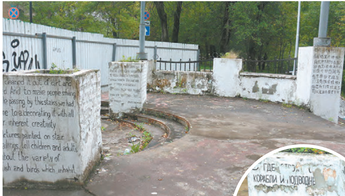
Ныне объект за забором неувлимо напоминает английскую достопримечательность. Вот только туристов сюда не водят, да и горожане его уже два года не видят...

Если память автору не изменяет, тогда даже разработали целых три проекта реконструкции этого участка улицы, но от всех пришлось отказаться.