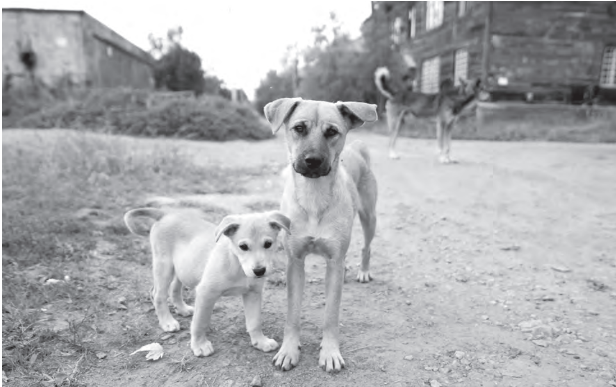
Собаки веками живут рядом с человеком, а мы все-то не можем научиться делать это цивилизованно.