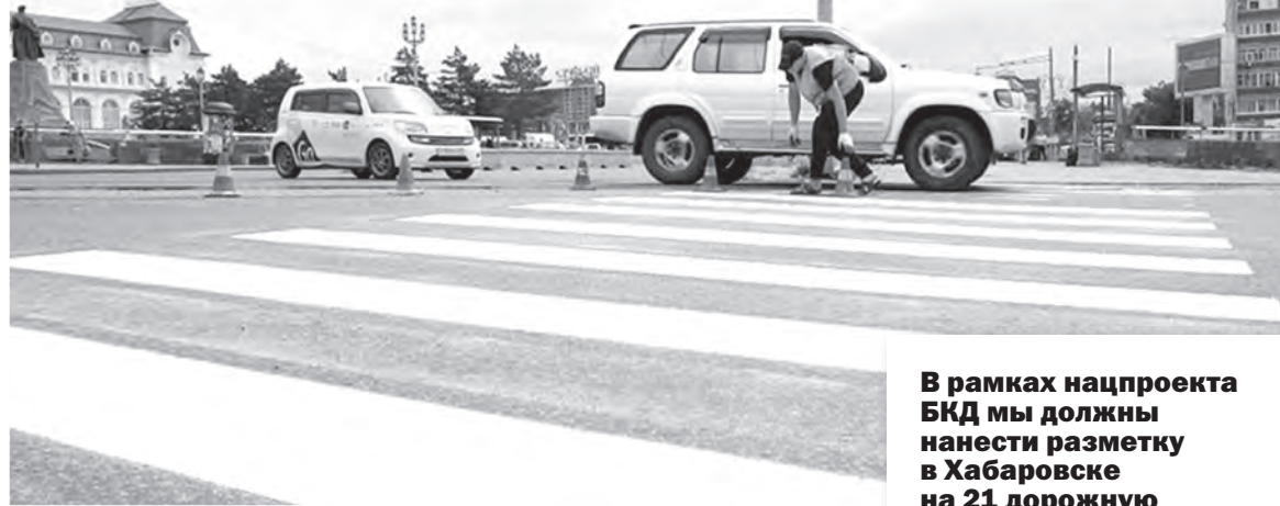
Работы по разметке проходят в городе с апреля по октябрь.

Как наносят разметку на дороги Хабаровска