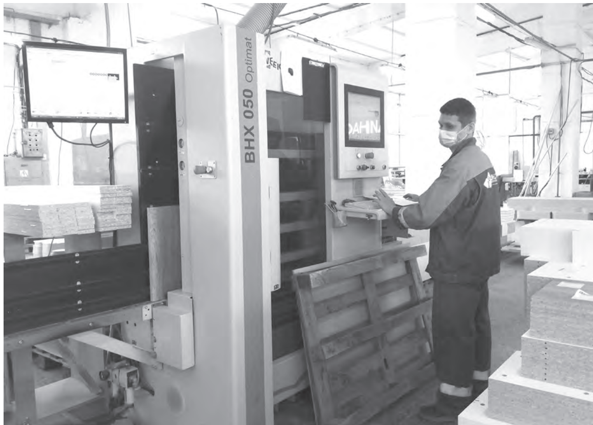
Предприятия края являются лидерами по переработке древесины в ДФО.

Краевые власти помогут лесопромышленникам