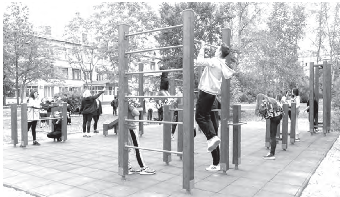
Как сообщали перед выборами в краевом правительстве, для сдачи нормативов ГТО всего в образовательных учреждениях региона появится 100 спортплощадок. Из федерального бюджета на эти цели выделено более 150 млн руб. 17 сентября отработали: уже завершается «поставка оборудования для 13 объектов. Работы будут вестись в течение учебного года».

Но нет ни скандала, ни обстоятельного разбора полетов. Во-первых, всех уже наградили и запустили новую спортивную стратегию, согласно целям которой к 2030 году систематически заниматься физкультурой будут уже 70% россиян! Во-вторых, в Кремле тоже поверили данным Минспорта, будто 10% россиян ходят в бассейн, и потребовали, чтобы у всех российских школьников был