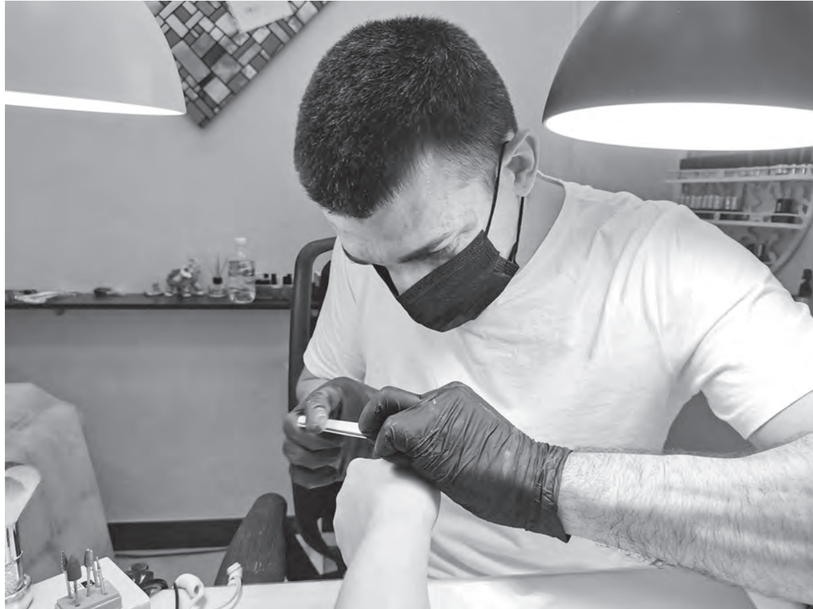
В процессе создания красоты.

Как парень с окраины попал в индустрию красоты