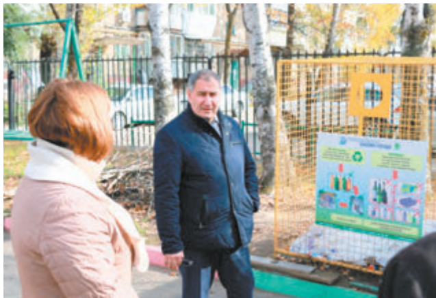
Министр ЖКХ края разъясняет преимущества раздельного сбора мусора.

Краевые власти экологически мотивируют хабаровчан