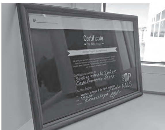
Один из сертификатов Захара.