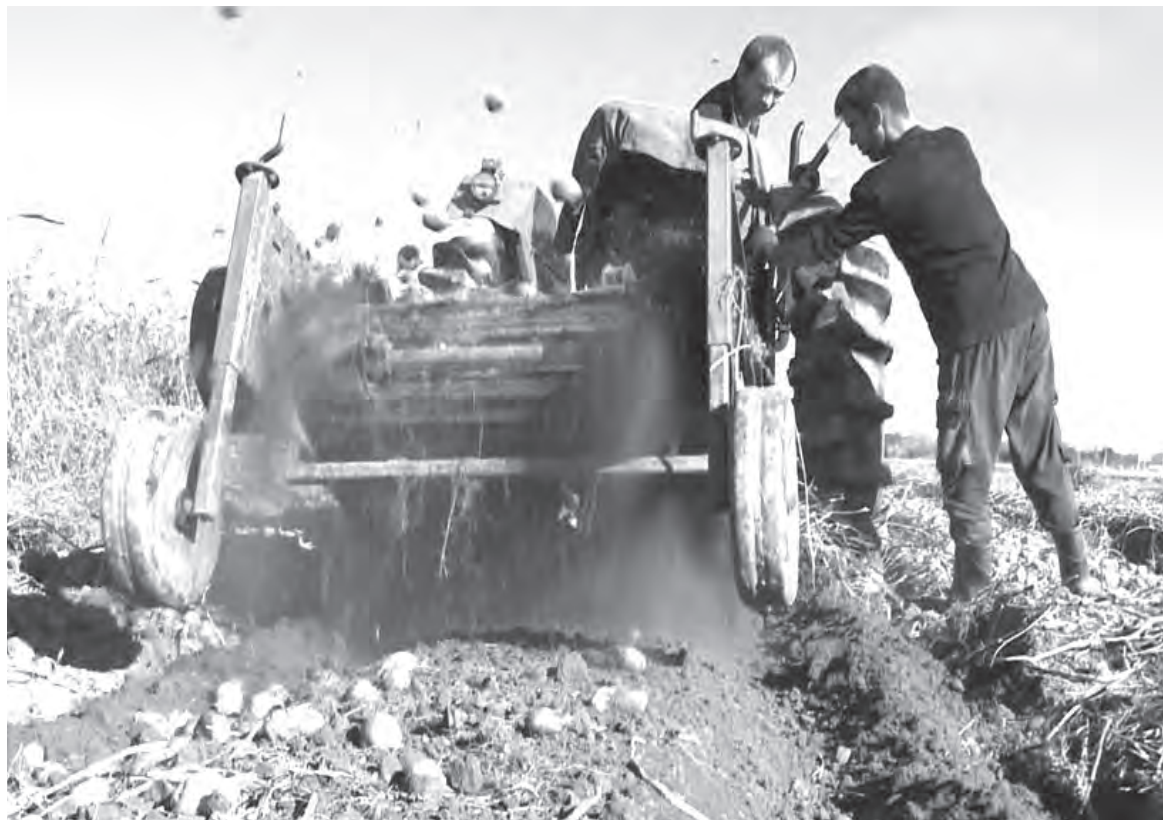
Идет сбор урожая - только картошка летит!

блей за килограмм. Ближе к весне этот овощ из семейства пасленовых неминуемо еще рванет в цене.