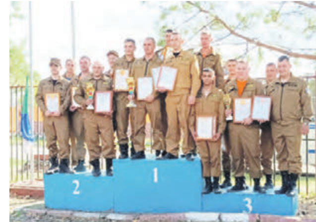
На пьедестале - лучшие из лучших!

Региональные соревнования среди подразделений Противопожарной службы Хабаровского края прошли 7 и 8 октября в городе Бикин. В мероприятии, посвященном 83-й годовщине образования нашего края, участвовало шесть сильнейших команд газодымозащитников, сумевших одержать победу на предварительных отборочных состязаниях.