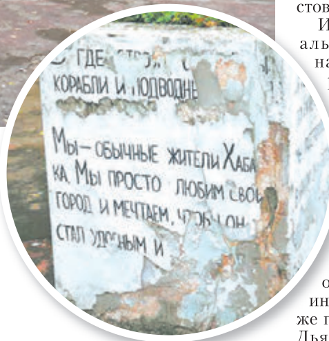
Манифест энтузиастов с признанием к любви городу за пятилетку порядком истеря.

«Рыбы Амура» – так назывался ролик на YouTube Олега Легкого. Это записанный на его телефон в 2012 году домашний концерт для бабушки и дедушки