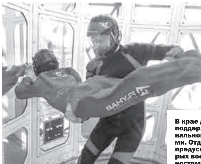
Без помощи инструктора на первых порах не обойтись.

проработать основные упражнения на детях уже в условиях аэротрубы. И потом уже инструкторы отрабатывают с детьми полученную в теории информацию.