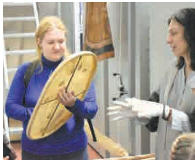
Вот это бубен!