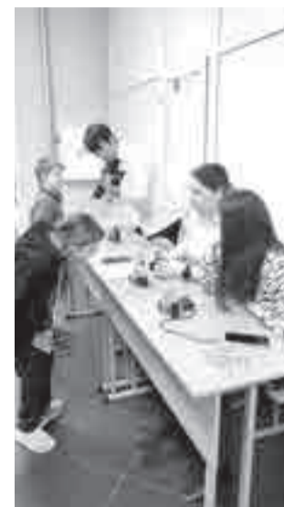
Студенты рассказывают о фотоаппаратах.

с участником СВО. Как говорят организаторы, участники особой смены долго не хотели отпускать молодого ветерана боевых действий, засыпая гостя в форме расспросами о службе, а также – об его увлечениях, мечтах и планах на будущее. Интересно, какой вывод для себя ребята сделали из этой встречи?