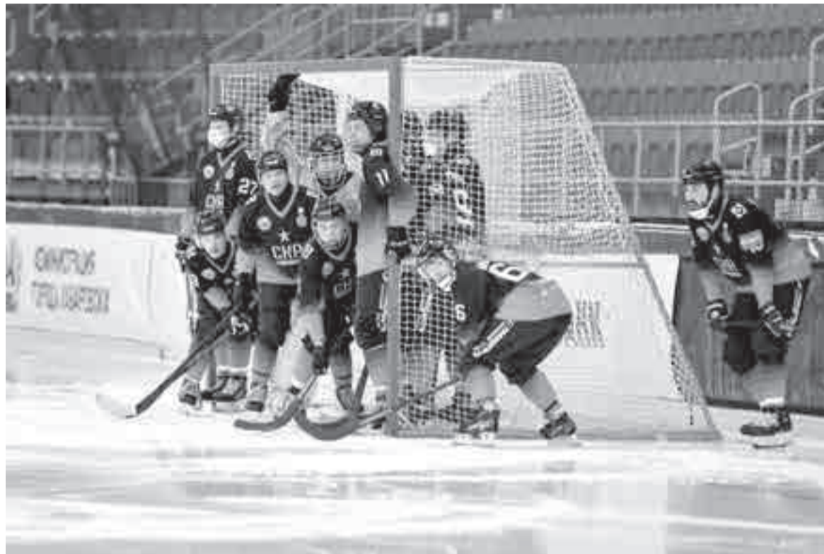
Что ждет наших «бендистов» в новом сезоне?

В рамках федерального проекта «Спорт – норма жизни» (нацель «Сохранение населения, здоровье и благополучие людей») предусмотрено создание для всех категорий и групп населения условий для занятий физкультурой и спортом, массовым спортом, в том числе повышение уровня обеспеченности населения объектами спорта, а также формирование спортивного резерва в регионах РФ.