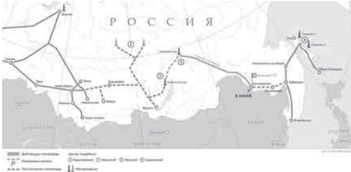
Действующие и возможные маршруты газопроводов. Инфографика: ПАО «Газпром»

Новые маршруты экспорта газа пройдут по ДФО