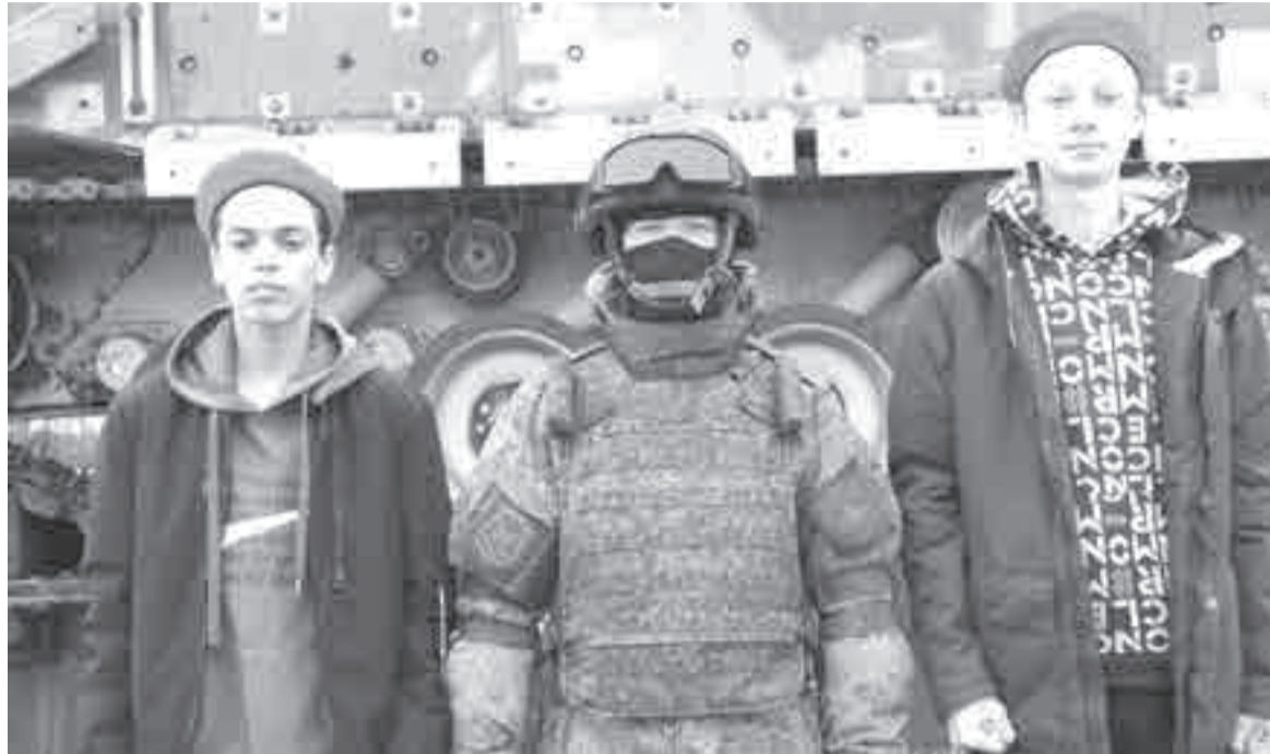
Вокзал Хабаровска 31 марта посетил тематический агитпоезд Минобороны РФ «Сила в правде» (16+). В ходе митинга с участием военных, чиновников, священнослужителей и общественников состоялся концерт и церемония вступления свыше 20 школьников города в ряды «Юнармии». Также на перроне был развернут мобильный пункт отбора на службу по контракту, сообщили в пресс-службе ВВО.

Призывной контингент стал немного старше