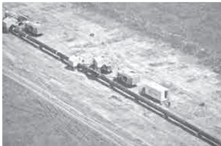
«В 2011 году «Газпром» ввел в эксплуатацию первый пусковой комплекс ГТС «Сахалин – Хабаровск – Владивосток». Общая протяженность газопровода превышает 1800 км, при полном развитии система будет обеспечивать возможность транспортировки около 30 млрд куб. м сахалинского газа», указывает gazprom.ru .

Козьмино до 42 млн тонн нефти ежегодно. Причем проработана дополнительная возможность приема портом сырья по железной дороге. Была расконсервирована железнодорожная станция Грузовая, примыкающая к терминалу (на первом этапе создания ВСТО перевозки нефти в Козьмино осуществлялись железнодорожным транспортом, после завершения прокладки трубопровода потребность в них отпала). В четвертом квартале 2026-го планируется построить нефтеперекачивающую станцию в Иркутской области с тем, чтобы увеличить отгрузку нефти в цистернах со станции Мегет в направлении Приморья – с двух до семи миллионов тонн.