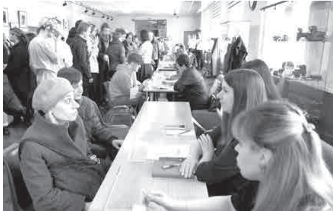
На ярмарках вакансий всегда многолюдно.

силами. Также два несовершеннолетних племянника вносят посильный вклад в бизнес.