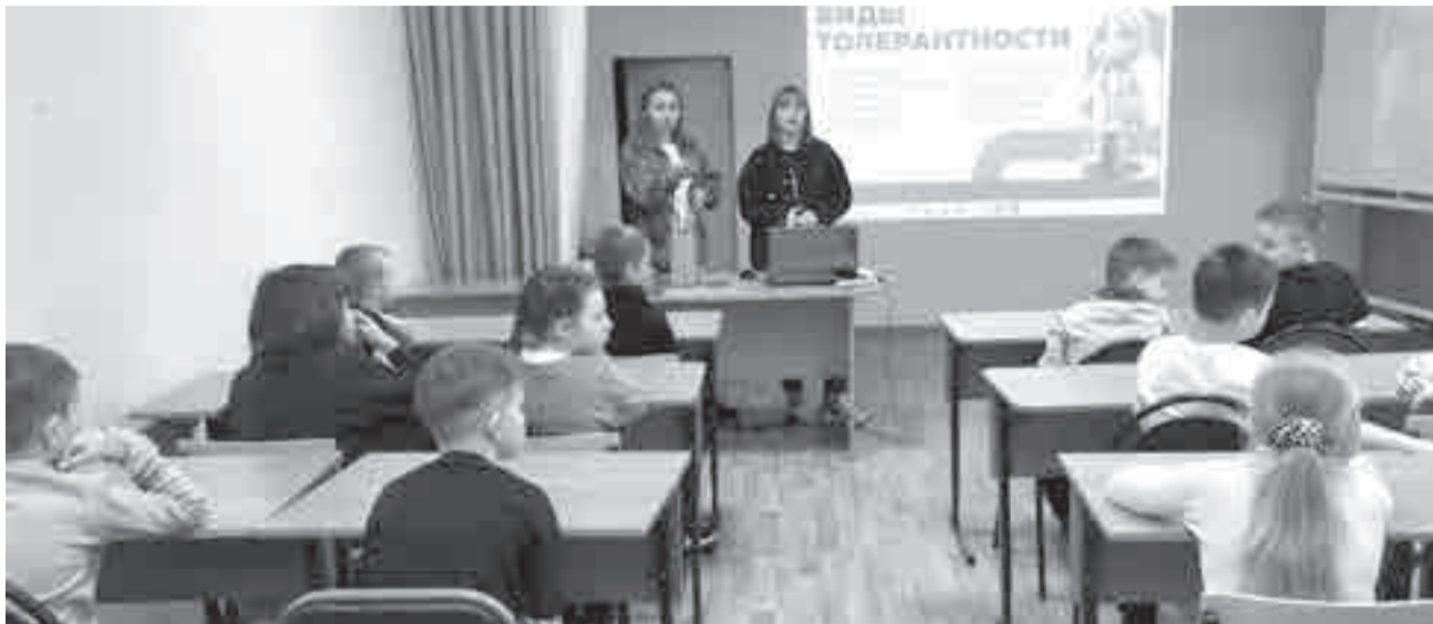
Лекция о толерантности.

Как отдыхают подростки. Трудные и не очень