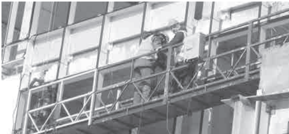
От 2,5 млн до 5 млн чел., по разным оценкам, не хватает рынку труда РФ. В частности, на дефицит кадров очень жалуются строители.

Россияне перестали тревожиться из-за вакансий