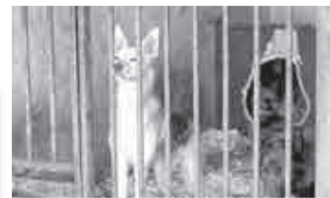
Чтобы обеспечить всем дворнягам крышу, у государства пока не хватает ресурсов.

Телефоны «горячей линии» по вопросам безнадзорных животных для жителей Хабаровска: