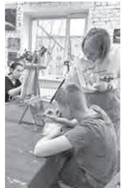
Учить рисовать – это может быть бизнесом.

И еще одна важная новость пришла недавно из краевого комитета по труду и занятости населения. Определены даты проведения всероссийской ярмарки трудоустройства «Работа России».