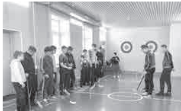
А вы когда-нибудь играли в «флорбол»?

Что ж, каникулярная неделя у хабаровских ребят