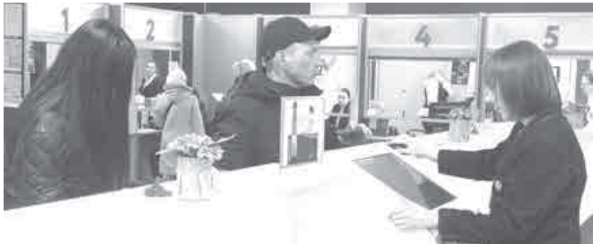
Наиболее частый запрос к юристам в МФЦ – установление факта проживания в крае.

бесплатной юридической помощи гражданам КГКУ «ОСЭП Хабаровского края, МФЦ».