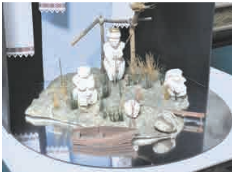
Здесь было много интересного...

интерактивный формат, сами отвечали на вопросы экскурсоводов, рассматривали предметы быта, «собирали» избу из разных элементов старого быта.