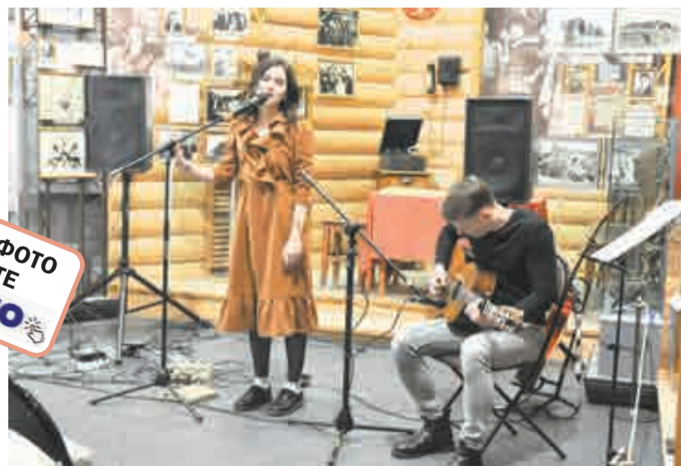
Песни в ночном «купе».

В этом году Гродековский музей отмечает свое 130-летие. В рамках юбилейных мероприятий сотрудники краевого учреждения, как водится, задумали новые акции, выставки, проекты и программы.