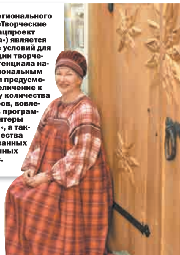
Здесь гостям рады!

Целью регионального проекта «Творческие люди» (нацпроект «Культура») является создание условий для реализации творческого потенциала нации. Региональным проектом предусмотрено увеличение к 2024 году количества волонтеров, вовлеченных в программу «Волонтеры культуры», а также количества реализованных выставочных проектов.