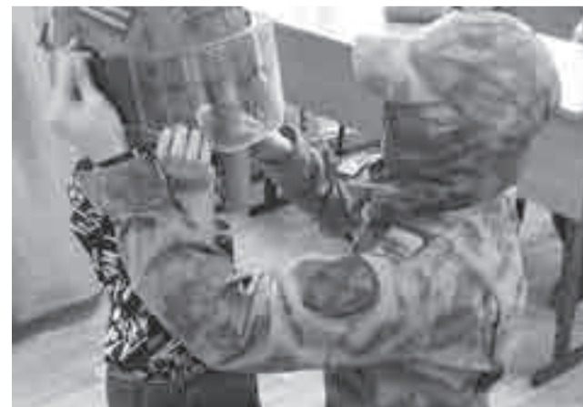
Каска от бойца СВО.