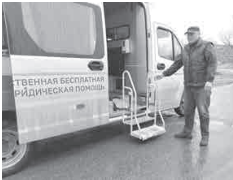
«Юрмобиль» готов к приёму клиентов.