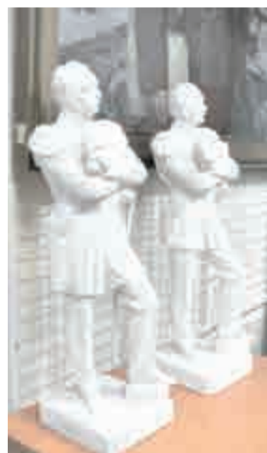
Двое из ларца?