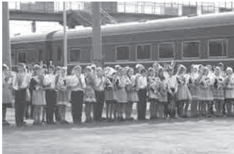
Приморские школьники встречают бронепоезд товарища Ким Чен Ына, осень 2023 г.

не только пускают, их привлекают. В системе образования КНДР есть специальные люди, чья работа привлечь на международную смену детей со всего мира, а у них есть агенты, работающие на гонораре. Вроде вербовщиков или зазывал – вот как я, например. Но я просто предлагаю родителям путевки, расписываю плюсы, предупреждаю о минусах. Привлек – хорошо, лишний тенге, не привлек – не страшно. А вот северокорейскому ответственному за привлечение, если мало стран привлек – выговор, а то и штраф. Зато, если много – премия.