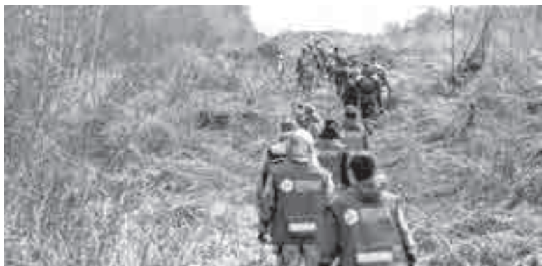
Операторы горячей линии Национального центра (8800-700-5676) могут связаться с поисково-спасательным отрядом в конкретном регионе для оперативного выезда на место пропажи ребенка.