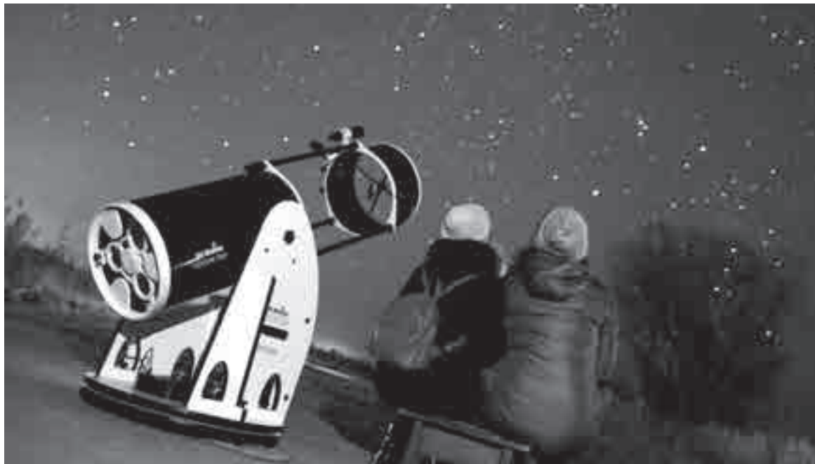
Пока одни уже реализуют космические мечты, другие продолжают мечтать.

Пока все значимые проекты отнесены на начало 2030-х