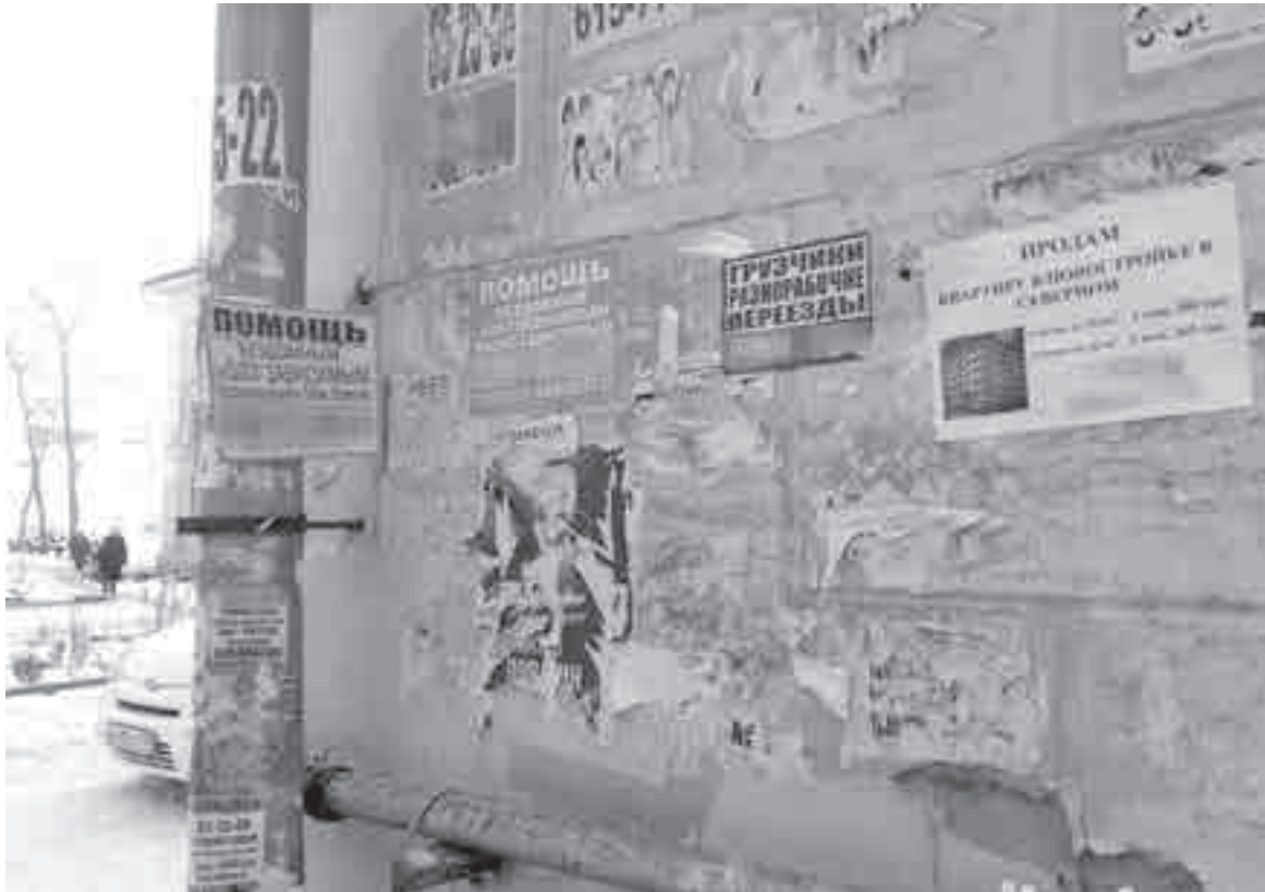
Отчаявшись, начинаешь звонить даже по таким объявлениям. Но лучше так не делать!

Завершение этой истории было совсем некрасивым. На назна-