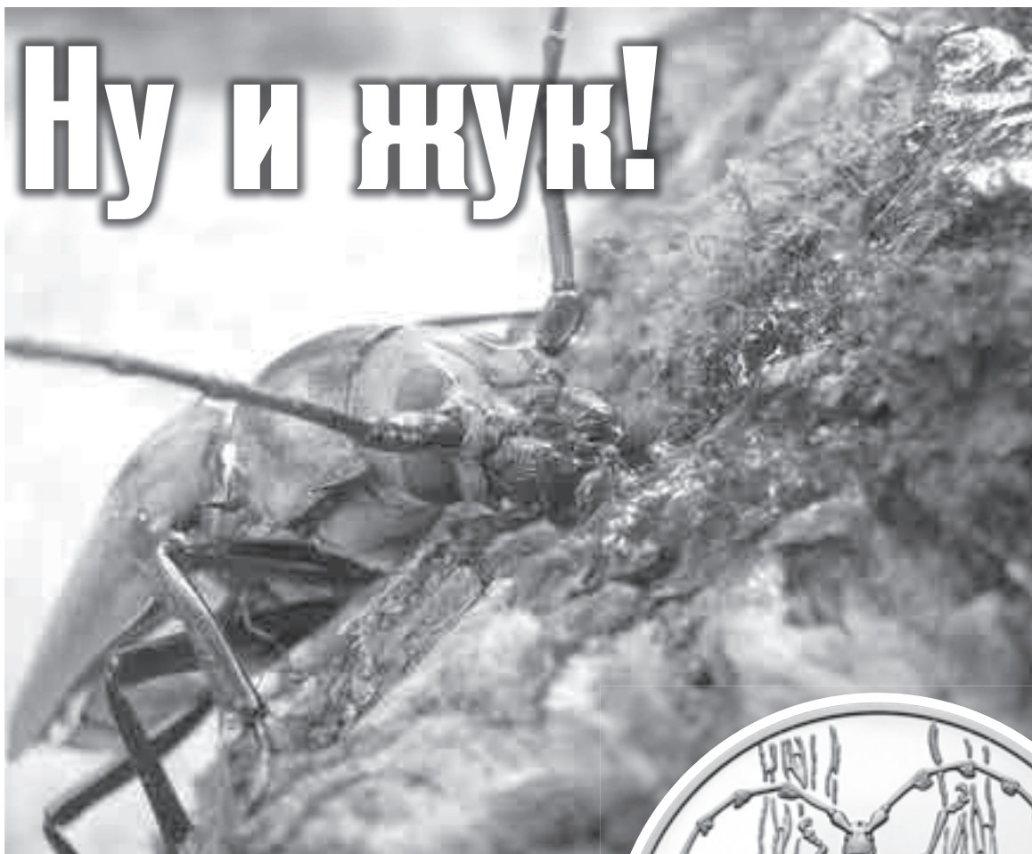
Уссурийский реликтовый усач достигает длины 11 сантиметров, а при благоприятных условиях – и больше.

В чем же изюминка именно этого вида? Оказывается, уссурийский реликтовый усач жил еще в третичный период