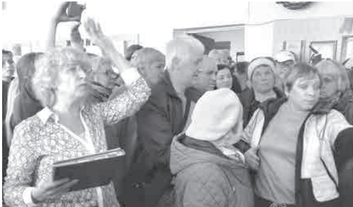
В такой жаркой атмосфере шло обсуждение.