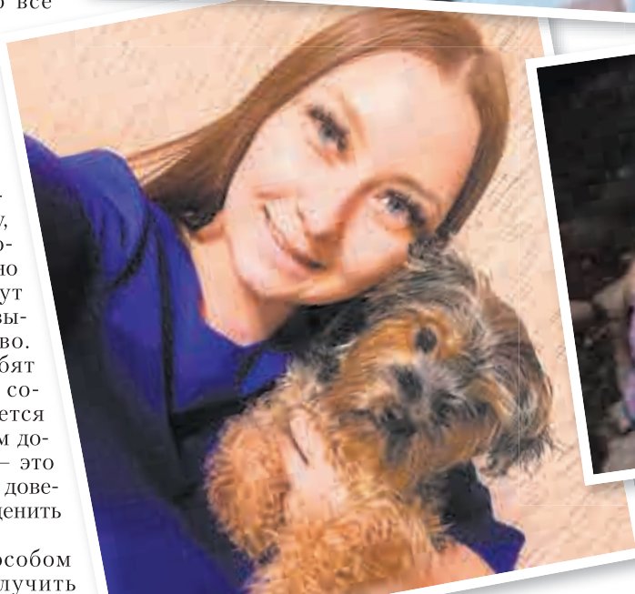
В семье Светловых до сих пор гадают, кто мог жестоко избивать маленького Тэдди?