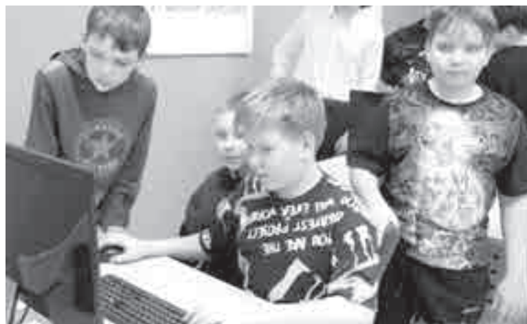
Проект рассчитан на самых юных любителей космоса.