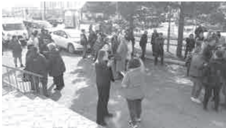
На улице тоже кипели страсти.