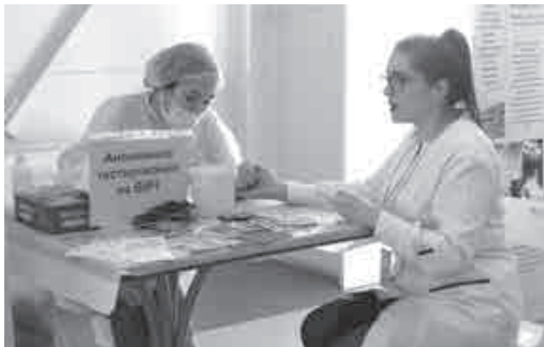
Здесь бесплатно можно было пройти самые разные обследования.

Более 90 человек посетили площадку КДЦ «Вивея», где можно было пройти компьютеризован-