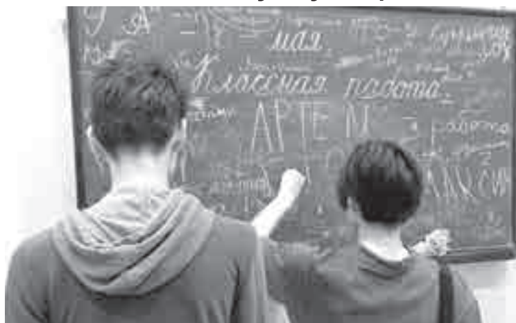
Баловаться любят даже старшеклассники, а вот серьезно учиться – тут без помощи взрослых практически не обойтись...

Сколько стоят услуги репетитора в Хабаровске