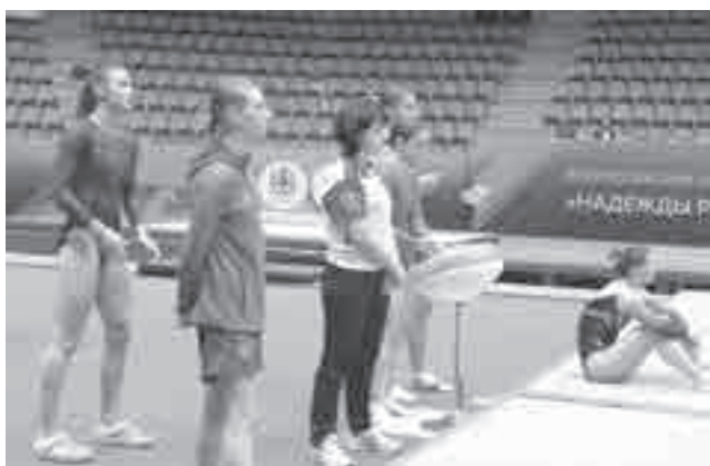
Наблюдая за соперниками...

До 70% увеличить к 2030 году долю граждан, систематически занимающихся физкультурой и спортом, таков показатель для поставленной президентом национальной цели «Сохранение населения, здоровье и благополучие людей». В Хабаровском крае для достижения этой цели реализуется нацпроект «Демография» и федеральный проект «Спорт – норма жизни».