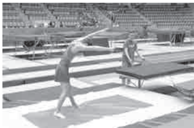
Выступление на дорожке.

тренер РФСР и сборной Красноярского края.