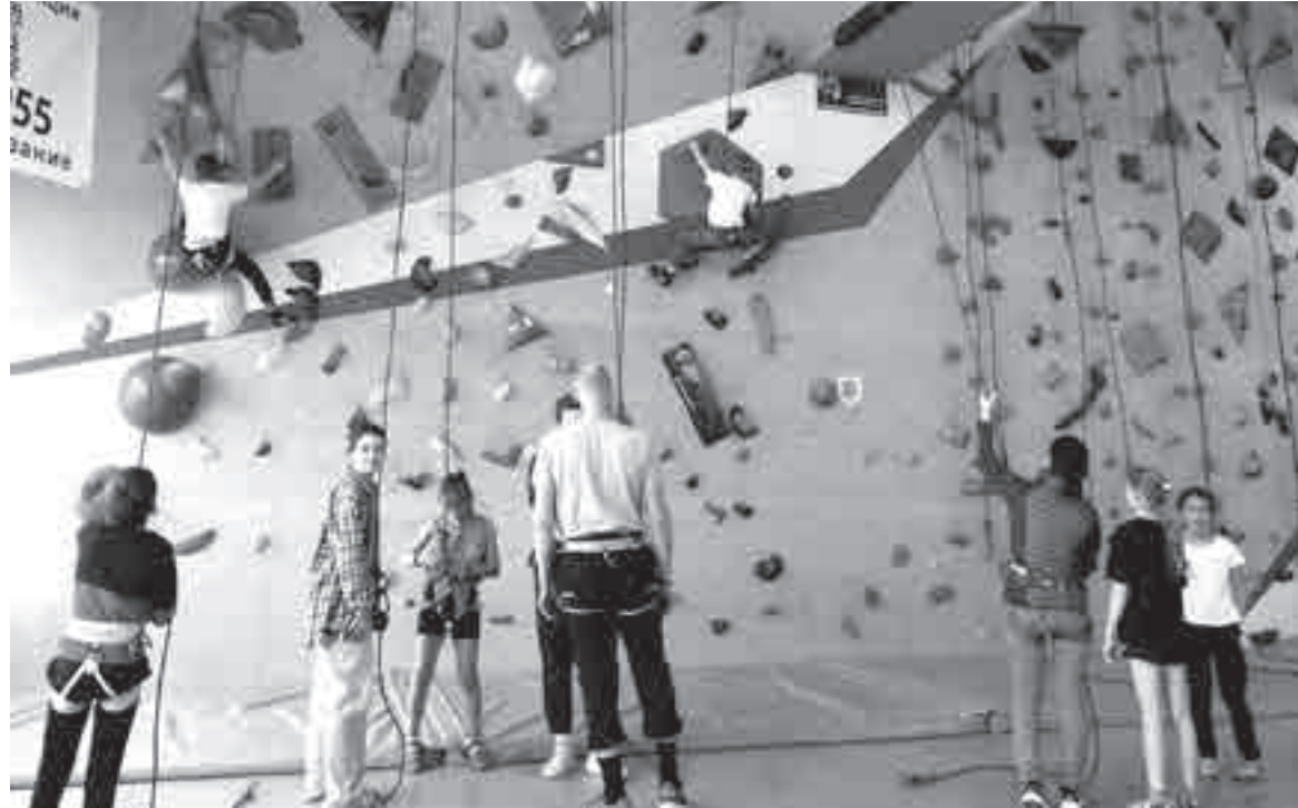
Попробовать себя в роли скалолазов хотели многие...

свои рекомендации от врачей. К слову, всего на фестивале было представлено 21 медучреждение. И нужно было лишь обратиться одному из 45 специалистов, чтобы пройти то или иное обследование. Здесь можно было сдать анализ крови, проверить зрение и слух, посетить терапевта или стоматолога.