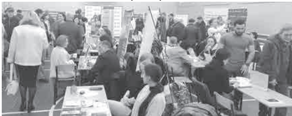
В спортзале техникума было многолюдно.

ярмарке трудоустройства «Работа России. Время возможностей», которая в рамках нацпроекта «Демография» проходит во всех муниципальных районах региона. У нас, в краевом центре, работодатели встречались с потенциальными сотрудниками в