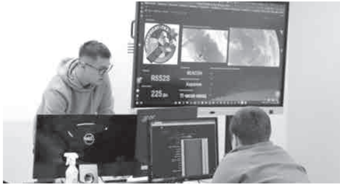
Теперь на базе центра «ТЕХНО-ИТ-куб» можно круглосуточно следить и принимать данные от космических спутников.

юных любителей космоса – младших школьников и подростков. Благодаря этой инициативе ребята смогут приблизиться к новой для себя сфере, изучить, как работают спутники, какие данные они передают, как расшифровываются графики, что это за странные таблицы и кривые. И, возможно, даже юные хабаровчане так смогут приобщиться к перспективной профессии будущего?