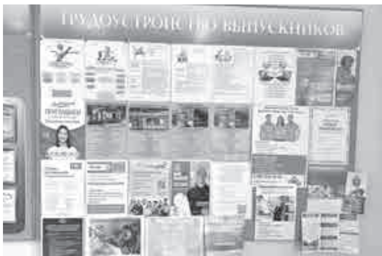
Вакансий много, а вот людей для них не хватает?