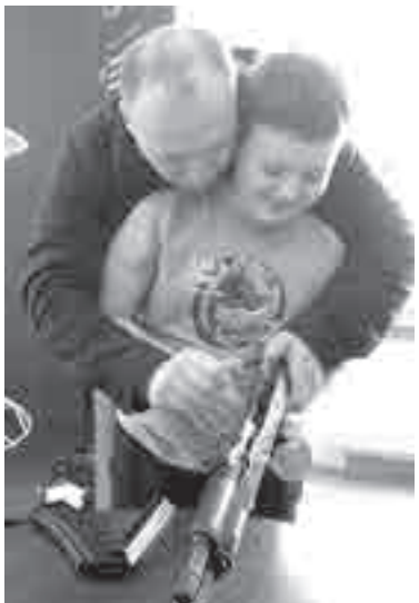
Как разборка и сборка автомата вписывается в концепцию ЗОЖ?

Действительно, где еще в наше время можно бесплатно и быстро пройти обследование всего организма, если вы, конечно, не призывник? А тут всего за пару часов вас проверили полностью, да и еще и самые разные врачи давали