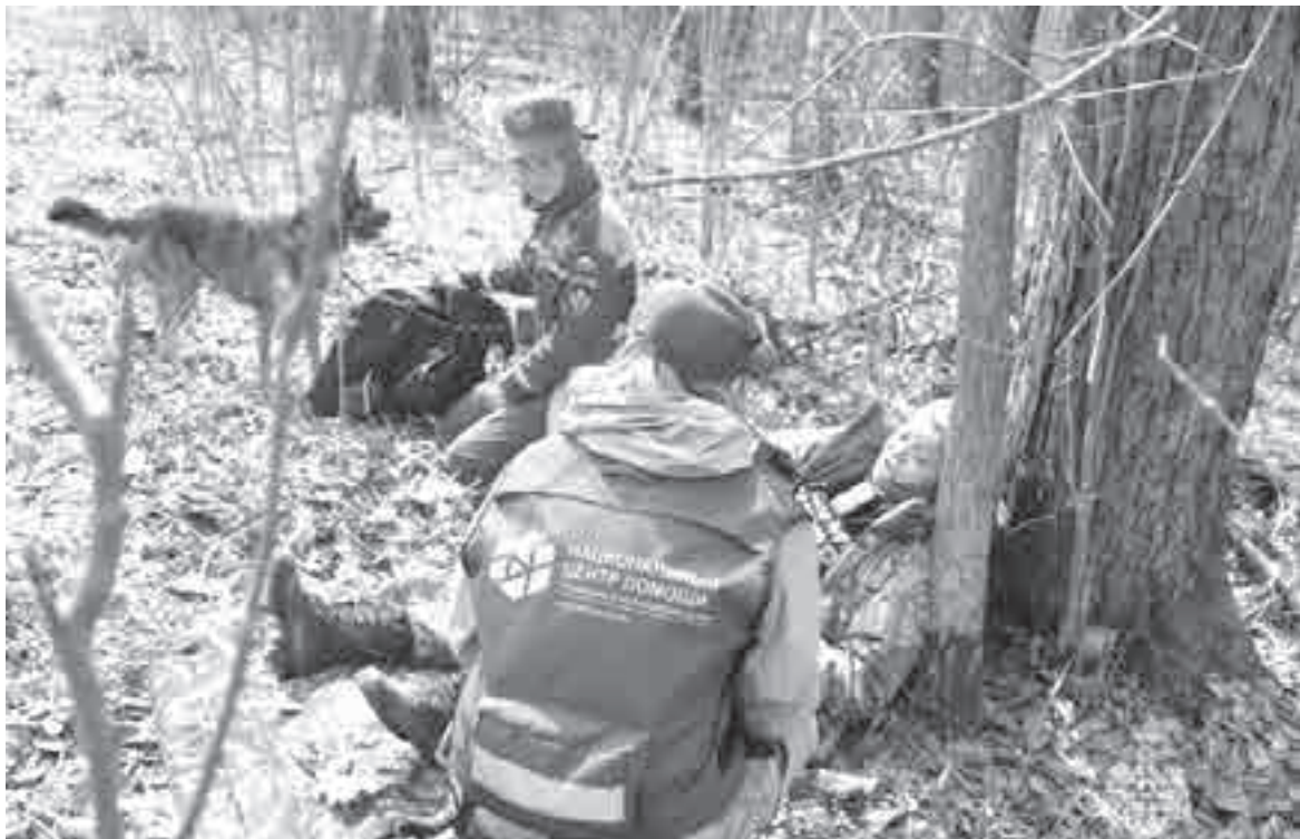
Спустя четыре часа спасатели нашли звонивших.