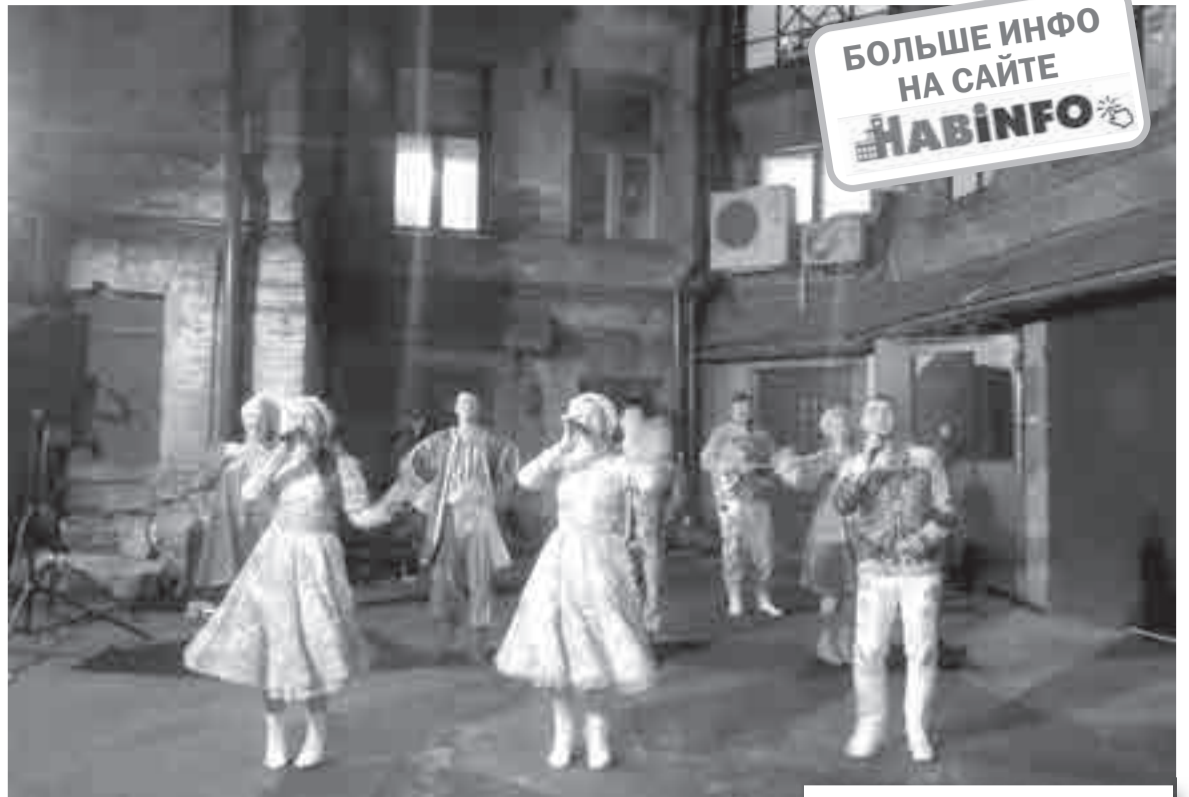
Концерт в библиодворике был зажигательный, но мы все равно замерзли...

Познакомили нас на экскурсии и с понятием «экслибрис» (знак хозяина книги – что-то вроде личной печати или подписи), показав на примере, какими картинками в 18 и 19 веках обозначали себя владельцы книжных изданий. По некоторым даже можно было понять, где человек жил или откуда он родом. Впечатлила и выставка редкостей – от громадных старинных фолиантов