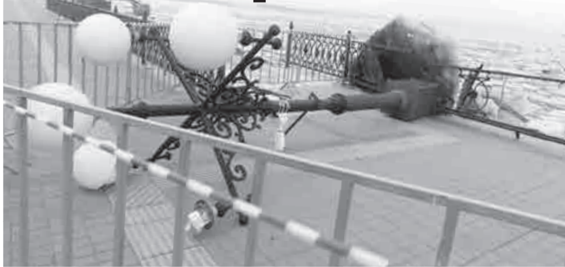
Фонарь и паранет не выдержали натиска льда.