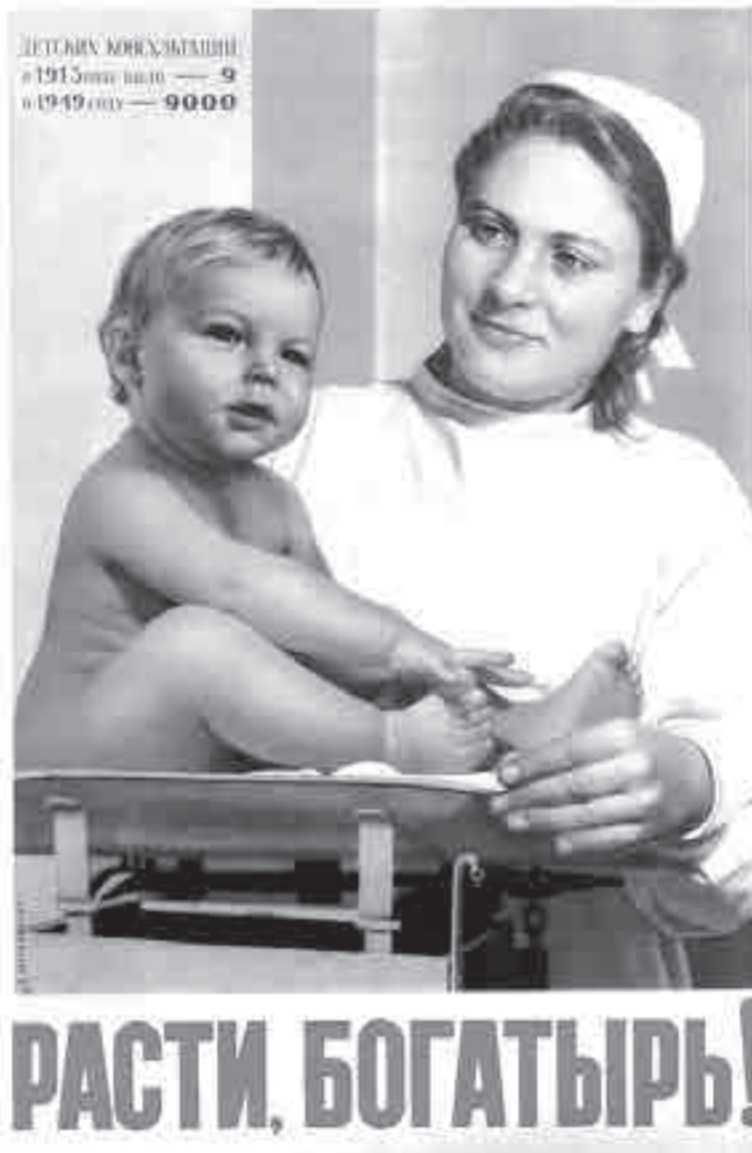
Сов. плакат, 1950 г., Худ. Б. Березовский, А. Дружков

«Для преодоления негативных тенденций необходимо проведение системной семейной политики и политики стимулирования рождаемости», – считают в Институте ВЭБа. Какие могут потребоваться шаги? Допустим, к мерам, которые могли бы обеспечить демографическое развитие страны именно по оптимистическому сценарию, эксперты Института ВЭБа отнесли не просто продление программы материнского капитала до 2030 года, а доведение маткапитала на второго ребенка и последующих детей