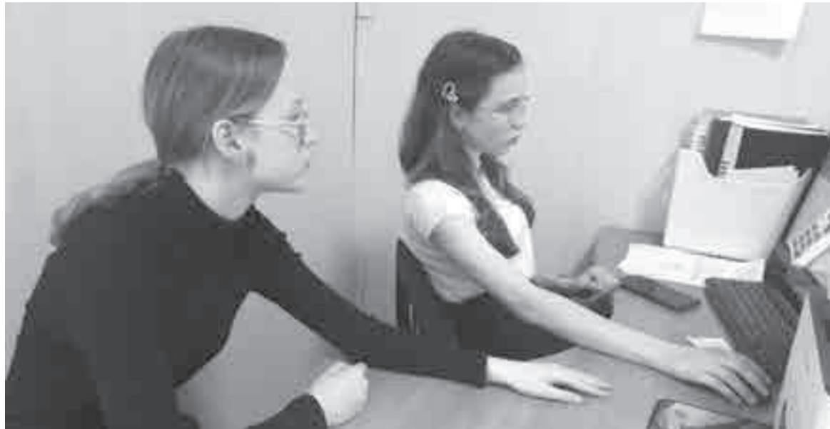
Здесь подростки за привычным для них компьютером могут зарабатывать.

Подросткам при трудоустройстве полагается краевая выплата