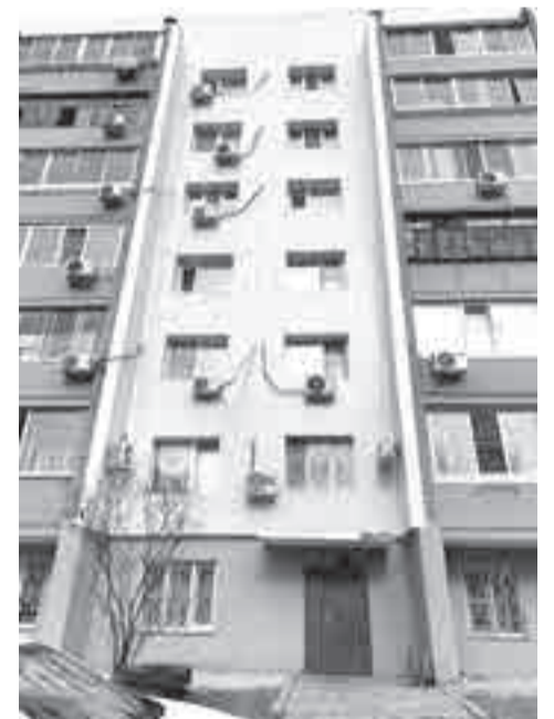
Один из отремонтированных фасадов.

– В 2021 году разработана проектно-сметная документация на фасад с утеплением и крышу на шестиэтажный дом 1990 года