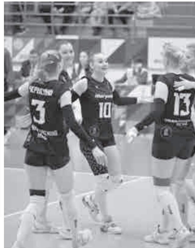
Победные эмоции хабаровчанок.

Ну а теперь в последнюю апрельскую неделю в Хабаровске пройдут решающие матчи финального этапа. Первую игру хабаровчанки провели 23 апреля с командой «Северянка-2» (закончилась после сдачи