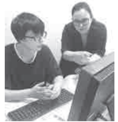
Работа творческая и у многих – первая в жизни, часто нужно советоваться.

Для старшеклассников – это отличная возможность иметь соб-