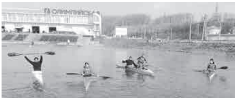
Хабаровские гребцы в приморских водах.

– Сборы прошли отлично. Пару дней было холодных, со снегом и ветром. Но для нас это привычно, да и соскучились, поэтому выходили на воду в любую погоду. Накатывали объемы по максимуму, утром около 15 километров и вечером – 10. Учитывая полугодовой перерыв без воды, десяти дней на вкатывание маловато. Тем более, сразу дальневосточный старт. За пару дней до него пришлось снижать нагрузку вдвое, чтобы ребята выдержали гонки, – рас-