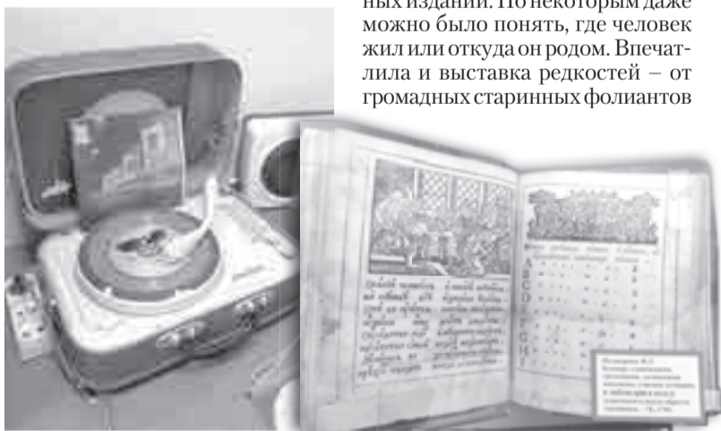
Такой вот забавный агрегат!