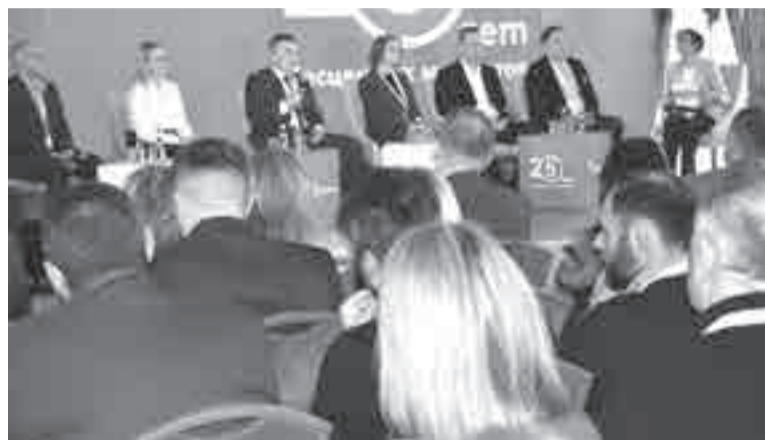
Участники конференции в Хабаровске.

Продбезопасность обсудили в краевой столице