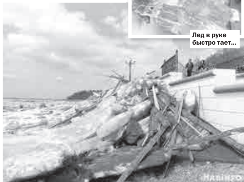
И вечный бой, покой нам только снится...

Цель нацпроекта «Экология» – к 2025 году кардинально улучшить экологическую обстановку и положительно повлиять на оздоровление россиян. Проект включает 10 федеральных проектов, работа ведется по пяти направлениям: отходы, вода, воздух, биоразнообразие, технологии. В частности, ведется работа по улучшению экологического состояния озер, водохранилищ и рек по всей стране. Благодаря федеральному проекту «Сохранение уникальных водных объектов» для почти 10 млн человек, проживающих возле водных объектов, улучшатся условия проживания.