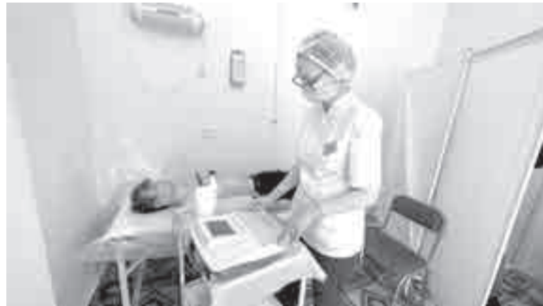
Медики уже проводили такие осмотры в 25 организациях города.

Около тысячи жителей Хабаровского края уже прошли диспансеризацию вне стен медицинских организаций – прямо на месте работы или учебы. С конца прошлого года в России начали действовать нововведения, которые значительно упрощают процесс проведения бесплатного обследования, организованного в рамках реализации нацпроекта «Здравоохранение», напоминают в правительстве края.