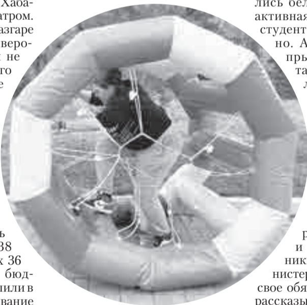
К какому виду спорта можно отнести бег в надувном колесе? Но было забавно.