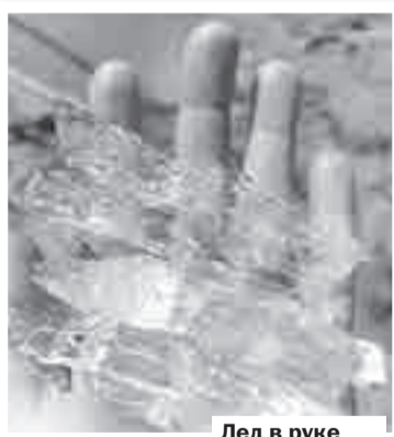
Лед в руке быстро тает...

Со стороны выглядит так, словно кто-то большой и сильный, вволю наигравшись со сверкающими на солнце льдинками, разбросал их у опорной стенки набережной.