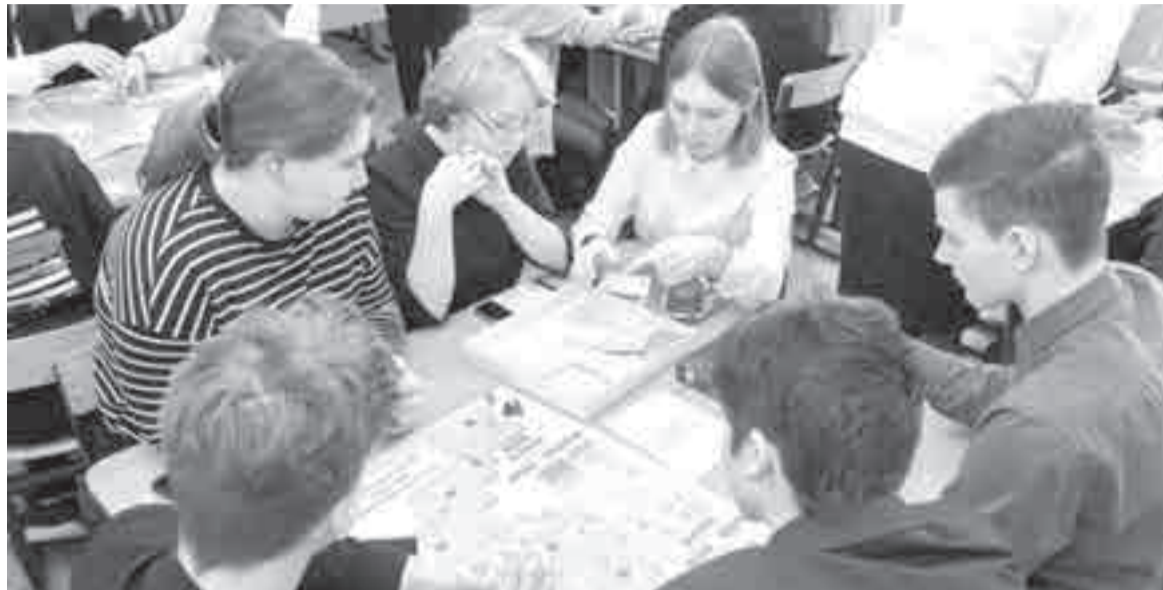
Игры бывают вполне невинные, например, «настолки», которыми ныне так увлекается молодежь. Все дело – в уровне азарта и в готовности поставить все на кон...

излишки финансов. Кто-то, наоборот, просел по доходам на фоне инфляции и ухода иностранных компаний. И пытается выйти на прежний уровень потребления, угадывая количество голов в матче «Зенит» – «Краснодар».