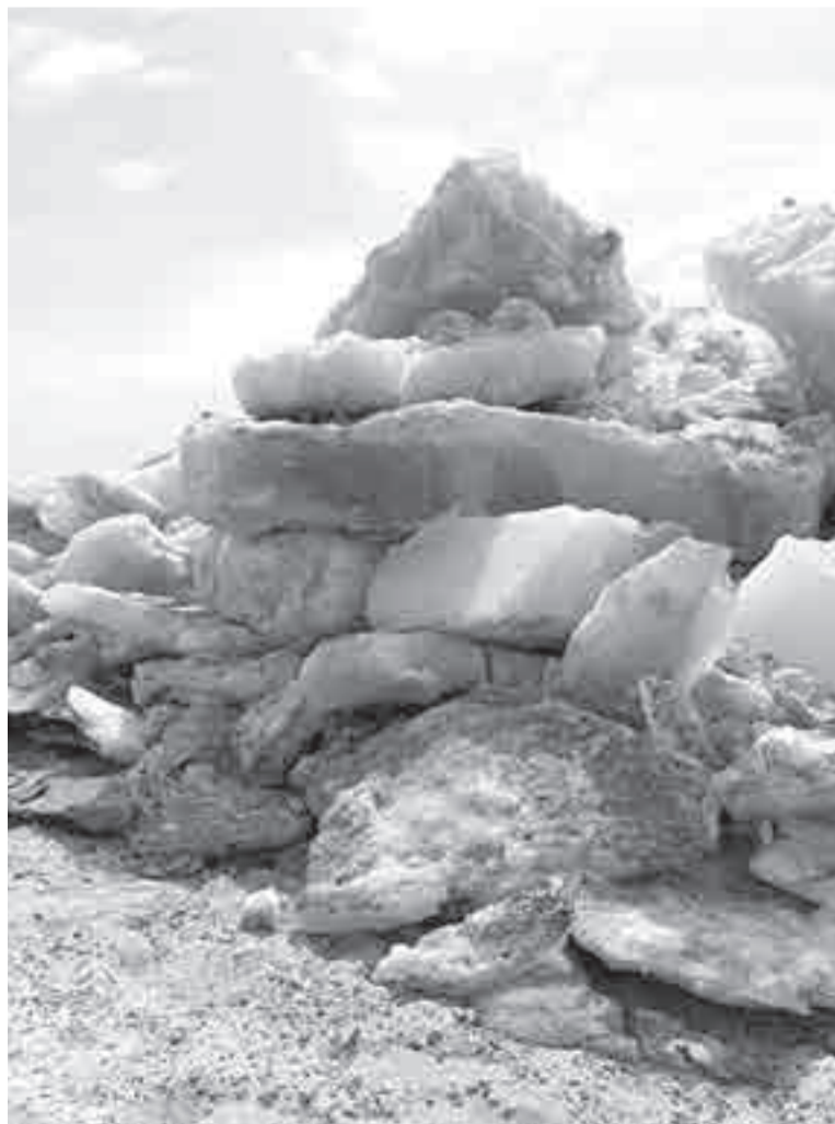
Слово «ледоход» для меня было термином из школьного учебника. И вот я увидела его живьем!

Цель нацпроекта «Экология» – к 2025 году кардинально улучшить экологическую обстановку и положительно повлиять на оздоровление россиян. Проект включает 10 федеральных проектов, работа ведется по пяти направлениям: отходы, вода, воздух, биоразнообразие, технологии. В частности, ведется работа по улучшению экологического состояния озер, водохранилищ и рек по всей стране. Благодаря федеральному проекту «Сохранение уникальных водных объектов» для почти 10 млн человек, проживающих возле водных объектов, улучшатся условия проживания.