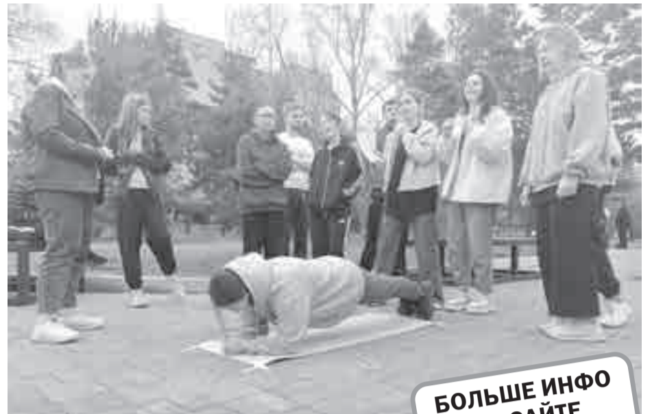
А как долго вы сможете пробыть в «планке»?

А пока студенты соревновались в ловкости и сноровке, общественники и представители министерства ЖКХ выполняли свое обязательное упражнение: рассказывали молодежи о том, как федеральный проект «Формирование комфортной городской среды» помогает приводить