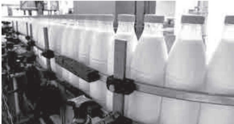
Хабаровский край обеспечивает себя молочными продуктами собственного производства на 8,4%