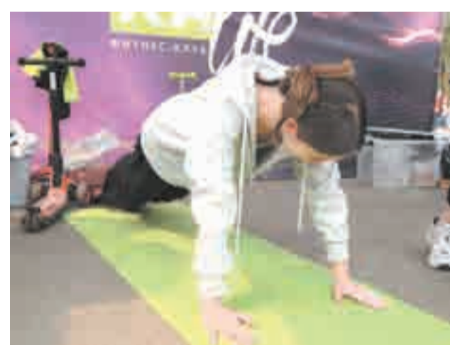
Каждый желающий мог сдать нормы ГТО.