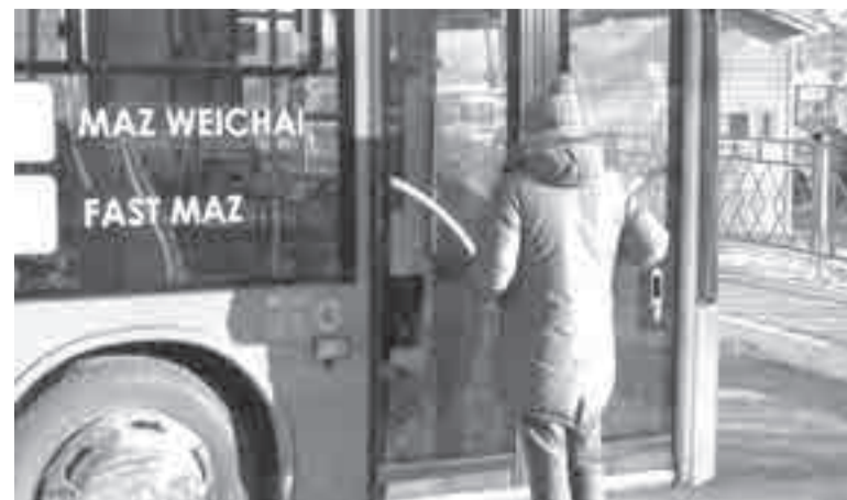
Наличие туалетов для водителей автобуса рассмотрели в Общественной палате Хабаровска