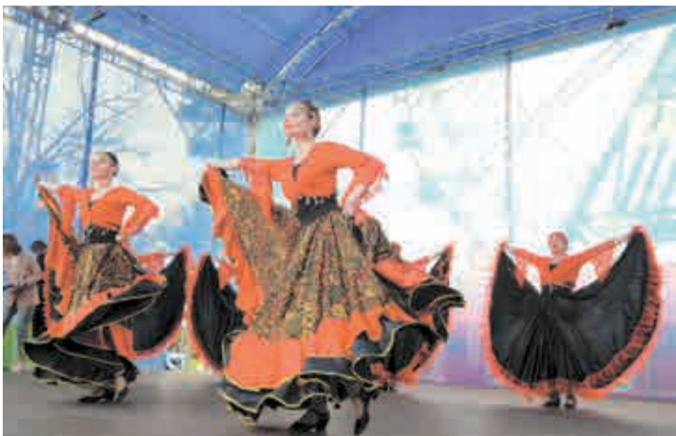
Творческие коллективы радовали гостей своими выступлениями.