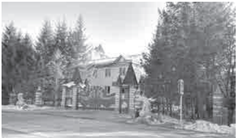
Хвойный воздух не менее полезен, чем горячие ванны.