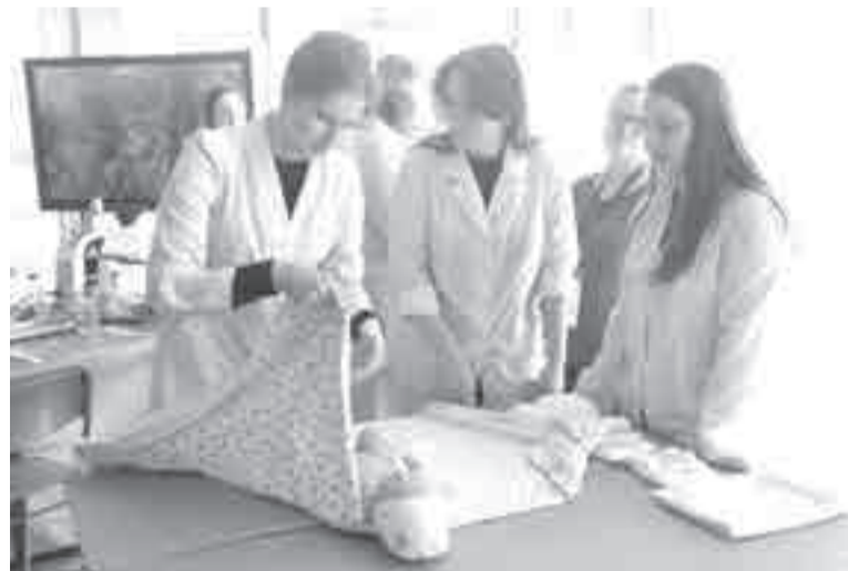
Количество бюджетных мест по направлениям «Инженерное дело технологии и технические науки» и «Здравоохранение и медицинские науки» в этом году будет увеличено

При поступлении каждый студент часто сравнивает между собой вузы. Это одна из основных ошибок: в одном университете могут быть одновременно как хорошие факультеты, так и не очень.