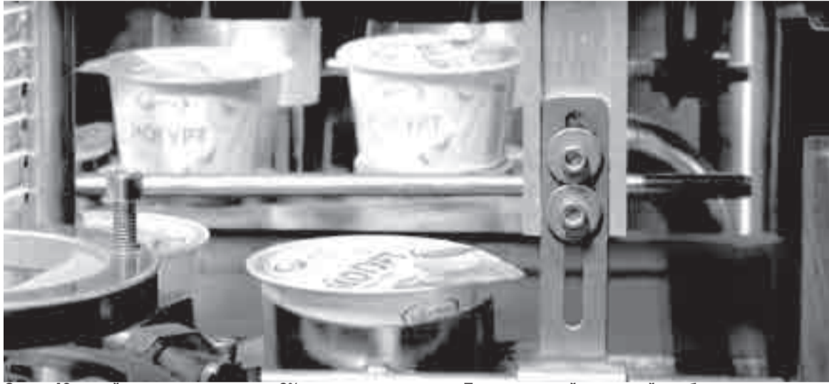
Около 40 тонн йогуртов с жирностью 6% планирует выпускать Переяславский молочный комбинат

конца года планируем выпустить около 40 тонн йогуртов с жирностью 6%.