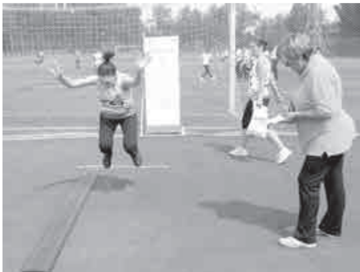
Флагманом физкультурного движения в городе стал Всероссийский физкультурно-спортивный комплекс «Готов к труду и обороне»