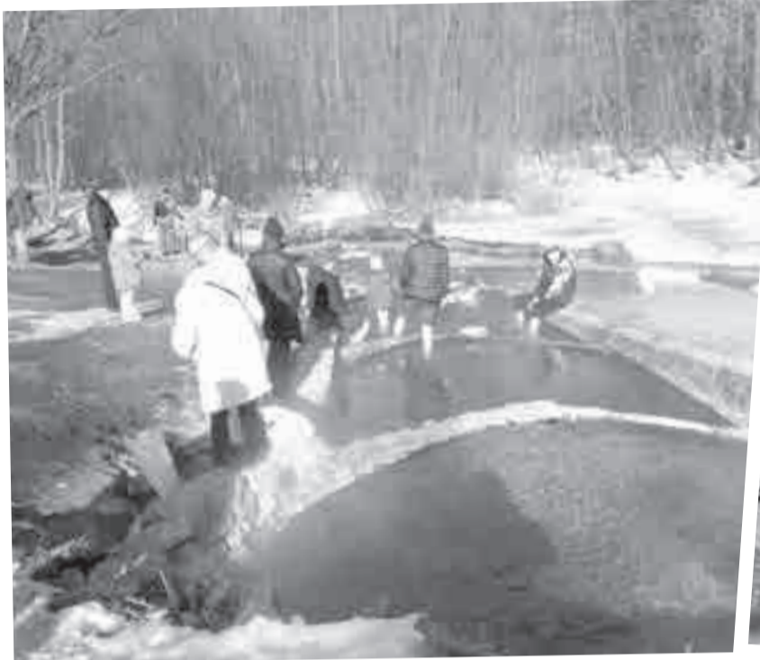
Любители «бесплатных процедур» купаются в сбросах минеральной воды не взирая на запрет.

у меня справки о том, что перед поездкой в санаторий не контактировала с инфекционными больными. И надо было эту справку во что бы то ни стало запросить в поликлинике по месту жительства. Так что если соберетесь на лечение, примите к сведению, таково требование Роспотребнадзора. К слову, я эту справку так и не запросила, но мне сошло с рук.