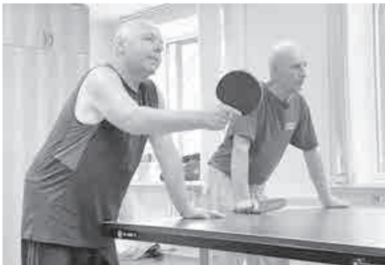
Какие должны быть данные у человека, чтобы играть в пинг-понг? Хорошая реакция, быстрое мышление и работа ног, устойчивая психика и умение скрывать эмоции, говорят местные знатоки.

В рамках национальной цели «Сохранение населения, здоровье и благополучие людей» ставится задачей достижение к 2030 году обеспечения устойчивого роста численности населения РФ, повышение ожидаемой продолжительности жизни до 78 лет, снижение уровня бедности в два раза по сравнению с показателем 2017 года, увеличение доли граждан, систематически занимающихся физической культурой и спортом, до 70 процентов.