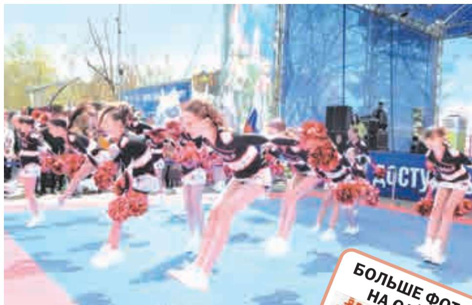
Выступление спортсменов черлидинга.