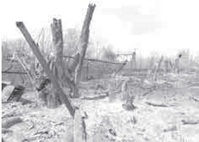
С огнём на островах бьются сотрудники МЧС и дачники.

В четырёх районах края уже действуют режимы ЧС в лесах муниципального характера. Теперь он введён и на региональном уровне. Губернатор поручил ограничить доступ населения на территорию лесного