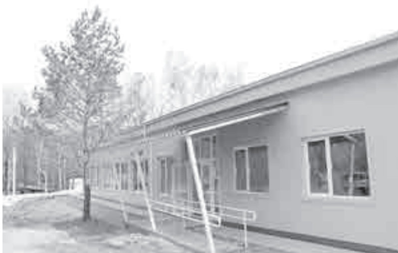
Открытие «Олимпа» запланировано на 15 июля.

На территории лагеря полным ходом идут строительные