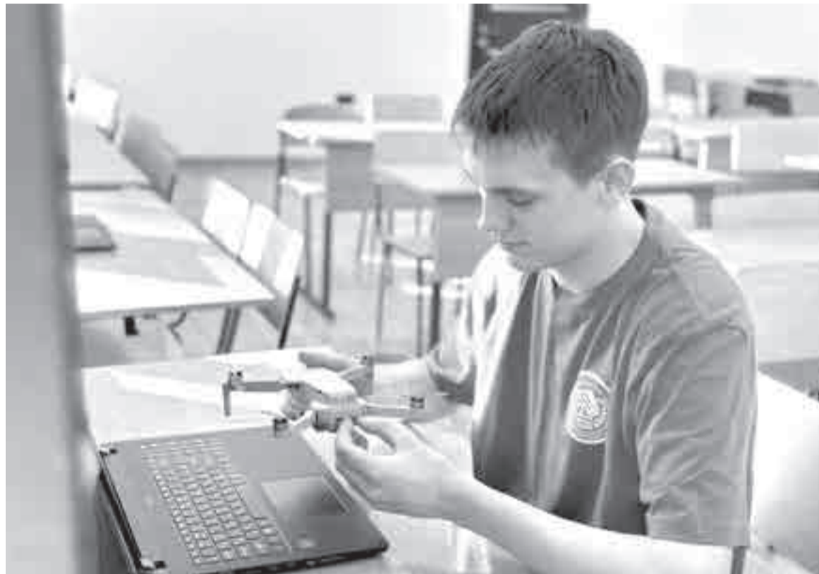
Эксплуатация беспилотных авиационных систем – новая специальность для нынешних абитуриентов Хабаровского края

29 техникумов и колледжей и 9 отделений среднего профессионального образования в вузах Хабаровского края примут абитуриентов в 2024-2025 учебном году.