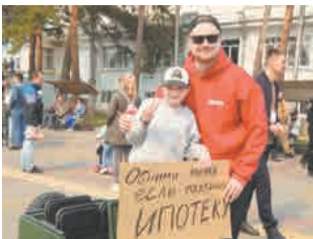
Желающих обняться оказалось немало.

В Хабаровске открыли летний спортивный сезон