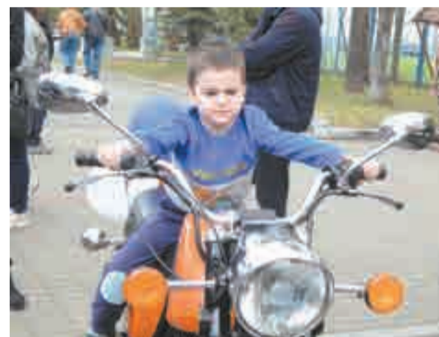
У крутых байкеров возраста не бывает.