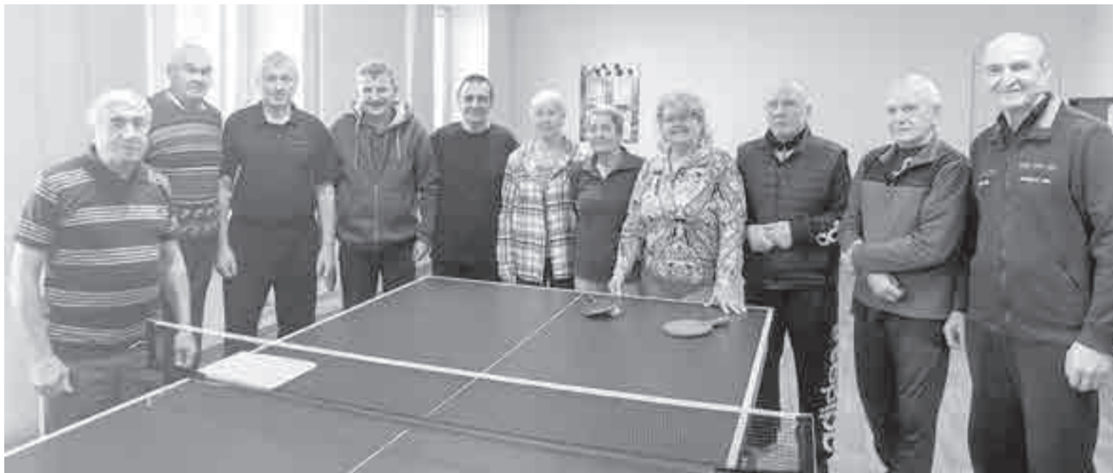
Любители настольного тенниса – это настоящее содружество!

Причем здесь никогда не играют на деньги. Иначе теряются раскованность и творчество, игрок не получает удовольствие