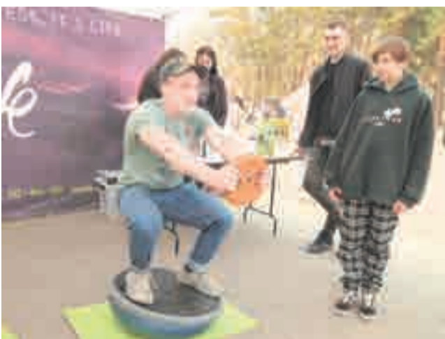
Устоять на полусфере не так-то просто.