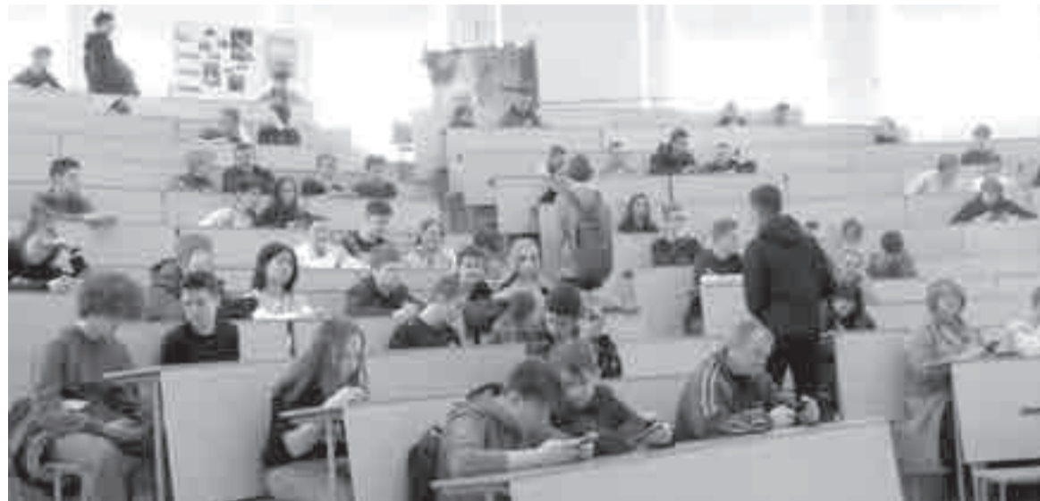
В России планируют ежегодно повышать выплаты обучающимся. На эти цели планируется выделить более 2,3 миллиарда рублей.

В рамках нацпроекта «Наука и университеты» реализуется четыре федеральных проекта: «Развитие интеграционных процессов в сфере науки, высшего образования и индустрии», «Развитие масштабных научных и научно-технологических проектов по приоритетным исследовательским направлениям», «Развитие инфраструктуры для научных исследований и подготовки кадров» и «Развитие человеческого капитала в интересах регионов, отраслей и сектора исследований и разработок».