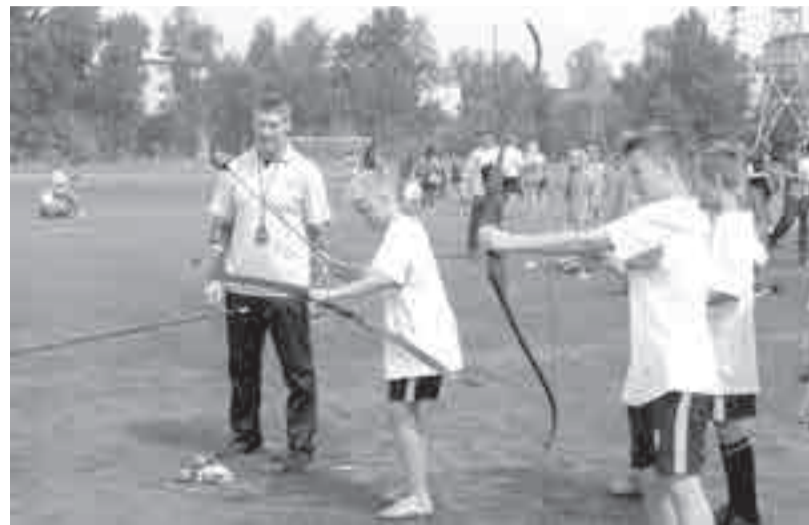
На сегодняшний день согласно официальной статистике систематически занимается физкультурой и спортом каждый второй хабаровчанин в возрасте от трех до 75 лет.