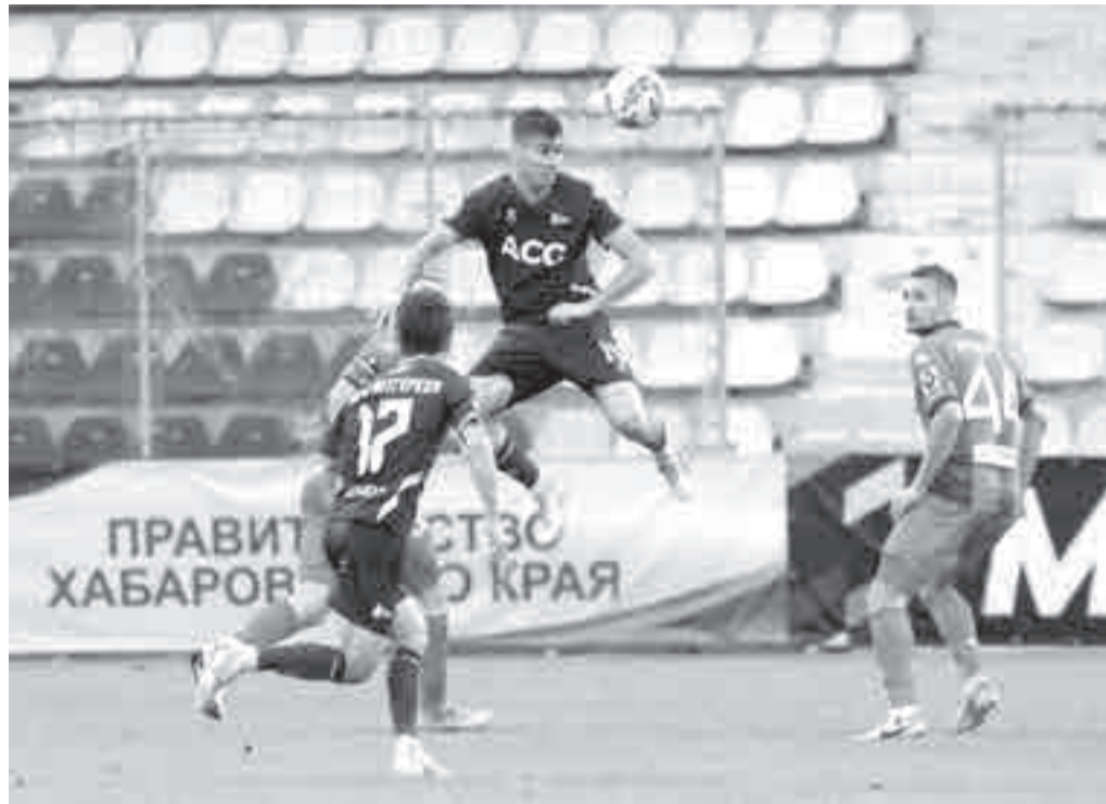
Игра с «Чайкой» проходила при пустых трибунах. Опасались воздушной угрозы...

Гонгадзе, причем последний – уже в добавленное время.