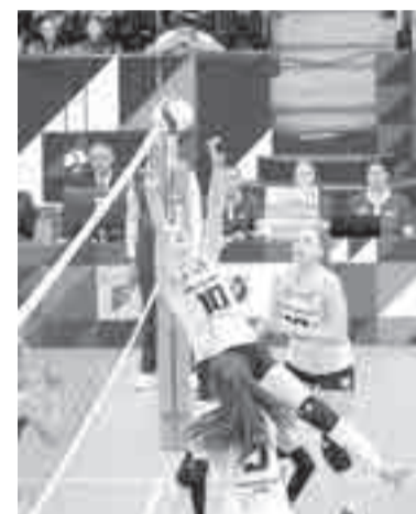
Порой было сложно устоять на ногах.

Заключительная, четвертая игра хабаровчанок – снова с «Уфимочкой-УГНТУ». И снова слаонервные болельщики хватились за сердце. Первую партию хозяйки начали резво, затем расслабились, и уфимчанки их за это наказали. А найти свою игру после этого было сложно, проле-