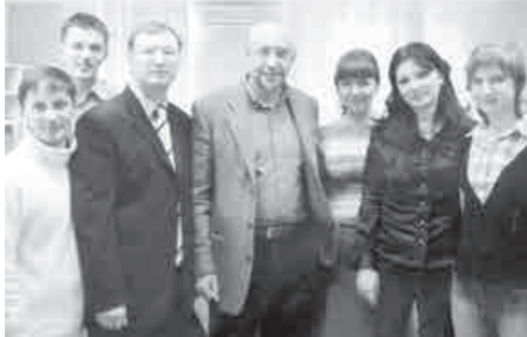
Николай Сванидзе во время встречи с хабаровскими тележурналистами, 2007 г.

исторического факультета МГУ. «Мама чуть не погибла на похоронах Сталина. У нее отец, мой дед, сидел в это время в лагере. А отец мужа, второй мой дед, был убит на допросе в НКВД. Но она побежала за гробом, это был общий психоз. Спас конный милиционер, который вытащил ее буквально за шиворот из толпы». Сам он к Сталину относился всегда предельно ясно, говорил, что у него руки по плечи в крови собственного народа.