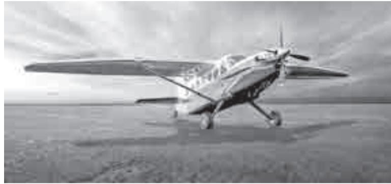
В прессе всюду обсуждают «магическое поручение» президента. После чего цена будущего «Байкала» сократилась вдвое, а требуемая длина ВПП – втрое! Но станет ли такой чудесный самолет реальностью?

«Байкал» стал дешевле по поручению президента