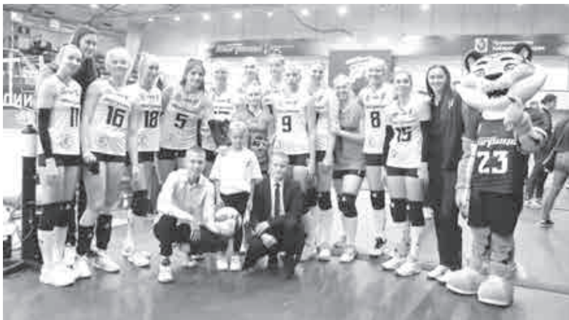
Болельщики увидели команду «живьем», и увидели, как она побеждает.

Увы, заключительный матч тура – с командой «Заречье-Одинцово» из Московской области – наши волейболистки провалили – 0:3 (10:25, 10:25, 21:25). «Тигрицы» остались на третьем месте.