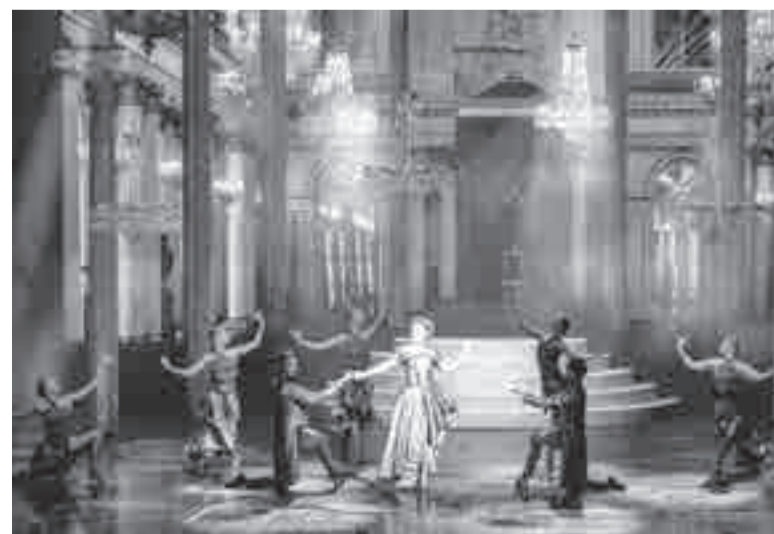
От своего «большого стиля» здесь отказываться не собираются!

Ну, а затем артисты Хабаровского музыкального театра вновь порадуют нас и уже знакомыми спектаклями, и премьерами.