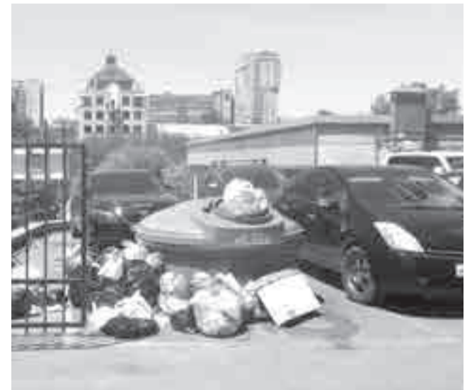
Авто у многих хабаровчан уже неплохие, а вот живем мы по-прежнему...

Как пояснил «ПГ» член общественного совета Росприроднадзора Дмитрий Федоров, в северных, горных и труднодоступных территориях регоператоры изначально находятся в зоне экономического риска. Там сложная логистика и размер тарифа практически не покрывает эксплуатационные затраты. По его мнению, для регионов ДФО, Арктики, Сибири, а также на Кавказе, в Саянах и на