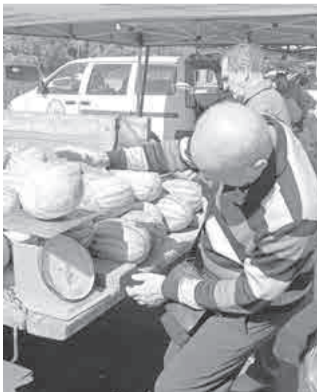
А взвесьте мне арбуз, пожалуйста!

Пока покупатели горячо обсуждали цены на местное и спорили о том, какой картофель хранится лучше,