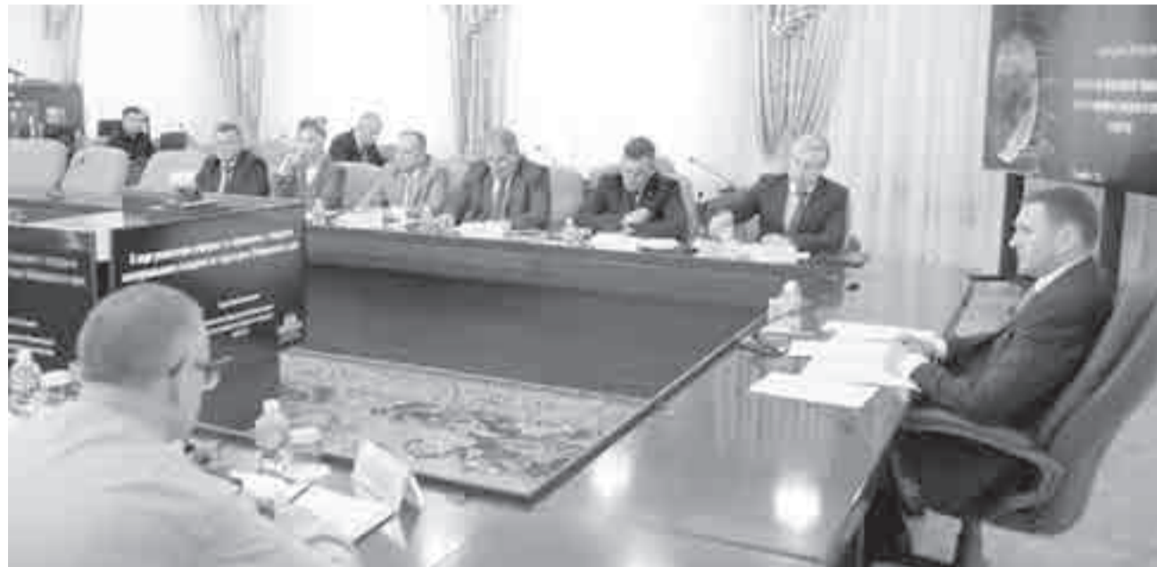
На совещании обсудили «мусорную реформу».

Ход «мусорной» реформы обсудили в правительстве края