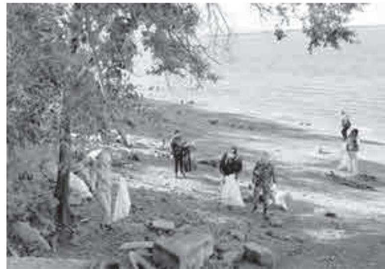
Кто-то намусорил, а мы убираем.