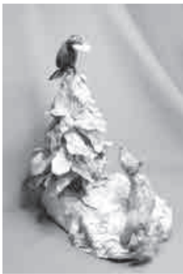
Еще один известный, басенный сюжет.

говая – это фамилия его мамы. К сожалению, о папиной ветви (Гричевского) воспоминаний практически не осталось.