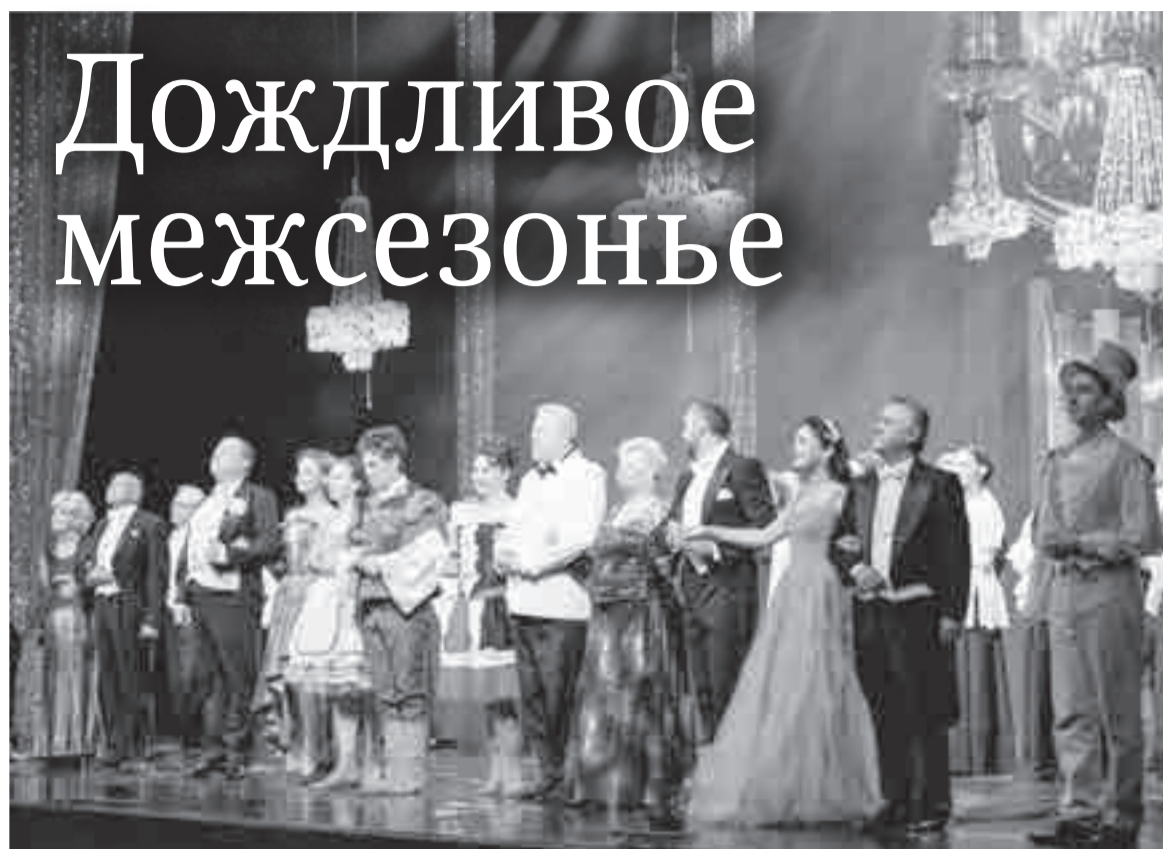
Редко когда зритель может увидеть всю труппу театра на сцене.

Как сообщили в Минкультуры региона, на ремонт ХМТ из краевого бюджета выделено 36,4 миллионов рублей. Работы планируется завершить уже в конце года.