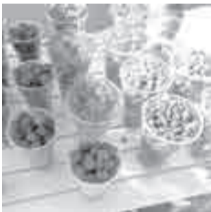
Ягода на любой вкус.

– «сарафанное радио» и заказы по телефону.