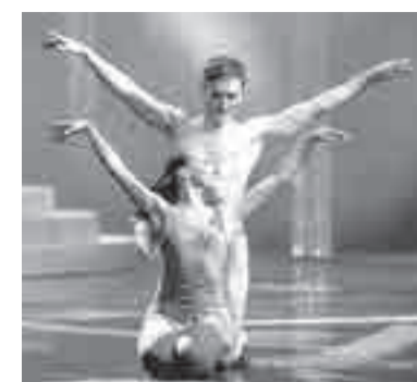
Балет ХМТ в прекрасной форме.

Теперь хабаровскому коллективу предстоит большой выезд в Челябинск на фестиваль мировых премьер российского музыкального театра (16+), где покажут спектакли, которые вот только-только выпустили. ХМТ представит премьеру прошлого сезона спектакль «Первый бал Наташи Ростовской» (12+). Обещают, что это будет масштабный выезд, ведь на гастроли от-