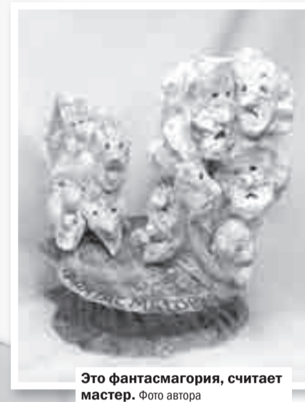
Это фантазмагория, считает мастер.