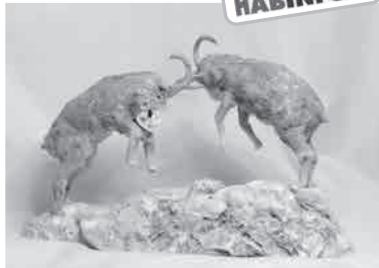
«Как рогами ни крути, а вдвоем нельзя пройти...»