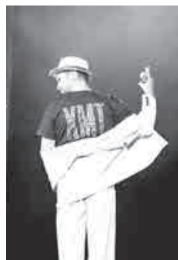
Бренд – напоказ.