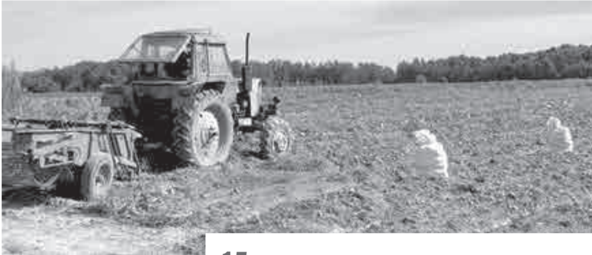
А здесь техника трудится в поле вполне успешно...

Картофельные успехи и боли хабаровских фермеров