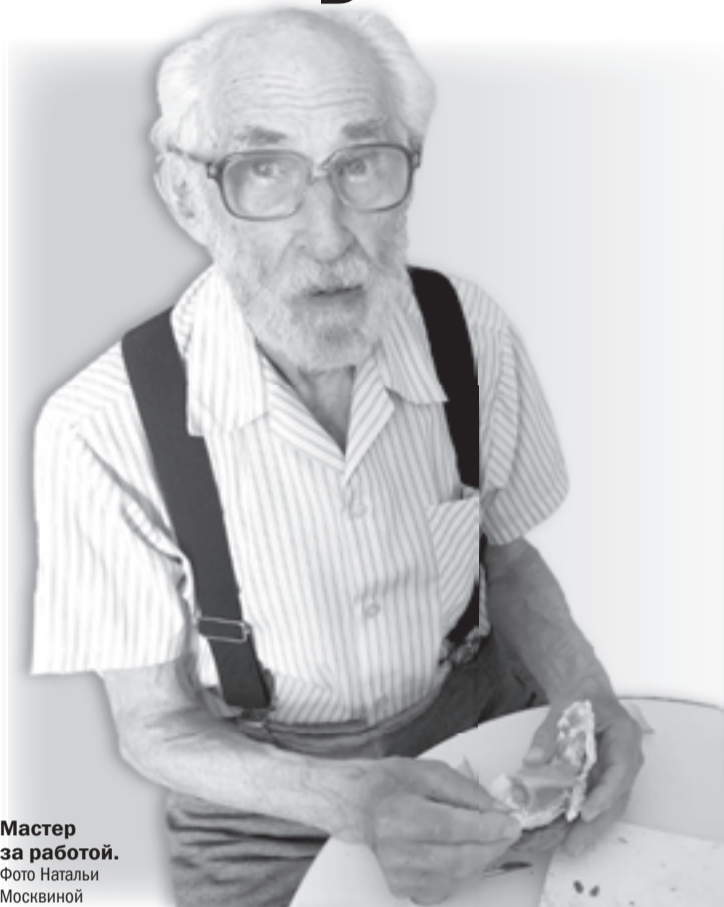
Мастер за работой.