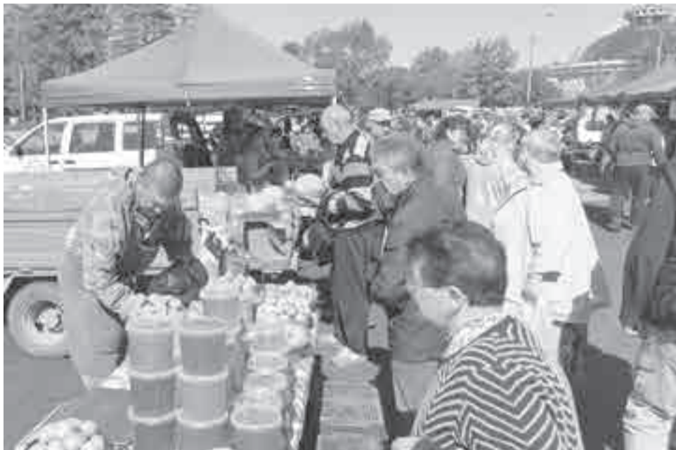
Первый день после переезда.

Рады переезду и аграрии из села Бычиха, с которыми мы поговорили. Они – всегда гатаи торговой площадки, уже несколько лет подряд торгуют собственным выращенным картофелем. Говорят, основной сбыт