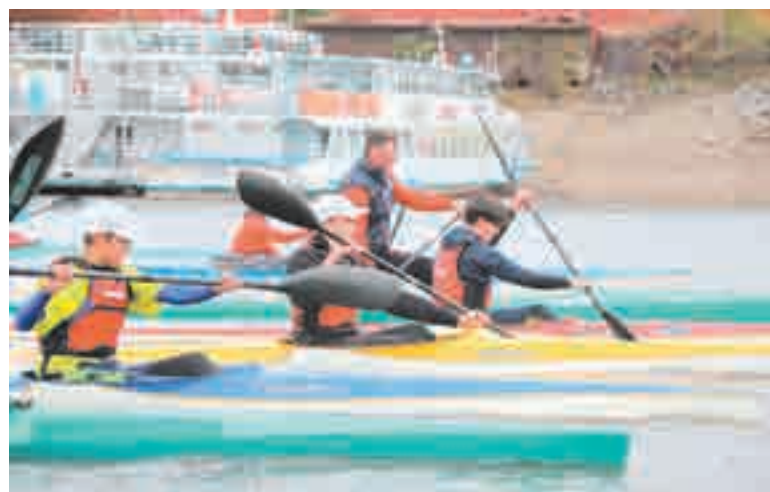
Кто быстрее?