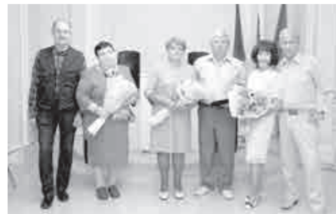
Сразу три пары торжественно отметили 50-летие совместной жизни.

Как уточнили в комитете по делам ЗАГС и архивов правительства края, всего в Ванинском районе уже вручено 284 таких памятных знака.