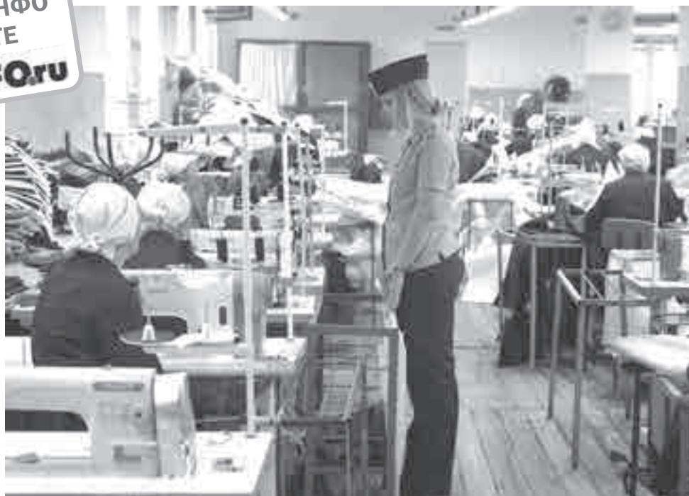
На вид – просто цех обычной фабрики. Но серая униформа и десятки глаз с колючим взглядом не дают забыть, где мы находимся...