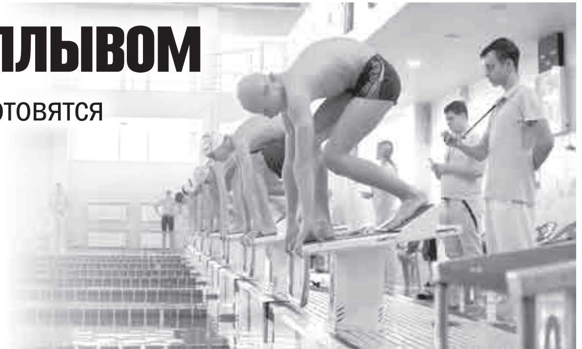
На старт, внимание!

Что ж, а уже в начале октября также в том же бассейне состоялись межрегиональные соревнования по плаванию – второй этап Кубка Дальнего Востока (0+). В турнире высту-