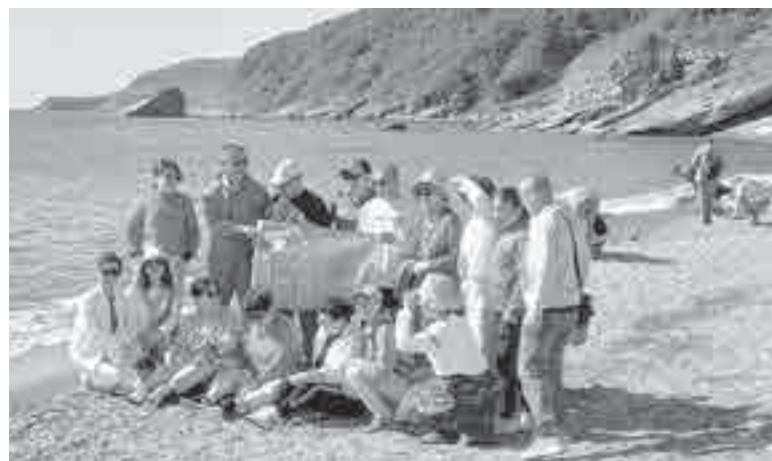
Туристы поют, танцуют, с флагом снимаются, почему же это напрягает?

Приморье – самый популярный регион Дальнего Востока у российских путешественников. 29% всех поездок в ДФО летом совершено в Приморский край – это данные совместного исследования Минэкономразвития и сервиса путешествий МТС Travel. Для анализа брали поездки россиян в ДФО от пяти до 14 дней.