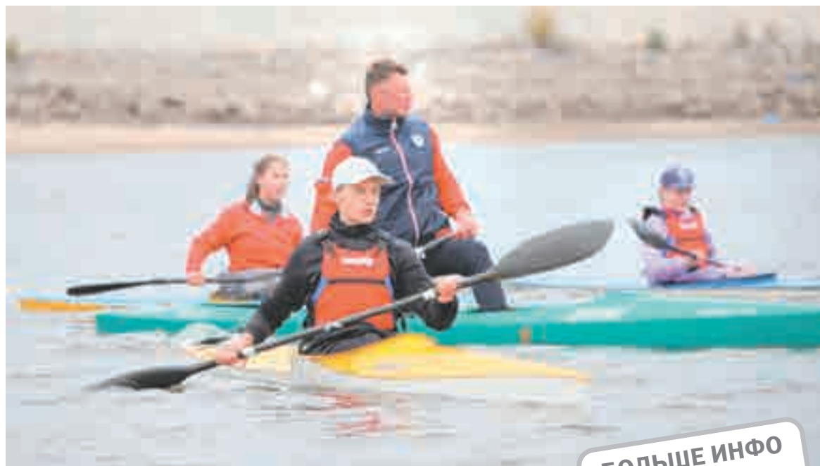
Учиться лучше вместе с чемпионом!