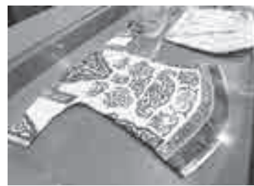
А это экспонат из музейной коллекции.

скую посуду, спортивный инвентарь. Пожалуй, именно деревянный сап с этно-орнаментом привлекает здесь больше всего внимания, и не только у любителей экстрима. Еще, конечно, каждый посетитель старается запечатлеть на