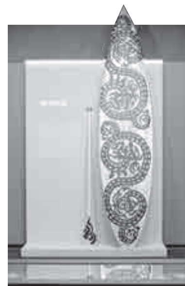
Такой сапборд привлекает внимание не только экстремалов.

свой мобильный яркие кроссовки с орнаментальной вышивкой. Да, таким и знаменитый «Адидас» позавидует!