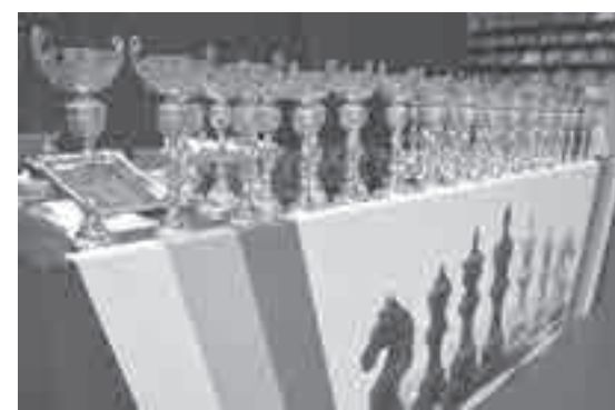
Награды для лучших.