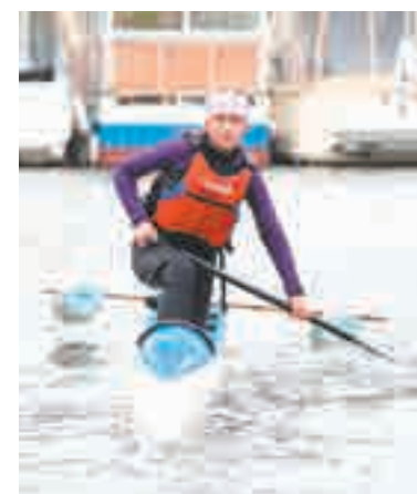
Девочки тоже идут в каноистки.

в этом году сбор в поселок Лозовый Приморского края.