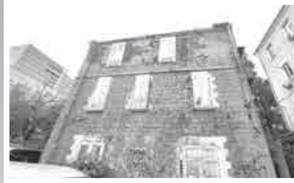
Дом без окон, без дверей, но со своей нарисованной жизнью.