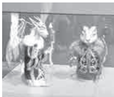
«Духи амурской тайги». Серия авторских кукол Юлии Власенко.

– Проект достаточно масштабный, было много мыслей, импровизации и планов. Все, что представлено в музее, создавалось несколько месяцев всеми желающими. Люди приходили к нам в лабораторию, чтобы вдохновиться культурой коренных народов и затем создать что-то