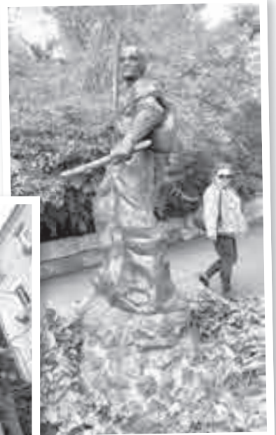
Завернешь за угол, а там – ниндзя!