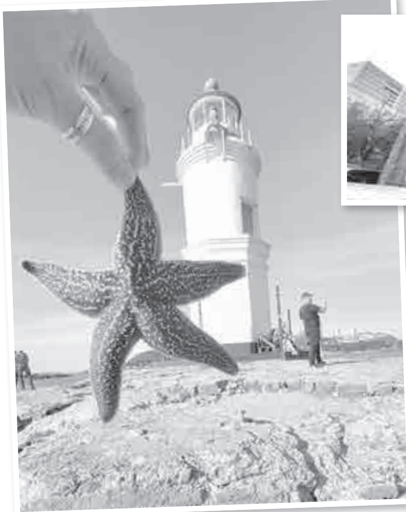
Даже в холодное время главный плюс – это море...

Интересно, что путешествуют гости со своими флагами. Растягивают их и фотографируют.