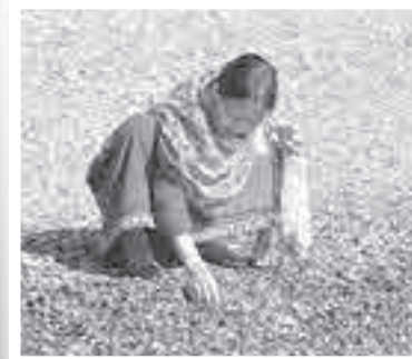
Зачем туристам наши «стекляшки»?