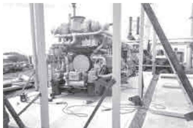
Новый агрегат мощностью два мегаватта.