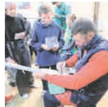
Автограф на весле.