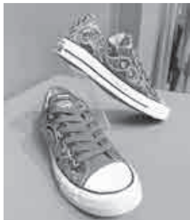
Эти кроссовки надо видеть!

ции, авторы получали замечания и предложения по доработке. И в конце с помощью голосования отобраны идеи, которые можно теперь увидеть на выставке.