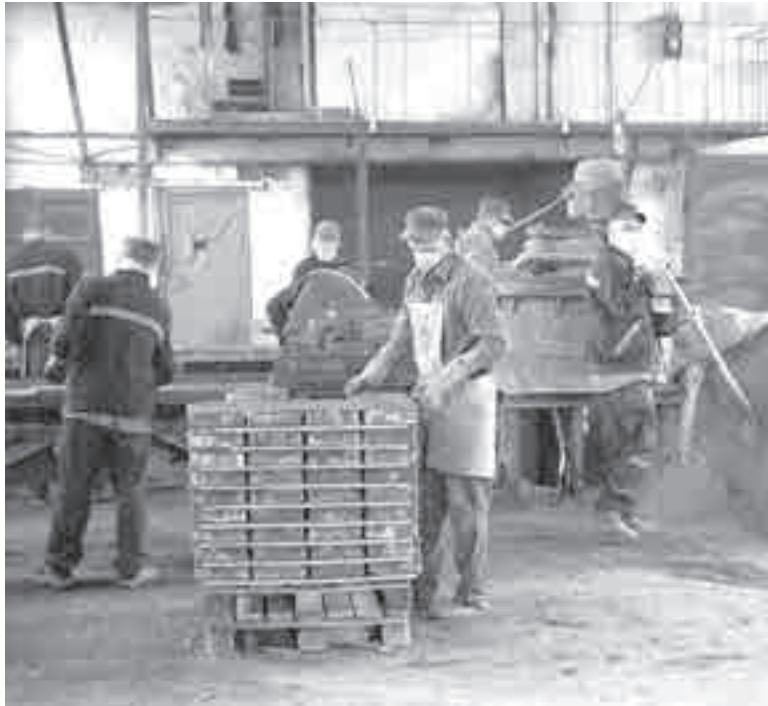
Что ждет заключенных после выхода на свободу?

окружающих. С каждым годом мое здоровье становится только хуже».