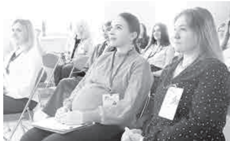
Мамы разные нужны, мамы разные важны!