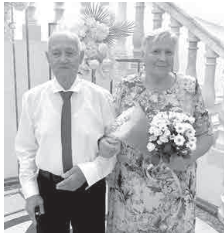
Молодожены в биробиджанском Дворце бракосочетания.