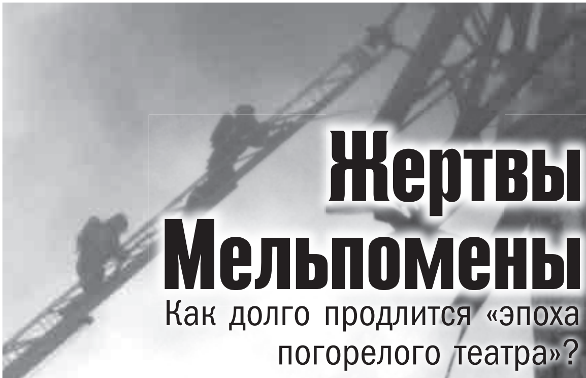
Пожарные за работой.

Впрочем, как водится, большой пожар собрал большую толпу. Ведь в «музкомедию» многие хабаровчане любили, бывали