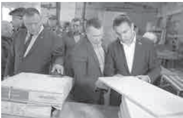
Когда еще увидишь действующих депутатов и чиновников в колонии?