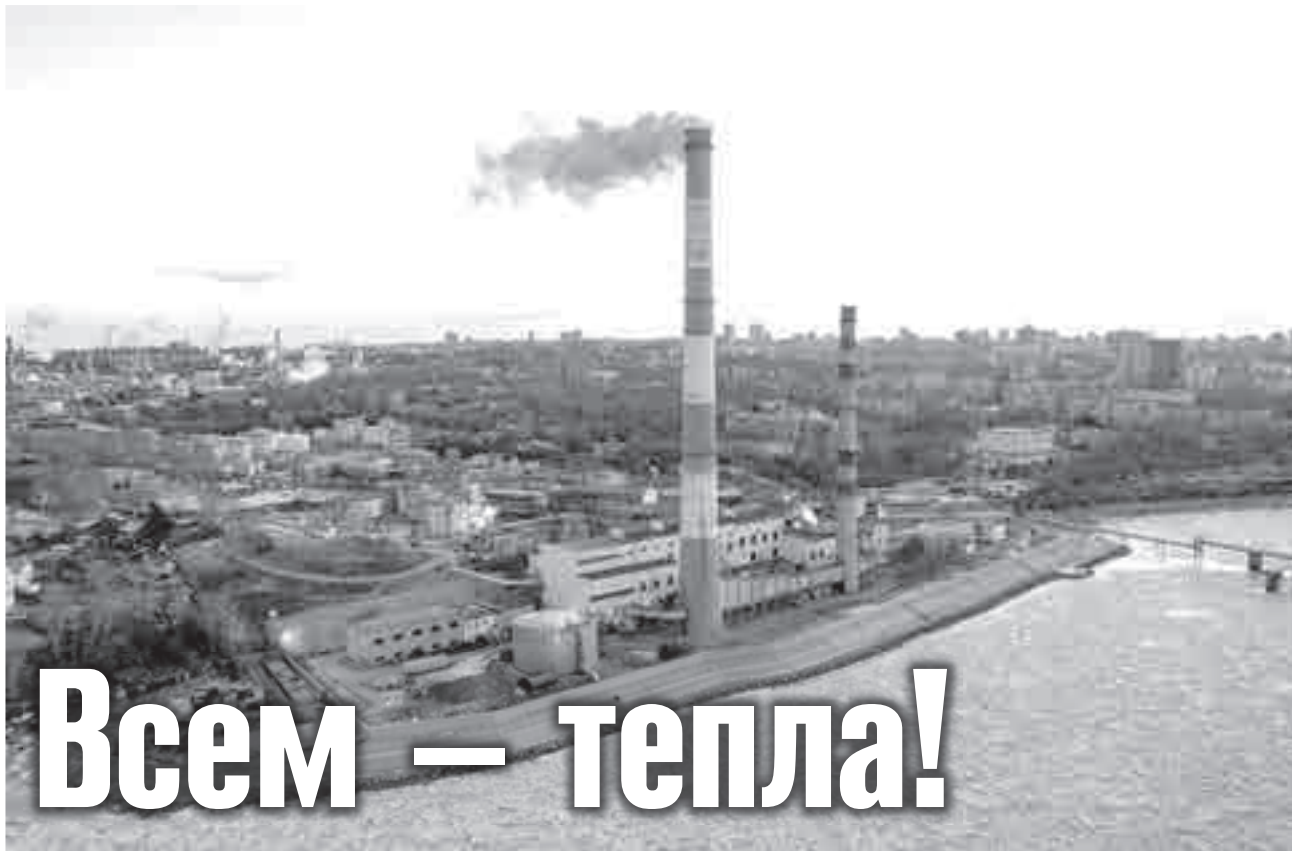
Хабаровская ТЭЦ-2 введена в эксплуатацию еще в 1935 году...

Сегодня уголь к нам поступает не только наш, ургальский, но еще с Кузбасса и с Красноярска. Почему нельзя обойтись только местным? Вед, на первый взгляд, завозить уголь с нашего месторождения под Чегдомыном – самый оптимальный вариант. Но надо понимать, что каждая станция в крае