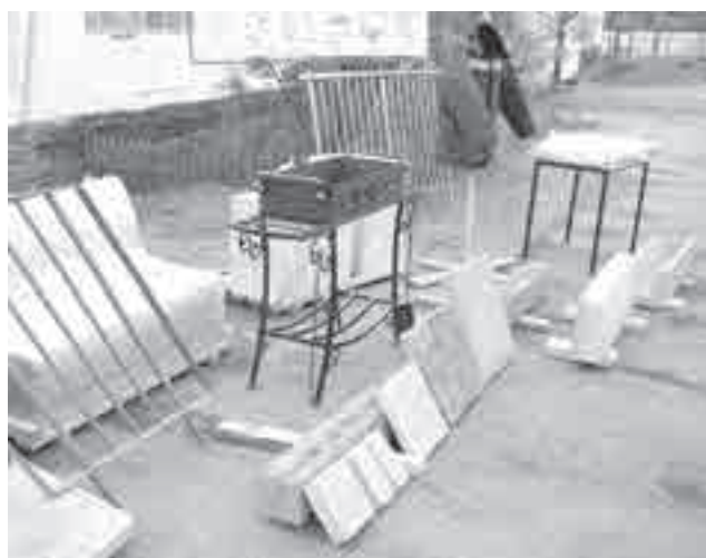
Образцы труда хабаровских заключенных.