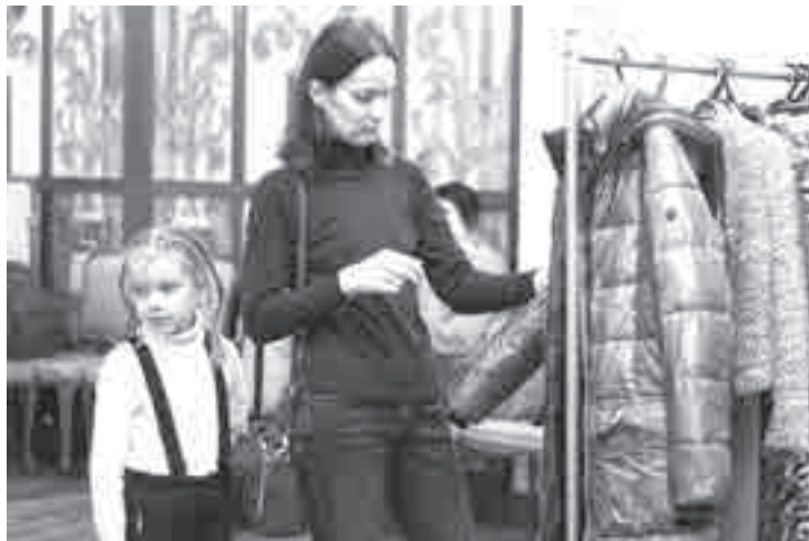
Новое купить или старое зашить?

«Многие потребители одежды и обуви консервативны при выборе марок одежды и стараются покупать то, что они покупали 3-5-10 лет. Они доверяют производителям, — считает Янин. — Люди понимают, что в среднем цены растут на 15-20% в год. При этом они все равно готовы платить за те же товары на 15-20% больше, чем год назад.