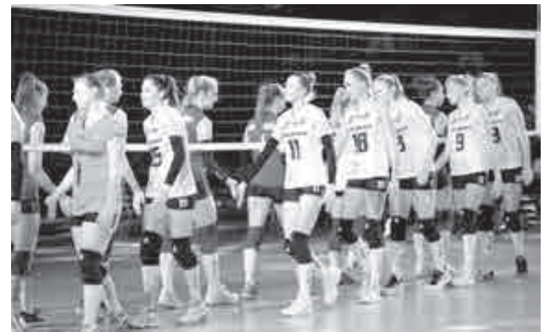
Со многими, более опытными соперницами хабаровчанки пока еще знакомятся.