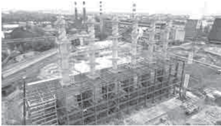
В сентябре ХТЭЦ-1 отметила 70-летие, сейчас на территории станции строится ХТЭЦ-4. Пуск запланирован на 2027 год.

По итогам прошлого года наибольшая доля потребления электроэнергии в ДФО приходилась на промышленность (37%) и транспорт (19%), а население потребляло 18%. Пропорция менялась в ряде регионов: в Забайкалье и Амурской области больше потреблял транспорт, в Приморье – население. К 2027 году ожидается прирост потребления в ДФО на уровне 34-39%. К 2029-му суммарный энергодефицит в южной части ДФО оценивается в 2-3 ГВт.