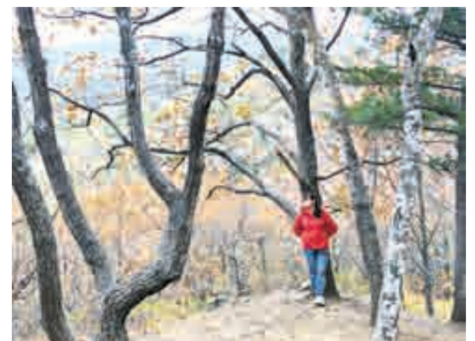
Редкая возможность остановиться и просто подумать.