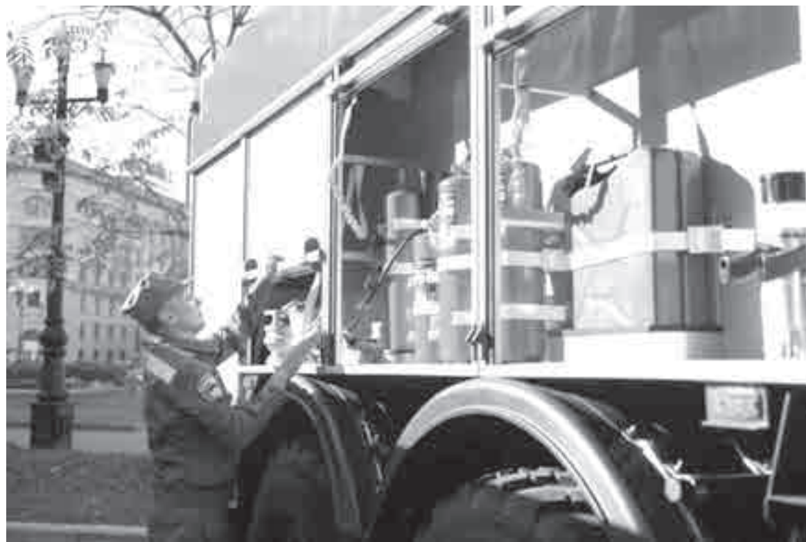
Специалисты осматривают технику, на которой им предстоит работать.

Технику для тушения пожаров получают районы края