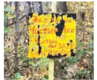
Знак былых времен.

Оставив авто на обочине, двинулись в путь. Лес сразу же окутал нас осенними запахами и шелестом листьев. И было необычайно тихо, не слышно даже пения птиц. Зато отлично слышно, как листья, срываясь с веток