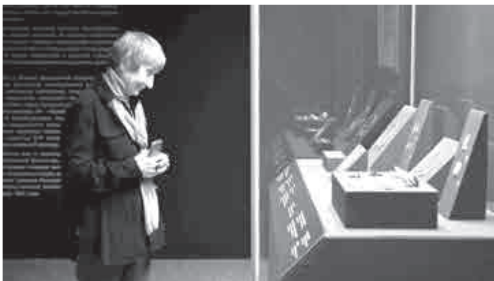
Умиляясь красоте в полумраке...

И вот я стою перед витриной и воочию вижу исторические ценности. Очень волнующие представлять, к примеру, как Михаил Федорович Романов принимает в подарок от своей матери золотой