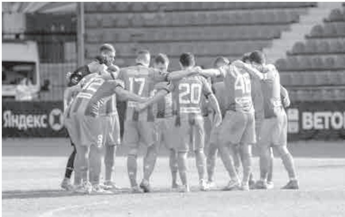
Теперь команду будут поддерживать еще и болельщики.

20 октября футболисты наконец-то сыграют на своем поле