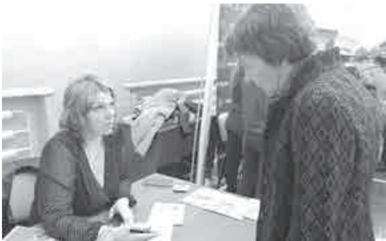
Первичное собеседование.

Всего с начала года к началу октября почти 4,3 тысячи человек трудоустроены службой занятости в регионе.