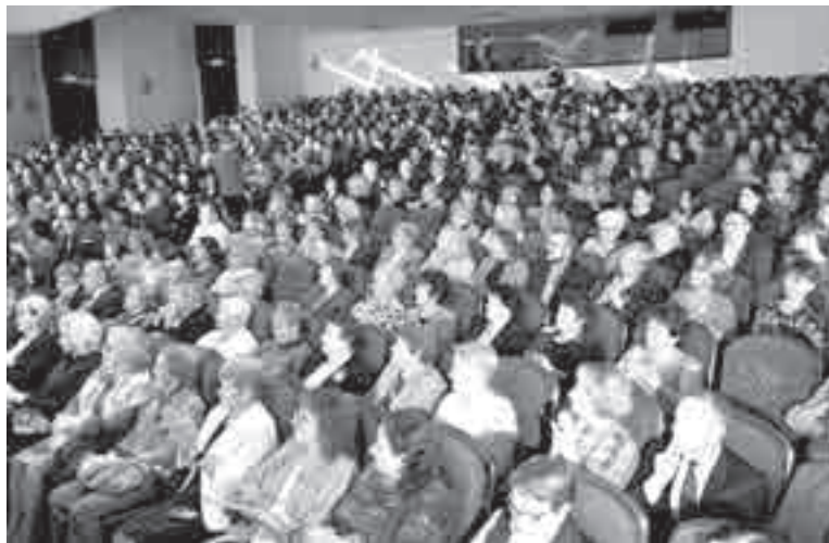
Последний «День учителя» в Хабаровске отмечали в музтеатре, за день до пожара. На заседании сообщали, что в сфере образования края занято около 22 тысяч педагогов: из них школьных учителей – 8,3 тысяч, воспитателей – семь тысяч.

Самые низкие оклады по стране, менее пяти тысяч, платят