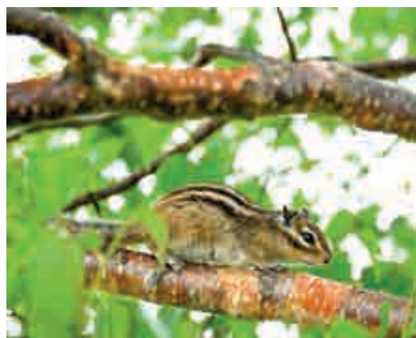
Здесь можно встретить бурундука. И не только!