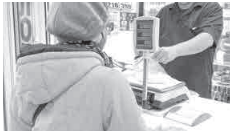
Пока россияне изучают ценники, ответственные лица ищут крайних?

о транспортировке, структуре себестоимости продукции, об условиях и сроках хранения. Ранее ФАС получила от торгсетей информацию о ежемесячной динамике средневзвешенных закупочных и розничных цен на отдельные виды рыбы.