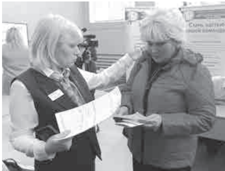
На одной из ярмарок вакансий.

Воспользоваться такой возможностью могут граждане, имеющие инвалидность, женщины в отпуске по уходу за ребенком до трех лет, неработающие мамы детей-дошкольников, отдельные категории молодых людей до 35 лет, граждане от 50 лет и предпенсионного возраста, ветераны СВО и члены их семей, а также безработные граждане и работники, находящиеся под риском увольнения. Чтобы стать участником программы, необходимо быть зарегистрированным в службе занятости.