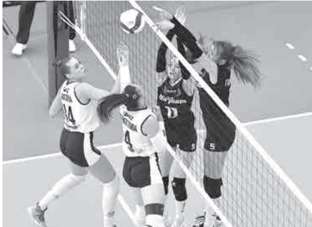
В каждой встрече надо выкладываться по-полной.

Ждем следующий тур, третий из 14, который стартует 23 октября в Липецке. Там хабаровчанки сыграют с «Атом-Курском» и местным «Липецком».