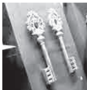
Золотые ключики. Буратино, ах!

другие изделия из Турции и Китая, например, изящный сосуд в форме персика или богато инкрустированный изумрудами и рубинами «ароматник».