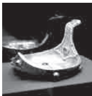
Ох, тяжела ты, царская чаша!

В отдельную категорию стоит выделить часть экспонатов, которые представляют собой дары, преподнесенные российским правителям их заморскими «коллегами». В частности, интересны искусно выполненные золотые сосуды и