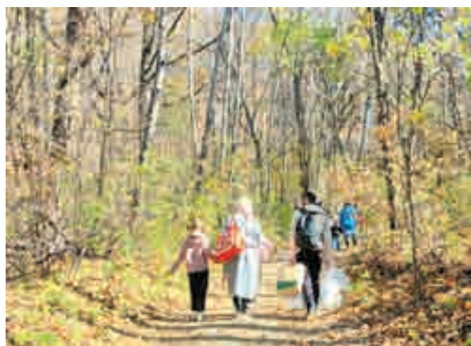
В выходные дни здесь многолюдно.