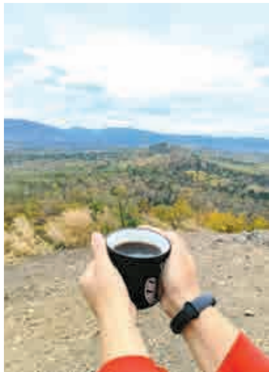
Горячий чай и свежий воздух...

иной сопке с более поэтическими целями. Хотели с высоты птичьего полета ощутить красоту хабаровской осени.