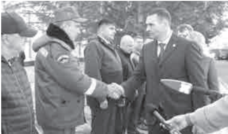
Губернатор общается с руководителями профильных подразделений.