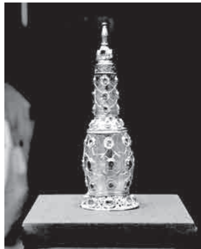
А еще это красиво...

другие изделия из Турции и Китая, например, изящный сосуд в форме персика или богато инкрустированный изумрудами и рубинами «ароматник».