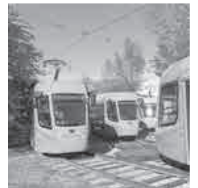
Новый транспорт радует глаз.