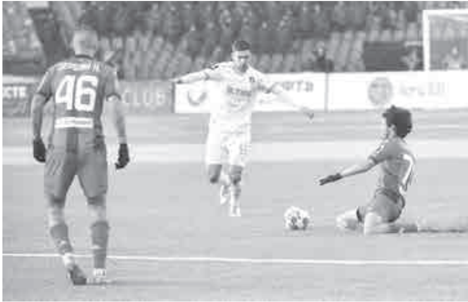
Игра, вопреки погоде, стала горячей.

бургским «Уралом». Команды месяц назад встречались в четвертом раунде Кубка России (0+). Тогда «Урал» на родном стадионе на восьмой минуте забил быстрый гол и просто не дал Хабаровску отыграться, вышибив его из борьбы за почетный трофей.