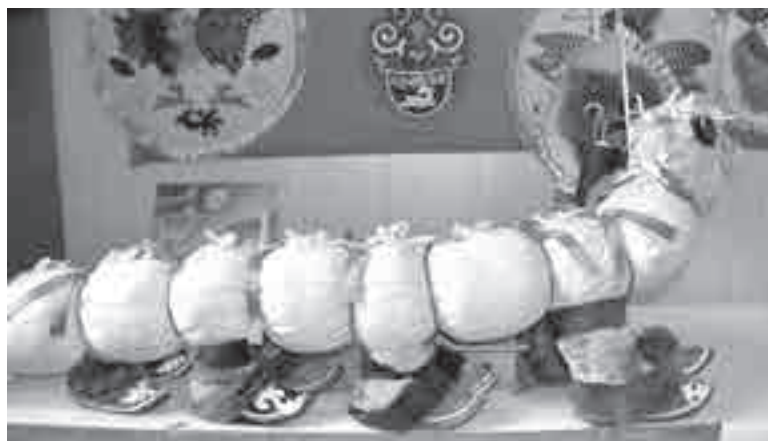
Вот такая «восьминожка» в сунгоркинских тапочках.

Окончив восьмилетку, девушка поступила в механический