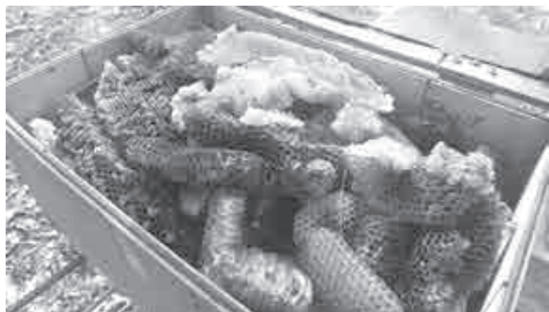
А это «сушь», эти соты уже без меда...