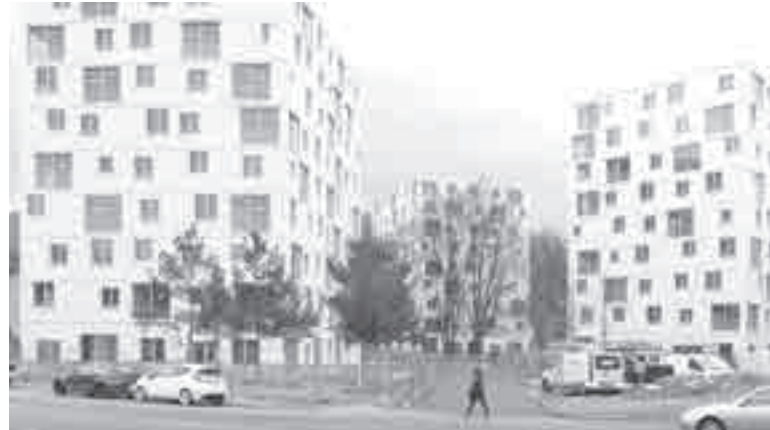
Красивые макеты будущих зданий.

четвертому и пятому лотам на земельных участках площадью 40,4 га и 31,62 га, предусматривающие строительство не менее 362 тыс. кв. метров жилья. В этот раз ДОМ.РФ проводит аукционы нового типа, объединяющие механизмы комплексного развития территорий (КРТ) и торгов «за долю». Предметом аукциона является стоимость права заключения