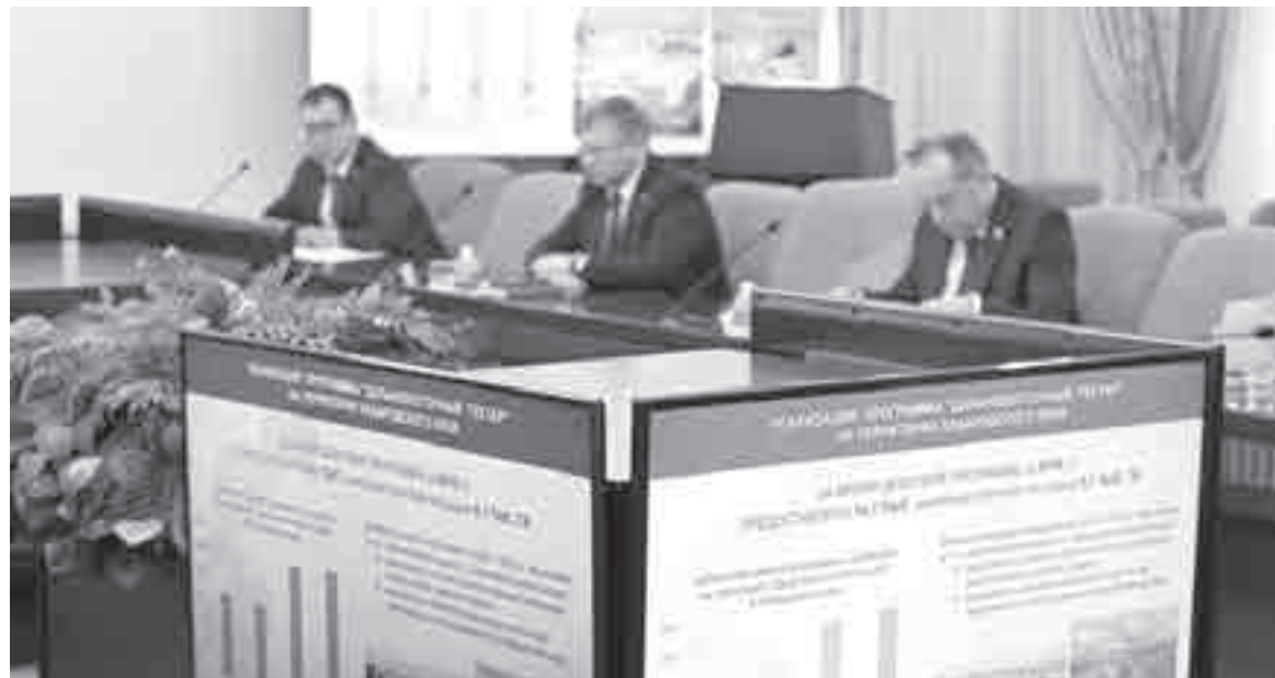
С 2016 года в крае 3881 «ДВ-гектар» оформлен в собственность.

Хабаровским льготникам предоставят участки или выплату