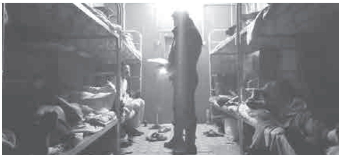
В таких вагончиках могут жить десятки людей.

– Криминологический процесс, состоящий из цепи взаимосвязанных преступных деяний. В начале вербовка с применением обмана, мошенничества, злоупотребления уязвимым положением. А в конце жесточайшая эксплуатация