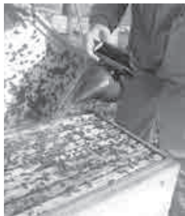
Пчелы уже вялые, готовятся к зиме, объясняет Сергей.

– пенополистероловые. Как объясняет пасечник, они легкие, удобно работать, а внутри каждого по 10 рамок, которые пчелосемьи наполняют медом.