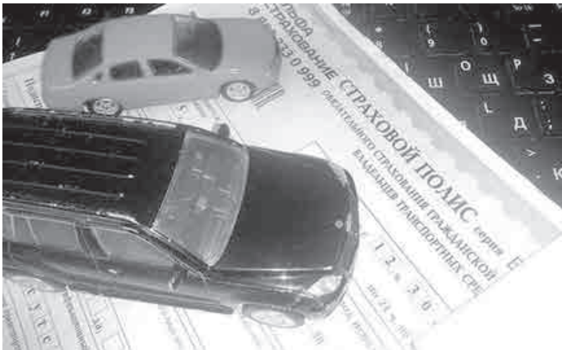
«Артисты» разыгрывали во дворах представление...

Мозгом и главой назначили Пашу. Точнее, он сам себя определил в руководство. Да и правильно: читал много и жадно, выбирая литературку по теме. Простудировал сайты и автофорумы, где писали про «подставу». В результате получил готовые схемы обмана. Хотя сам Паша это не считал