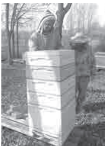
Новые, легкие улики.

В рамках национальной цели «Достойный, эффективный труд и успешное предпринимательство» к 2025 году ставится задачей увеличение численности занятых в сфере малого и среднего предпринимательства, включая индивидуальных предпринимателей и самозанятых, до 25 млн человек.