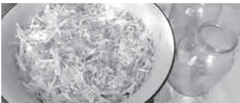
Все готово для начала процесса...