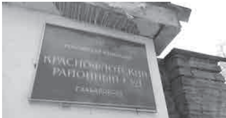
7 ноября в суде пройдет очередное слушание громкого дела.

Напомним, 26 апреля в квартире 55-летнего журналиста прошел обыск, его задержали. 27 апреля Центральный районный суд отправил Мингазова под домашний арест на два месяца, потом этот срок был продлен. 26 августа состоялось первое заседание по существу дела в Краснофлот-