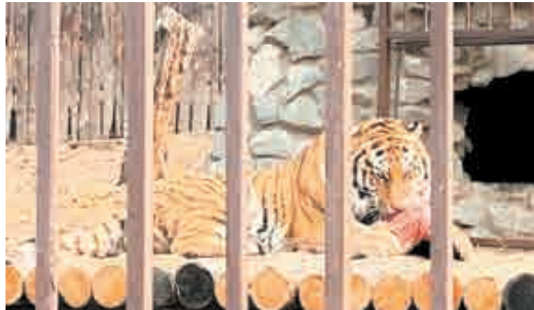
Тигр выглядит грозно, но сам охотиться, увы, не может...

работники, тут можно смело говорить о любви!