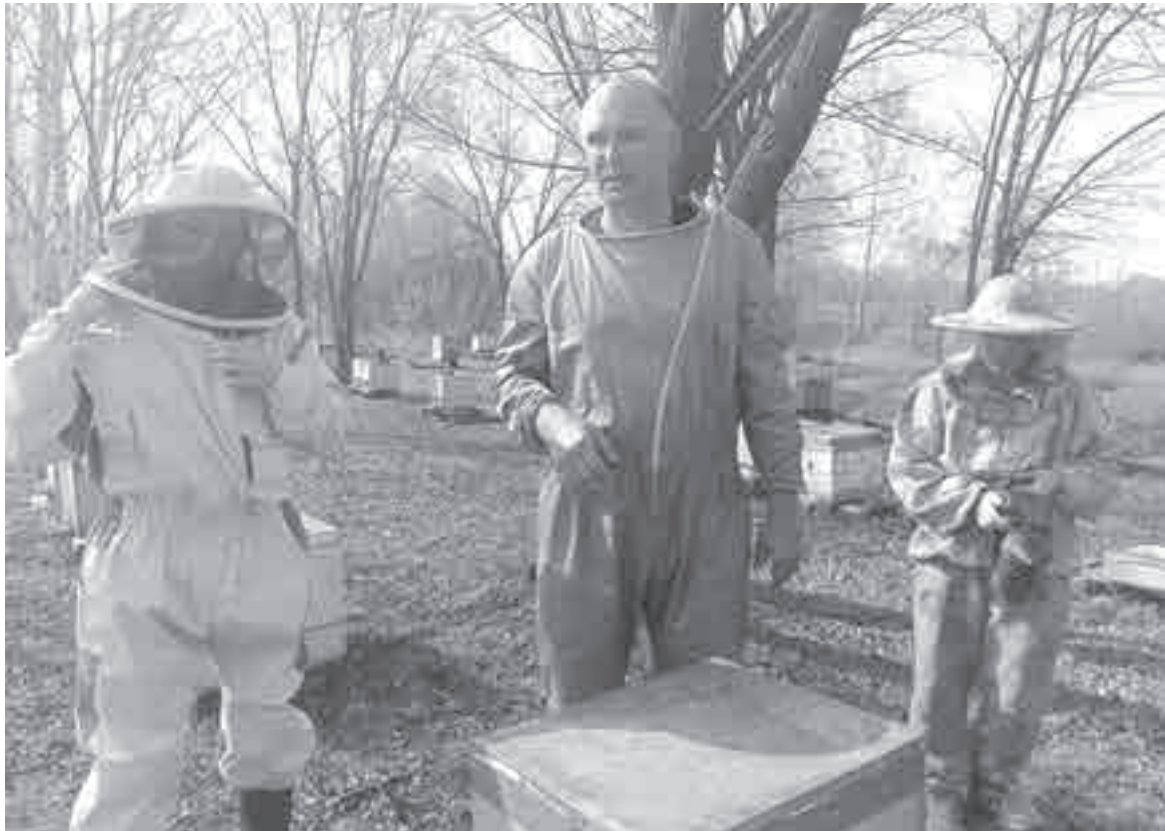
Вся семья в кадр не поместилась...