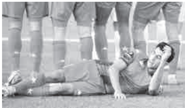
Поле мягкое, можно и полежать?

Армейцы тогда смогли добиться нужной им ничьей – 1:1! Болельщики неистовствовали и впервые смогли пустить на переполненном стадионе фанатскую круговую «волну» (и помнится, тот стадион вмещал не 15, а все 20 тысяч зрителей). Зрелище необычайное, некоторые игроки, если память опять же не изменяет,