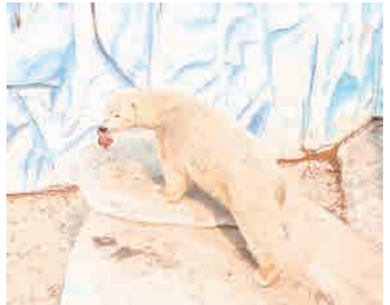
Алмазу нужен особый рацион и климат.

– Ее в зоосад принесли люди с добрым сердцем. Неизвестно, что произошло, но повреждения