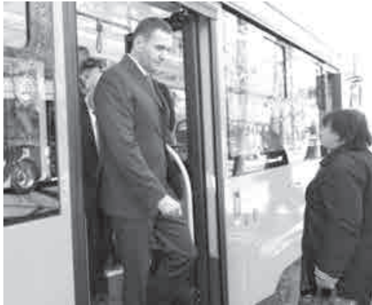
Когда еще увидишь губернатора, выходящего из трамвая?

Губернатор решил лично оценить состояние прибывшей техники, проехав от трамвайного депо № 1 до остановки «19 школа». Журналисты тоже убедились, что начинка в новых машинах – самая современная: внутри есть Wi-Fi, порты для зарядки мобильных устройств, электронное табло, на котором показываются остановки и скорость транспорта.