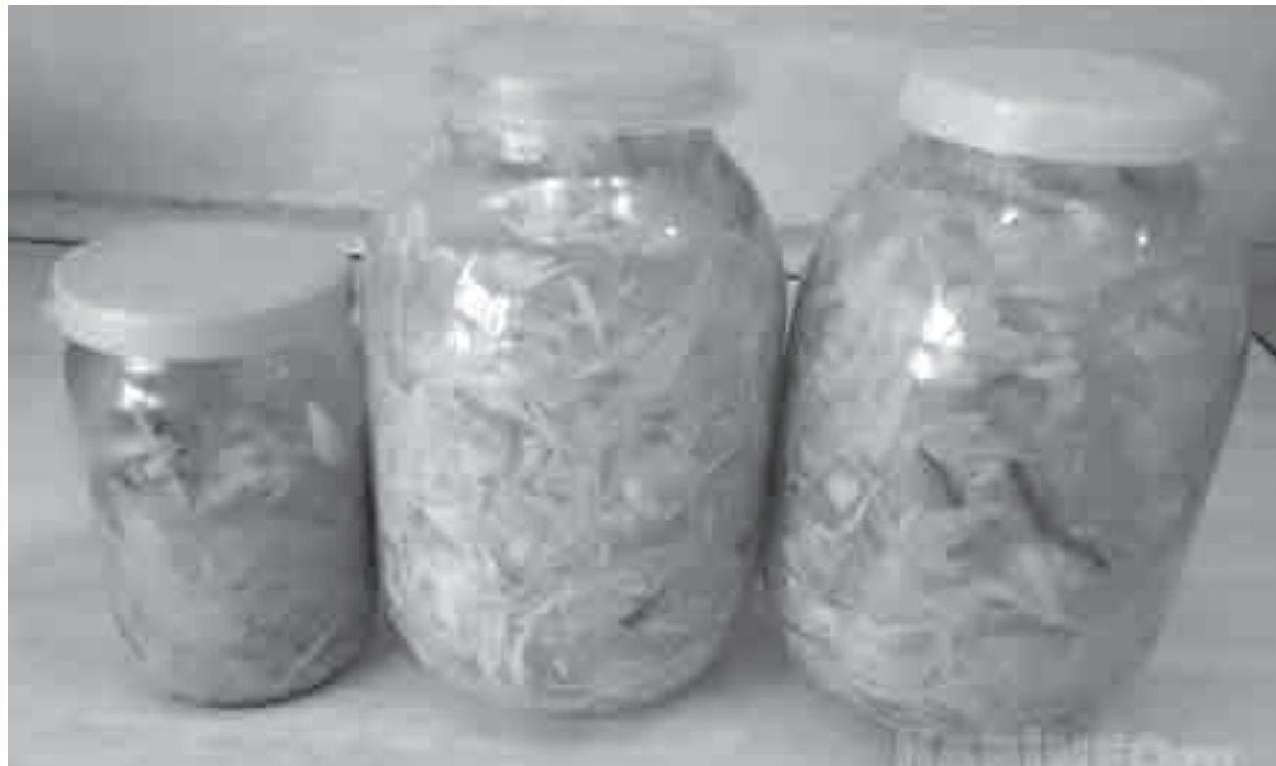
Знакомая картина, не правда ли?