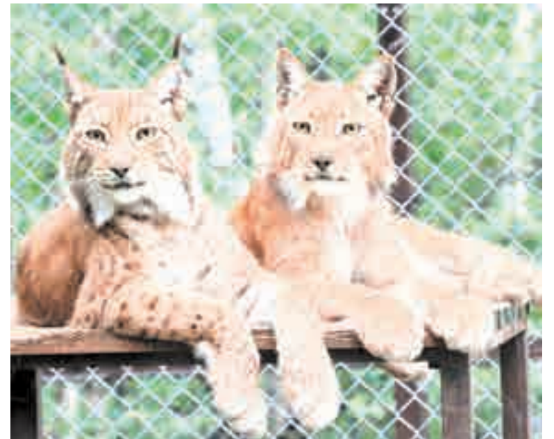
Говорят, это любовь...

были серьезные, наш ветеринар был вынужден удалить ей лапку. Сейчас Черныш чувствует себя комфортно. Он активен, ему удалось подружиться с членами его новой семьи, – говорит Елена.