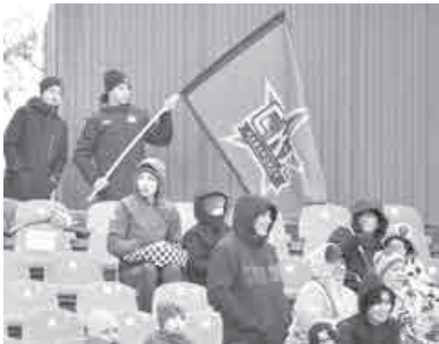
Быть хабаровским фанатом непросто.