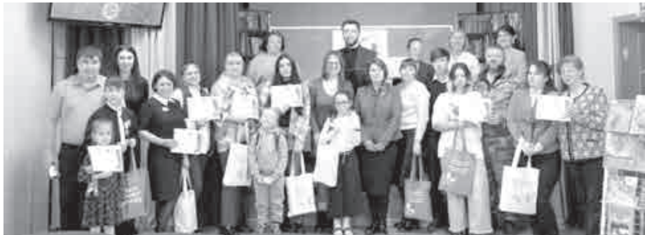
15 семей со всего края приняли участие в конкурсе «Экопривычки в семью внедряй, сделаем чище Хабаровский край!».