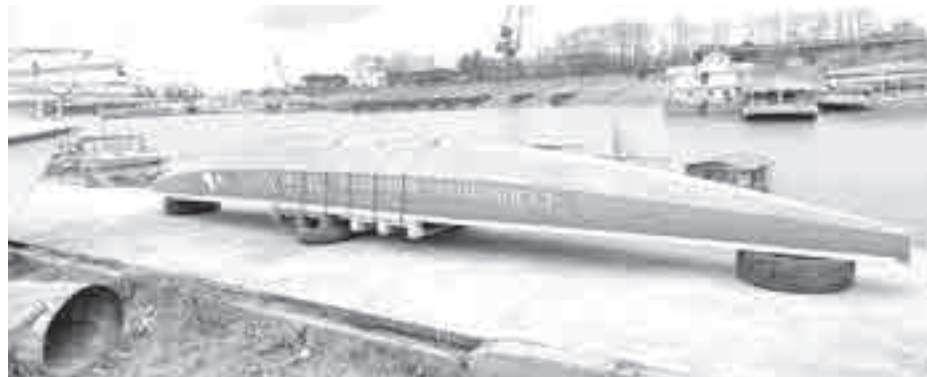
10-местный «Дракон» соответствует всем международным стандартам Федерации байдарок и каноэ. СШОР «Дельфин»

– Такая лодка в среднем стоит 800 тысяч рублей. Это была наша мечта. Мы обращались и во Всероссийскую федерацию гребли и в Министерство спорта Хабаровского края. Наш край нам тоже помогает, 2,5 миллиона мы получили на приобретение дорогого оборудования. Большое спасибо приморцам за такой щедрый подарок. Для нас отрываются большие перспективы. В том числе – дополнительные выезды на российские и международные соревнования. Я надеюсь, наши действующие гребцы смогут быстро освоить эту лодку. Если будем выезжать, побеждать, будет приходить к нам молодежь. Соответственно, и результаты будут. Это очень большое