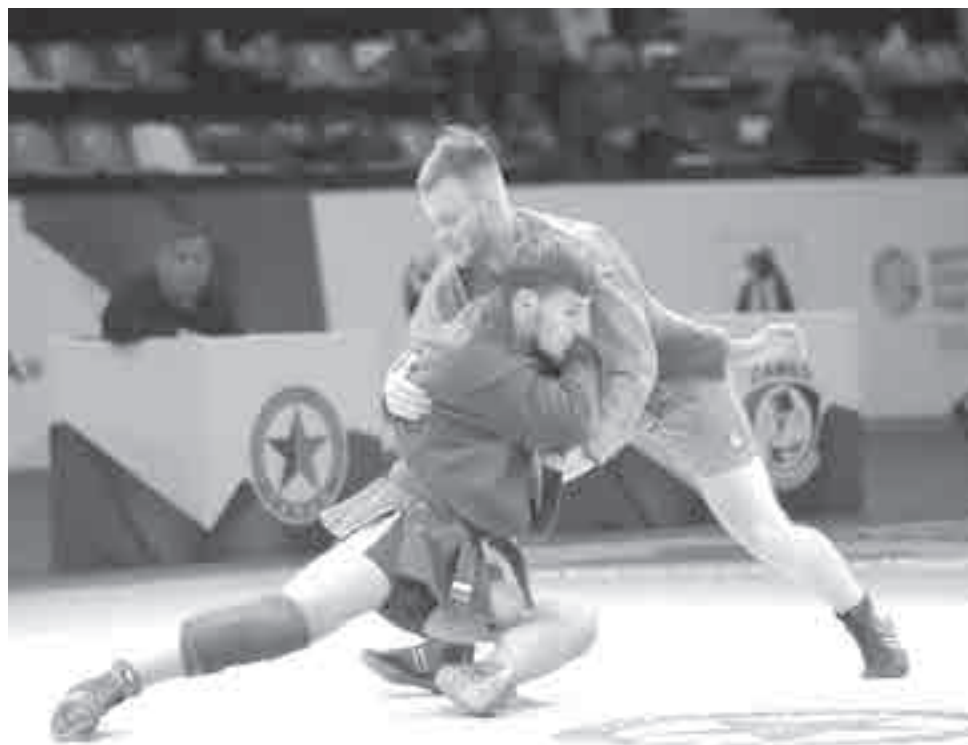
Указ о праздновании Дня самбо подписал президент России Владимир. 16 ноября 2024 года этому виду единоборств исполняется 86 лет.