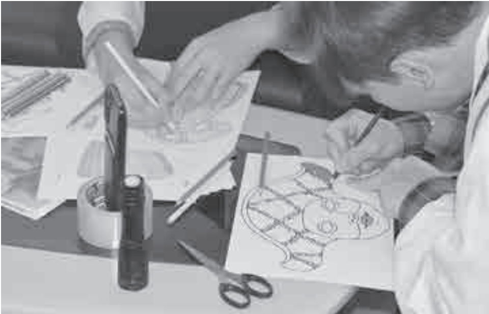
В рамках театрального фестиваля каждый мог почувствовать себя художником по костюмам.