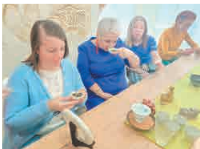
Чахэ и имеет форму морской раковины и помогает ознакомиться с сухим чайным листом.