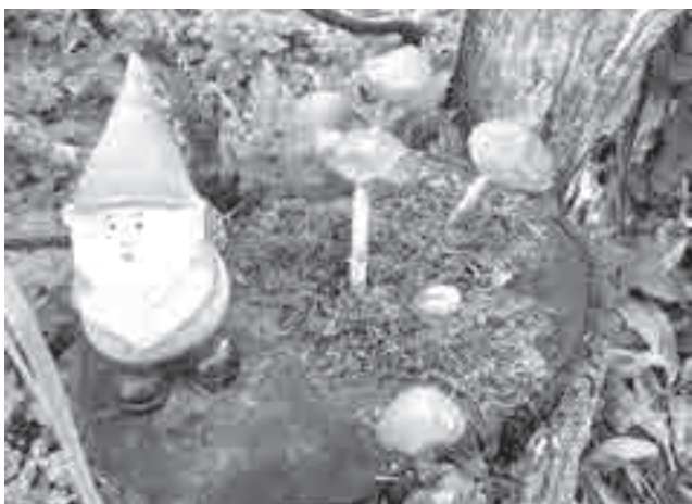
«Далеко в краю лесном жил-был старый-старый Гном...»