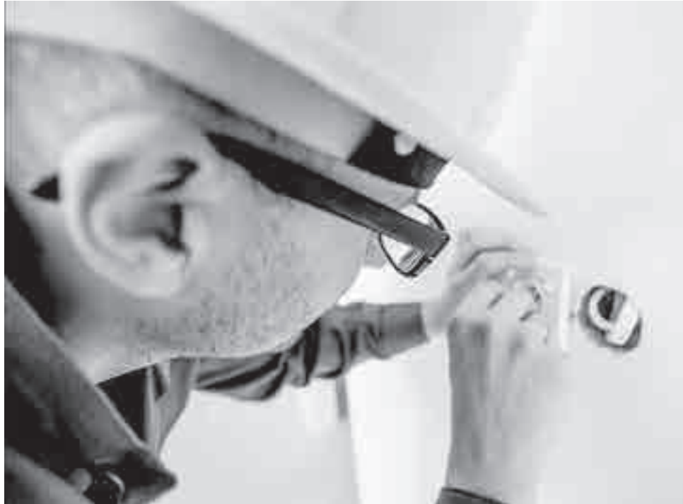
Сегодня многие мастера работают как самозанятые. Значит, никто не отвечает за их деятельность.

Происходит это так: приезжает человек, который, не называя реальной цены, тут же разводит бурную деятельность. Разбирает весь прибор, накидывает разных запчастей... В итоге чинит холодильник по цене,