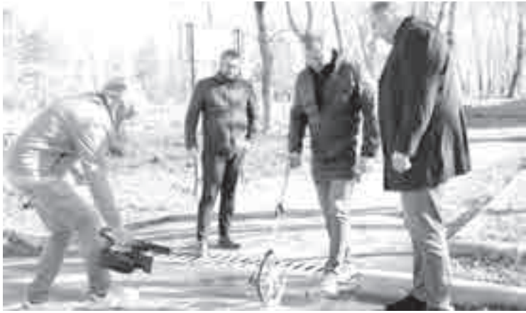
Одним из важных этапов работы стал контроль со стороны жителей населённых пунктов.