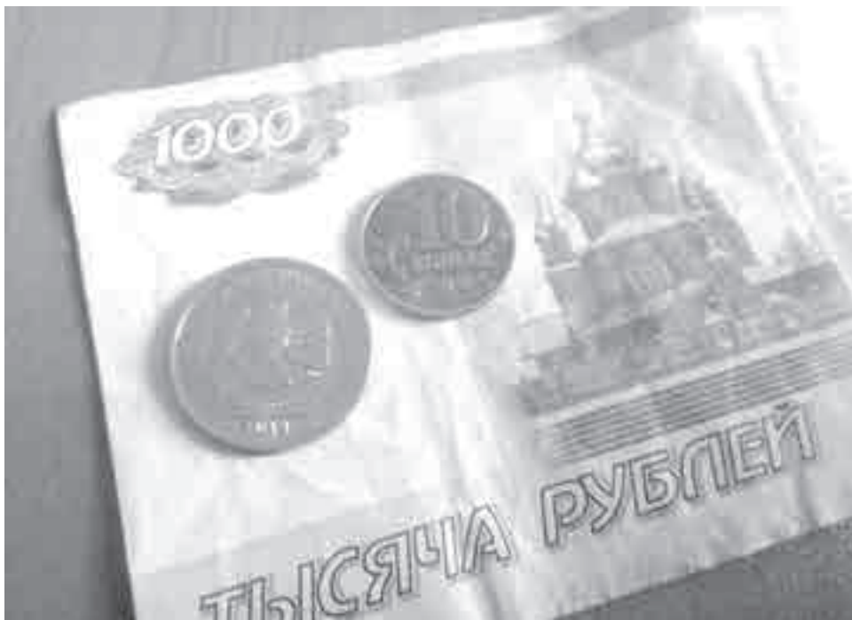
Где можно подзаработать, не увольняясь с основного места службы?

не получится, но оно того стоит!», – делится опытом Марина.