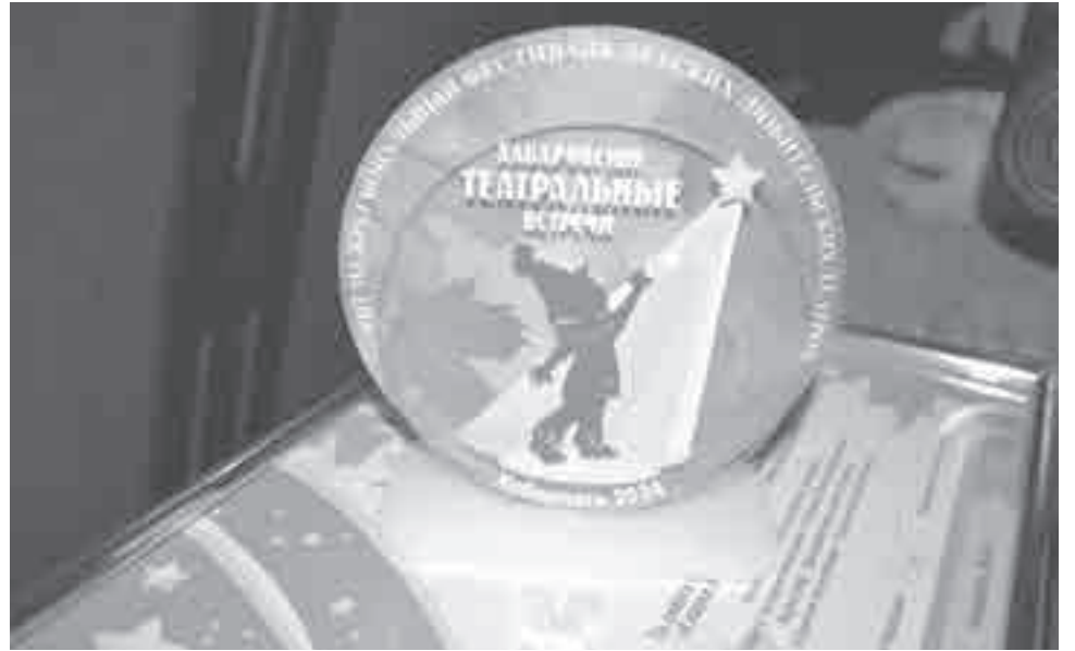
Четыре лучших коллектива отправятся учиться в Центр «Созвездие». Обучение будет проходить в рамках фестиваля «Страна – Театр – Школа».

В Хабаровске прошёл VIII Межрегиональный фестиваль детских любительских театров «Хабаровские театральные встречи», который собрал 12 коллективов из Хабаровска, Хабаровского края, Приморья и Республики Саха (Якутия). Мероприятие приурочено к 225-летию со дня рождения Александра Пушкина.