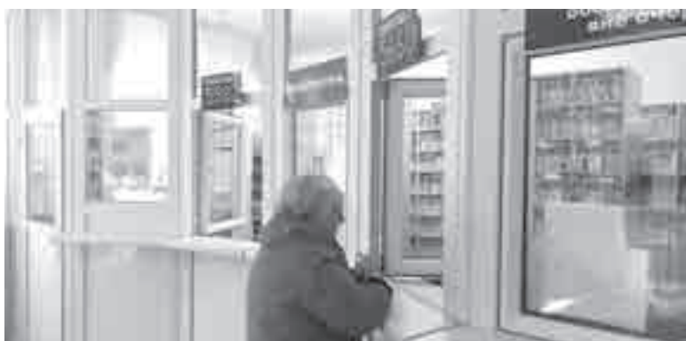
Количество пациентов, которым требуются льготные лекарства, ежегодно растёт.

Проект амбулаторного лечения хронического гепатита С в крае будет продолжен в 2025 и 2026 годах, когда планируется пролечить 429 и 445 пациентов соответственно.