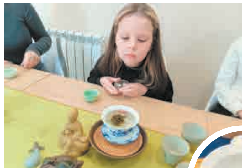
А этот чай вкусный?

разбираться в множестве сортов чая. Еще нужна специальная посуда. Ее девушки заказывали для мастер-классов прямоком из Китая. И речь идет не только о привычных нам чайниках и чашках. Кстати, их в нашем понимании тут нет. Чай китайцы пьют из небольших пиал. И используют в процессе церемонии еще много разных аксессуаров. Например, есть специальная