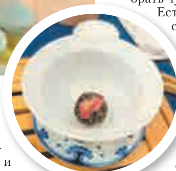
Таинственный шарик: чай или аксессуар?

Чтобы провести чайную церемонию по всем правилам, посуды и других диковинных штук набирается целый чемодан. Здесь среди пиалочек, чайничков и прочего мы нашли статуэтку зверушек и людей. Это так называемые чайные питомцы – фигурки,