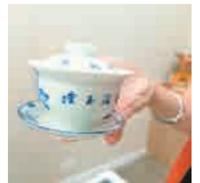
Гайвань символизирует небо, землю и человека.

призванные усладить взгляд гостей и развлечь их. Обычно это жабы, поросята, драконы. Но порой встречаются и очень неожиданные – писающий мальчик, например. Он вызвал бурю восторга и хохота у гостей.