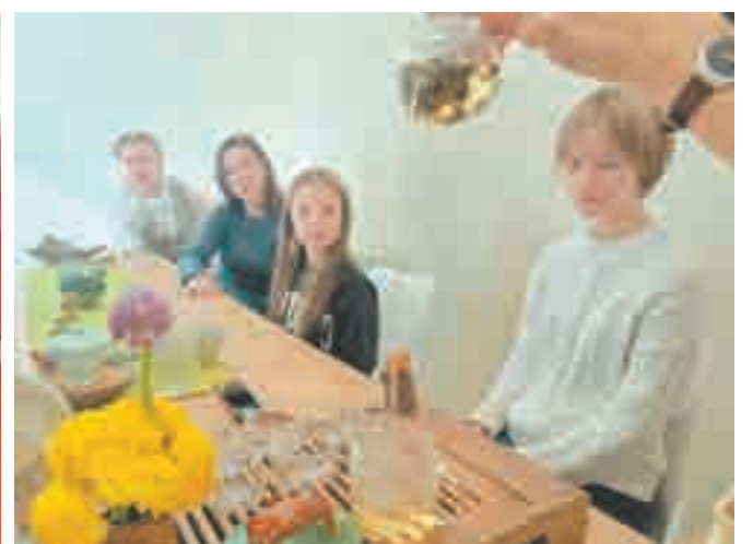
Чай нужно не только правильно заварить, но и разлить.