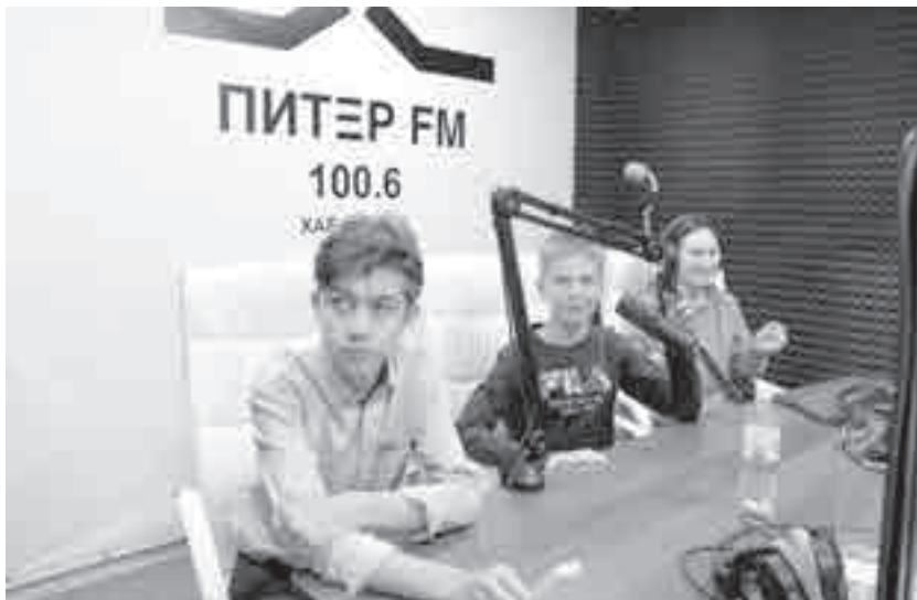
Всё новое всегда интересно.

Экскурсия прошла в рамках проекта ранней профориентации «Билет в будущее», который помогает школьникам знакомиться с разными профессиями и делать осознанный выбор. Проект реализуется в Хабаровском крае в рамках нацпроекта «Образование».