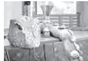
Символ турнира – пятиметровая мудрая змея.

До XIX века культивировалась исключительно в Восточной Азии, в XX веке распространилась по всему миру. Входит в число пяти базовых дисциплин Всемирных интеллектуальных игр. Общее число игроков превышает 40 млн. человек.