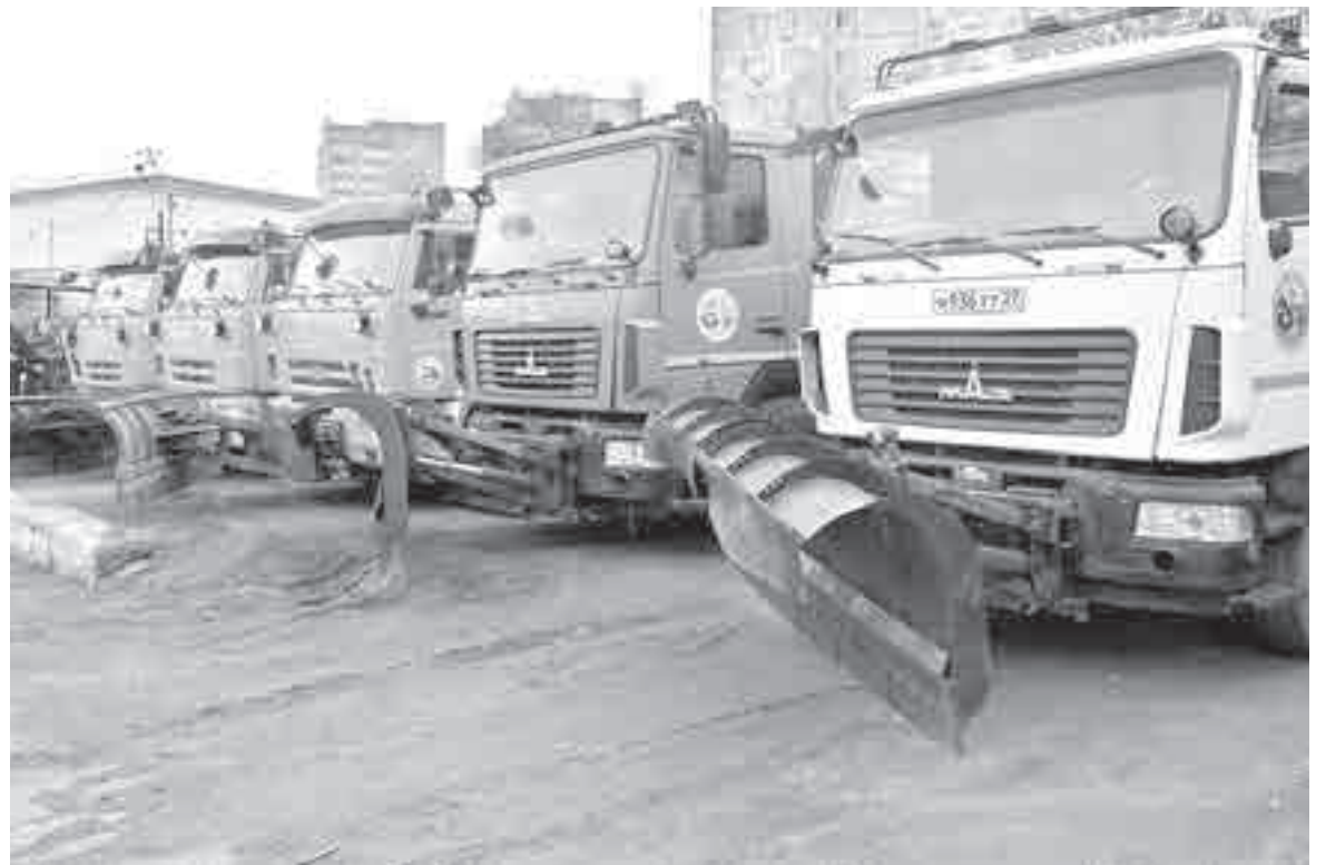
Техника для зимних работ есть, только вот работать на ней некому.