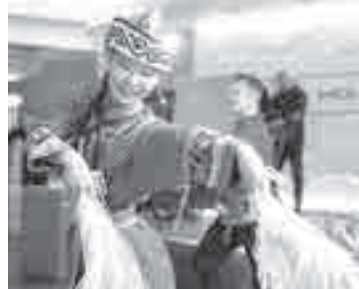
Перед спортсменами и гостями выступили дальневосточные артисты.

в арсенале два серебра Всероссийского значения. Одно из них он завоевал на Кубке Посла Китая в Москве в зачете до 9 лет.