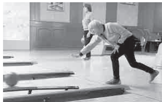
Под конец бросали все точнее.

В рамках национальной цели «Сохранение населения, здоровье и благополучие людей» ставится задачей достижение к 2030 году обеспечения устойчивого роста численности населения РФ, повышение ожидаемой продолжительности жизни до 78 лет, снижение уровня бедности в два раза по сравнению с показателем 2017 года, увеличение доли граждан, систематически занимающихся физкультурой и спортом, до 70 процентов.