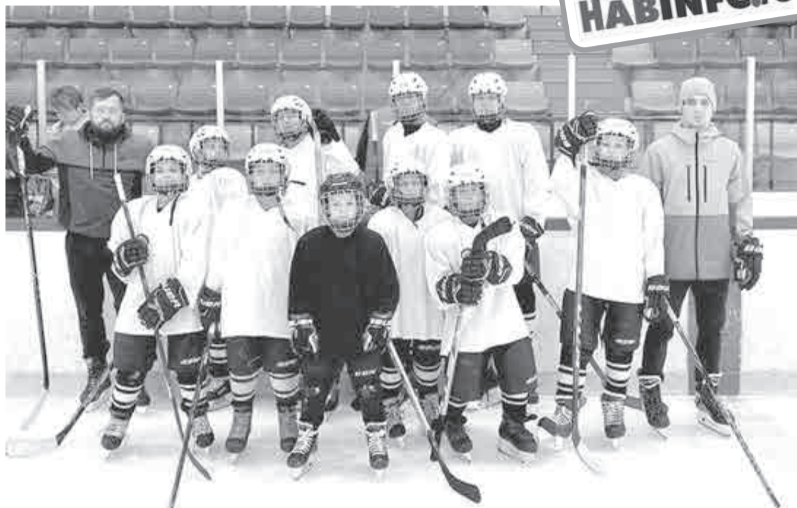
Такая команда на Дальнем Востоке пока одна.