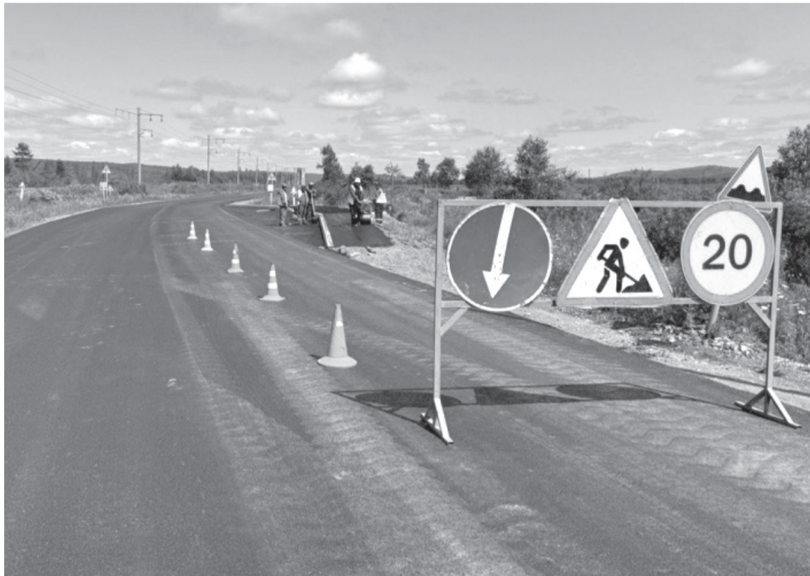
Сезон ремонтных работ идет с мая по октябрь.

градил регионы – лидеры по реализации нацпроекта. К слову, представители нашего края получили на форуме диплом «За высокий уровень и эффективное взаимодействие проектной команды».