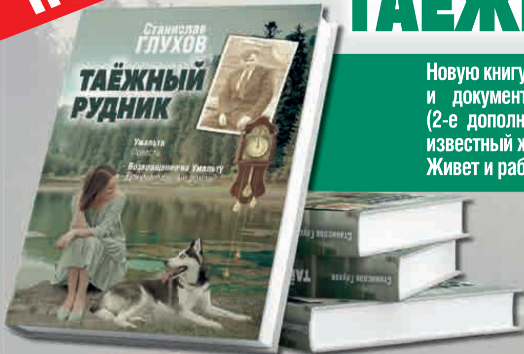
Издательский дом «Гранд Экспресс», 336 стр., 45 стр. илл., твердый переплет, ламинация.

В основе – реальные истории, как в годы войны далеко в тайге умальтинцы жили, работали и любили.