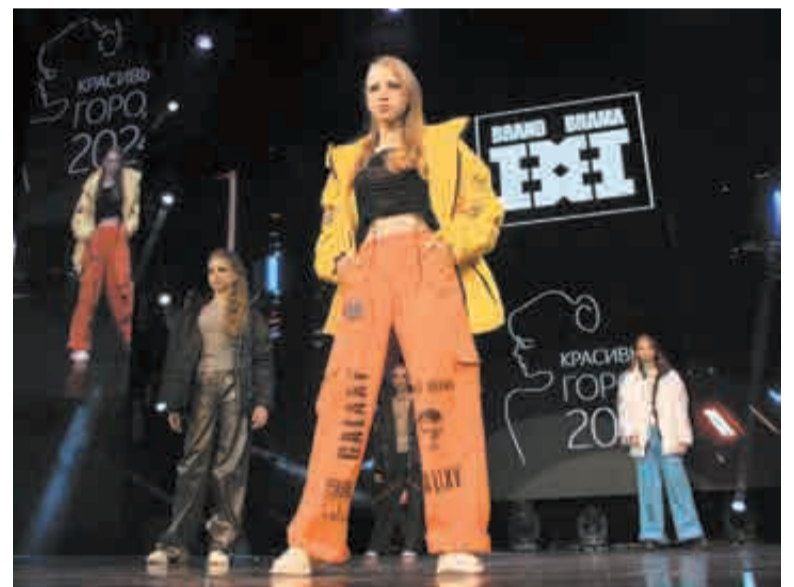
Такой он, футуризм с чертами киберпанка?