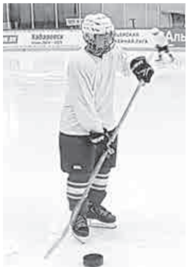
Шайба здесь гораздо крупнее.