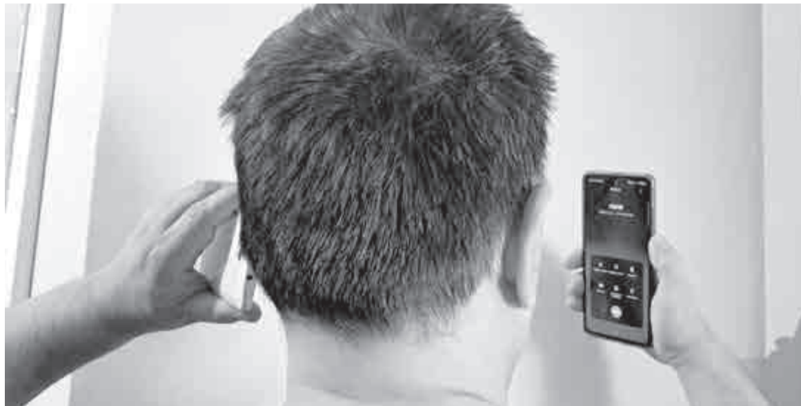
Помимо трафика, нагрузку на инфраструктуру создает число подключенных к сети устройств, которое уже достигло 315 млн единиц.

Абоненты оказались желанной целью не только для мошенников