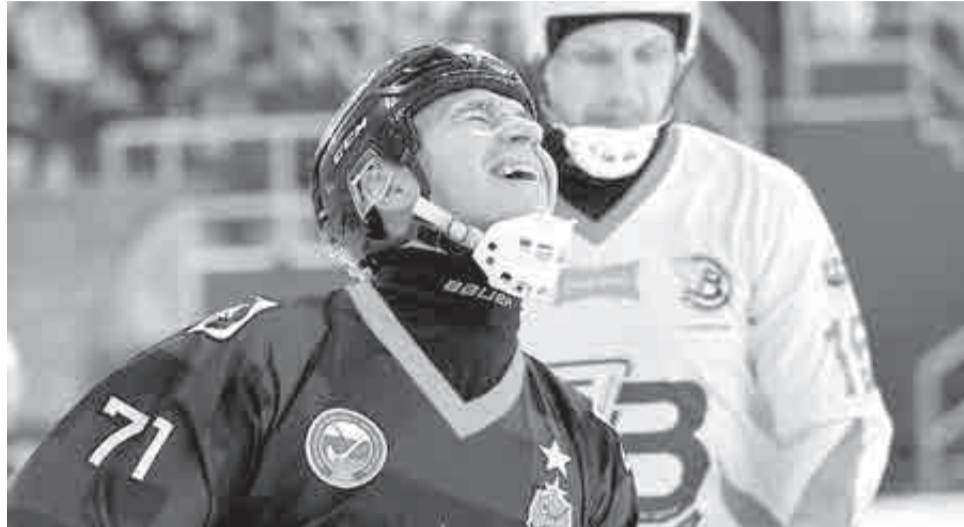
Хоккей – что с мячом, что с шайбой – в последнее время не радует.

Хабаровских болельщиков бросает то в жар, то в холод