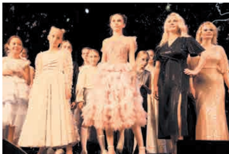
Здесь были модели разного возраста, роста и разного уровня подготовки.

Коллекция Тамары Гричухиной («TamaraCouture») тоже предназначалась для юных моделей ростом лишь в 110-146 сантиметров. Дизайнер работает с доступными материалами от российских производителей и партнеров, причем довольно успешно: платья на