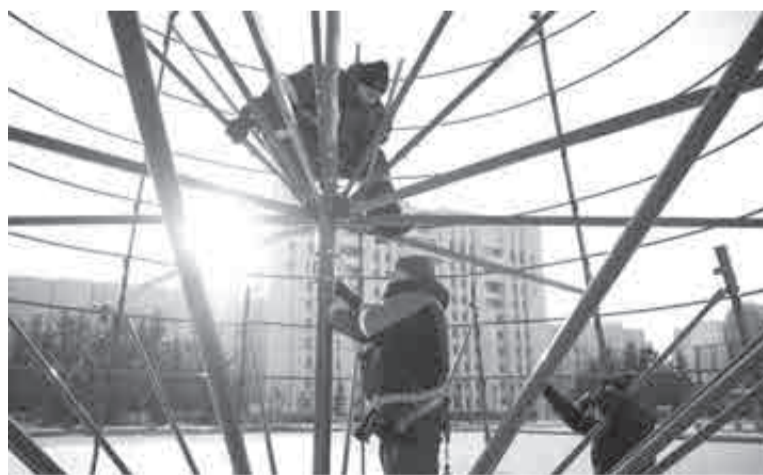
На главной площади уже устанавливают праздничную ель.

Минлесхозе края напомнили, что самостоятельная заготовка деревьев хвойных пород запрещена. За это предусмотрены административные штрафы до пяти тысяч рублей для граждан, до 50 тысяч – должностных лиц и до 500 тысяч – юрлиц. Если ущерб нанесен в размере более пяти тысяч рублей, то нарушителю гро-