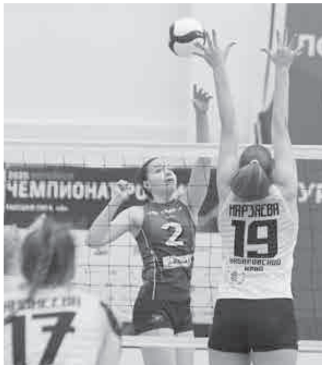
Хабаровчанки дали бой карполевской «Уралочке».

Тем более что Александр Щурин и его дружина дали бой фавориту. Уже первый, казалось, проигранный сет наши волейболистки смогли выиграть – 25:22. Вторая партия, правда, была точно не наша – 16:25. В третьей мы снова поборолись, но снова уступили – 23:25. А в четвертой партии нашла коса на камень, и в концовке «тигрицы» выцарапали