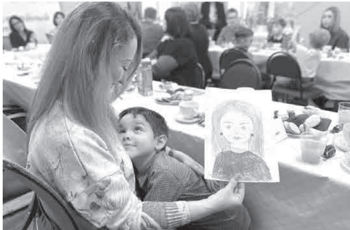
«Мама, это ты!»