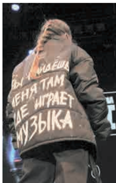
Порой дизайнерам было мало просто языка моды.