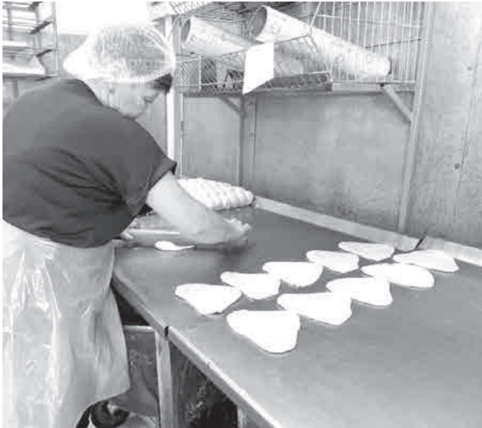
Работа с тестом.

Как в крае поддерживают социальных предпринимателей