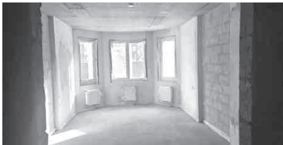
Дом на Салтыкова-Щедрина наконец достроили.

При этом в июле этого года в эксплуатацию сдан 27-этажный жилой дом на 188 квартир застройщика обанкротившегося «Диалога», расположенный в Хабаровске по улице Кавказской. Объект удалось достроить благодаря средствам, которые также были выделены из краевого бюджета и бюджета ППК «Фонд развития территорий».