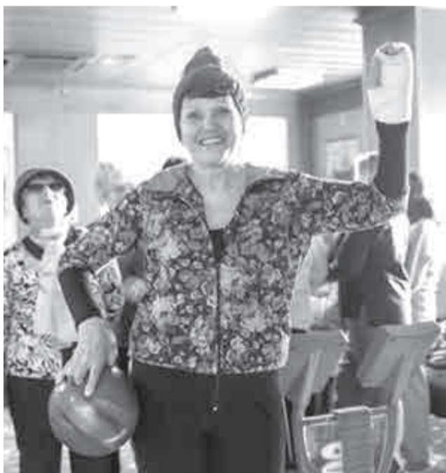
Когда даже травма – не помеха...

гом. Сейчас отдаю себя творчеству, занимаюсь в вокальной и театральной студиях. Сюда пришла во второй раз и всегда рада, что мы с девчонками так дружно проводим время!