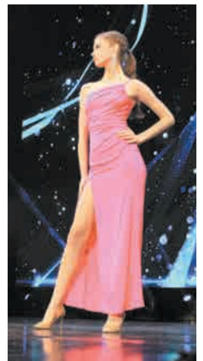
Привет от Барби?

Целью регионального проекта «Творческие люди» (нацпроект «Культура») является создание условий для реализации творческого потенциала нации. Региональным проектом предусмотрено увеличение к 2024 году количества волонтеров, вовлеченных в программу «Волонтеры культуры», а также количества реализованных выставочных проектов.