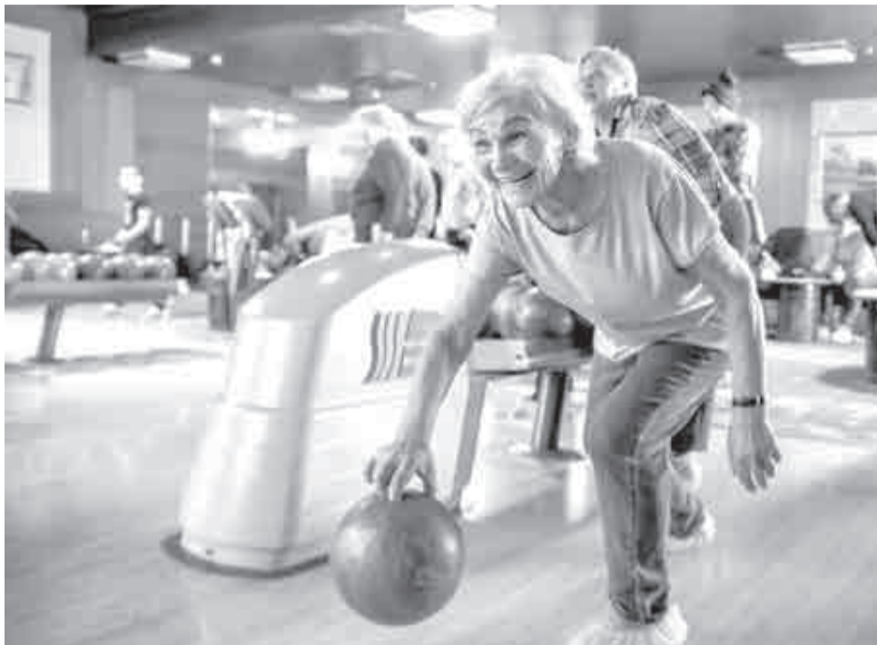
Сейчас будет страйк!

– Да, легко, – отвечает пенсионерка. – У меня правая сильная рука, ей и буду бросать. Я с детства дружу со спортом, всегда участвовала во всех соревнованиях. Занималась фехтованием, борьбой, бе-