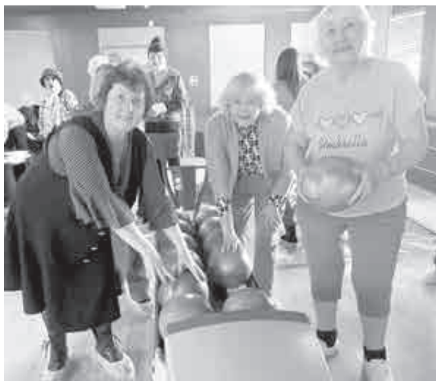
Выбираем шары.