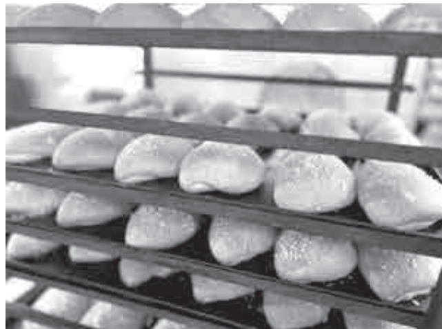
Кто не любит разные пышки и булочки?

По вопросам поддержки социальных предпринимателей можно обращаться в центр «Мой бизнес» по телефону 8800-555-3909, по адресу: Хабаровск, ул. Запарина, д. 51 или через официальный сайт центра.