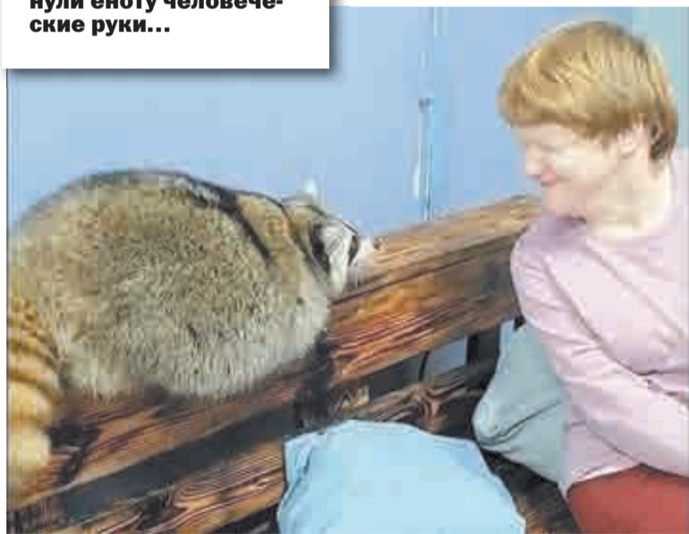
Первая встреча с енотом.