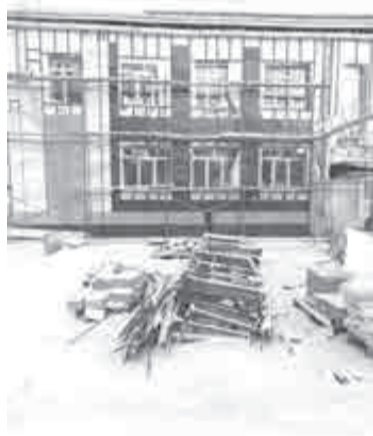
Завершаются ремонтные работы в учреждениях культуры.

концертных зала. Благодаря этому посещаемость культурных мероприятий выросла более чем в три раза, за весь период реализации нацпроекта жители и гости края побывали на концертах, спектаклях, выставках свыше 75 млн раз.