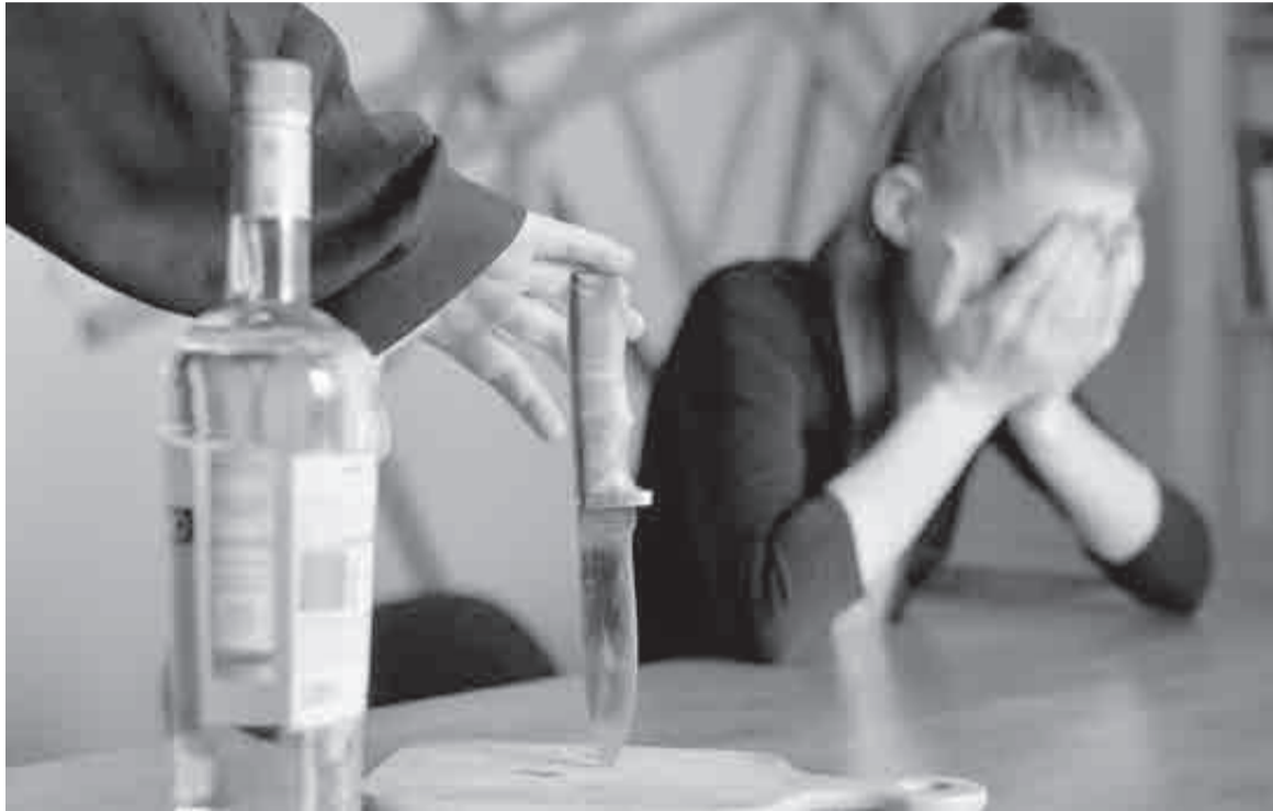
Обычная алкогольная история и не могла закончиться иначе?

– Владик? Ты опять к нему собралась, вот же самоубийца! Прибьет он тебя когда-нибудь, до смерти приколотит, – завела любимую песню подруга Анжелка. Эх, в другой раз надо сначала глянуть на экранчик, а потом отвечать!