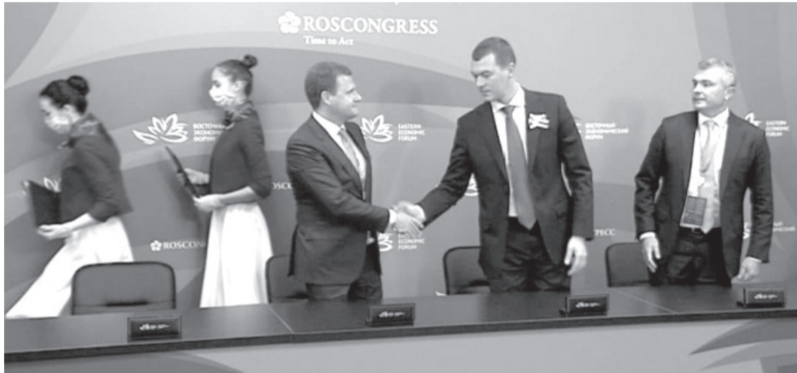
В сентябре 2021-го в ходе ВЭФ заключено соглашение между правительством Хабаровского края, министерством РФ по развитию Дальнего Востока и Арктики и госкорпорацией ВЭБ.РФ о развитии детского отдыха в регионе. Как сообщила пресс-служба правительства края, в документе предусмотрено создание круглогодичного детского центра для отдыха, оздоровления, обучения и творческого развития. Тогда сообщалось, что построить центр в районе Бычихи планируется в течение 2022-2023 гг.

Президентские поручения реализуют в крае