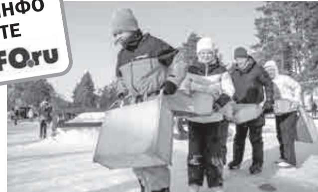
Для семей тут почти каждый день будут конкурсы и праздники.