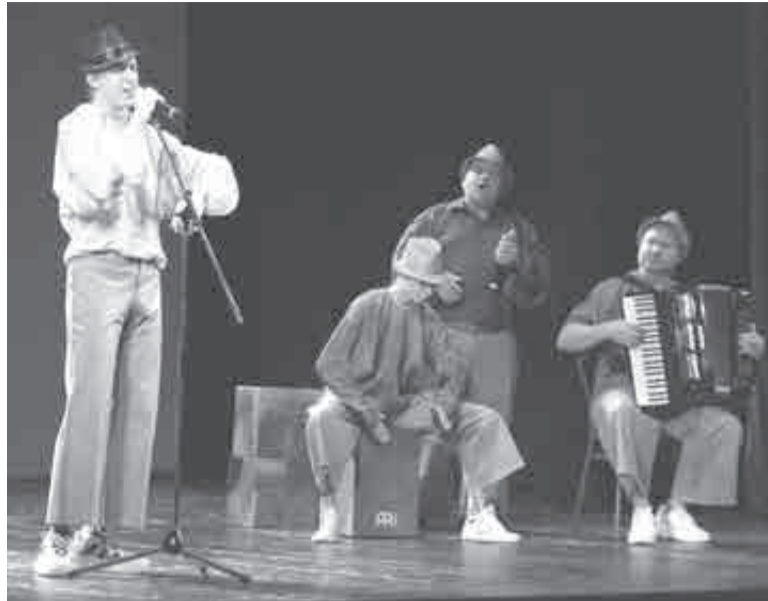
Актерская песня – странный жанр.