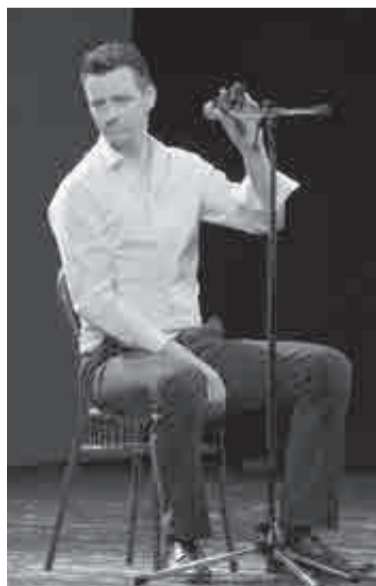
Порой, чтобы покори́ть публику, нужно лишь проникновенно спеть романс.

Тем более что, напомним, Орфей – легендарный певец и музыкант, герой древнегреческих мифов, также известен как поэт и философ. Уже в древности миф об Орфее стал основой для «орфизма» – философского учения о равенстве всех людей, независимо от сословий. А в еще основе