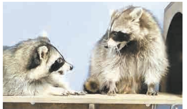
Енотовы разборки.