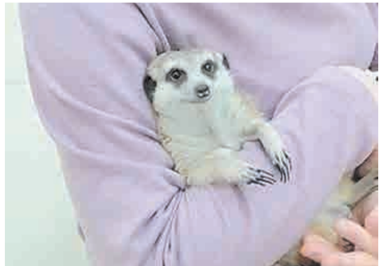
Хрупкое счастье в руках.