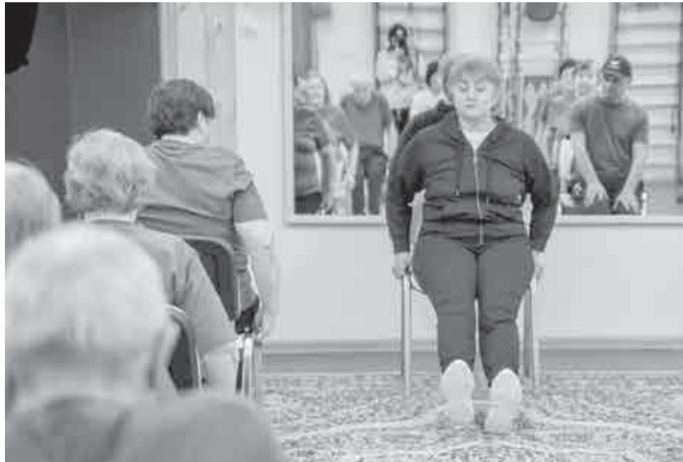
Повторяем все за мной...

навливать наши больные спины, ноги, после занятий улучшается подвижность, выносливость, в потом мы весь день на позитиве и более активны! – уверена пенсионерка.