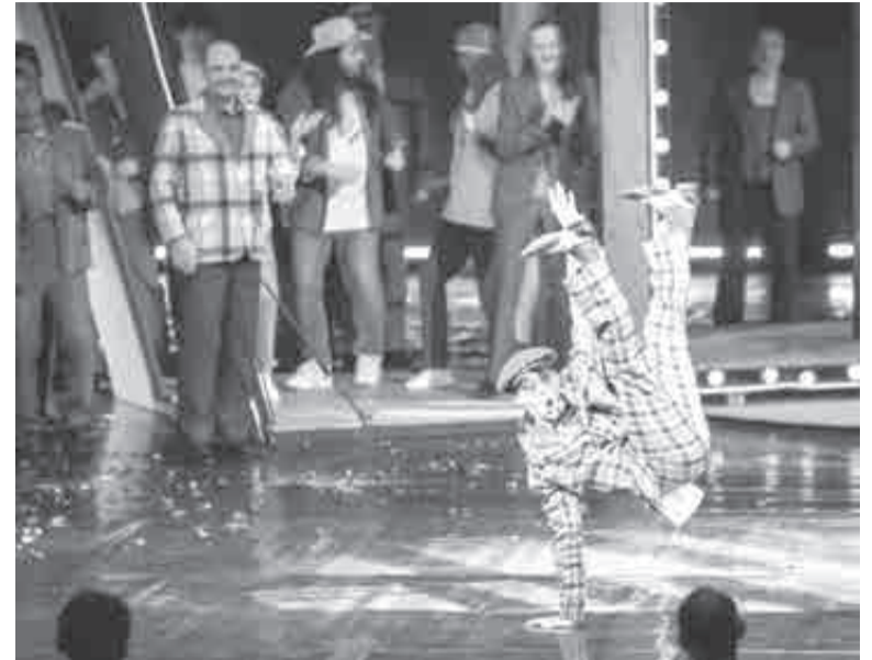
Иногда все это напоминало даже цирк.