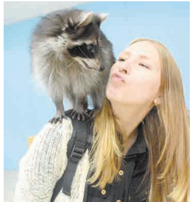
Такого милаху так и хочется поцеловать!