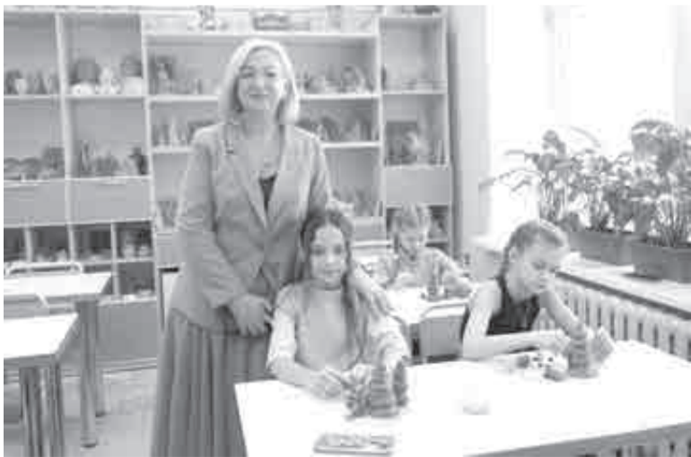
В художественной школе Амурска обучается 265 детей.