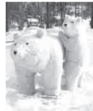
Местные мишки уже ждут гостей.

«Народный каток» будет работать с 12 часов дня до 23 часов в будни. В праздничные дни ледовая площадка будет встречать любителей спорта до часу ночи. В дни новогодних праздников на катке будут организованы мастер-классы и спортивные интерактивы (0+).