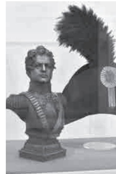
Восемь выставок в рамках нацпроекта прошли в крае в этом году.

– У нас богатейшее наследие малых народов, но мы их практически не подаем нашему населе-