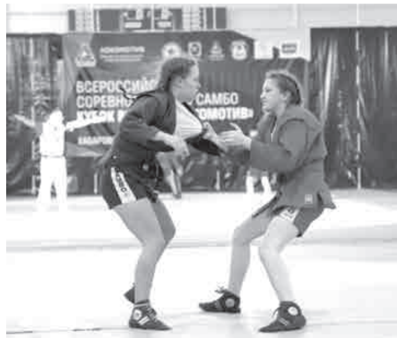
Девчонки тоже занимаются самбо.

Как сообщили в Минспорта региона, обладатели медалей определялись в 10 весовых категорий – у юношей и в девяти – у девушек. Самбисты Хабаровского края завоевали в общей сложности 26 медалей. Восемь – среди девушек и 18 выиграли юноши. Победителями всероссийских