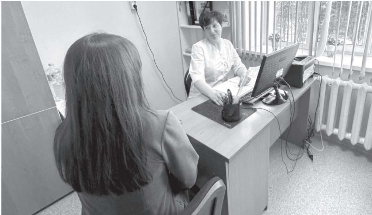
В гостях у куратора.

Социальные кураторы всегда помогут пациенту