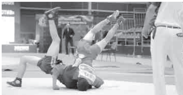
Красивый бросок!