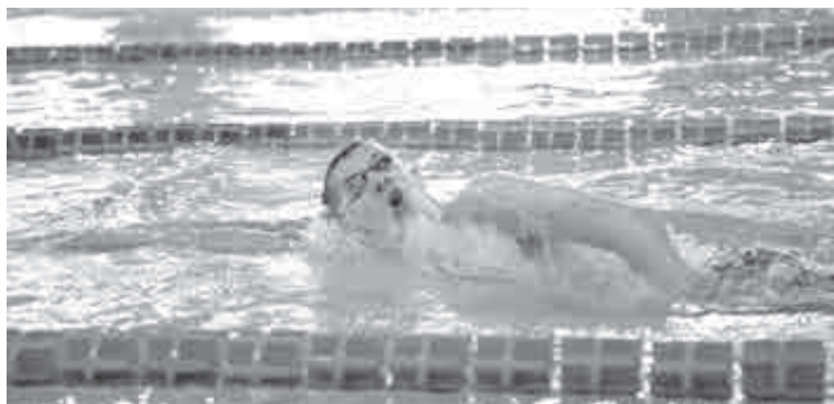
Старт следует за стартом.