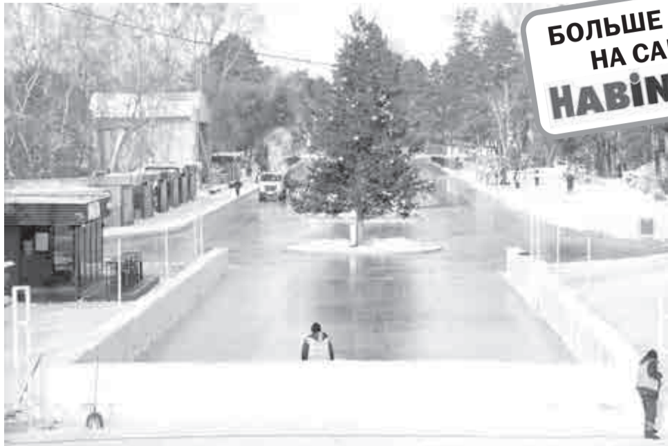
«Народный каток» начнет работу 22 декабря.

евой дирекции спортивных сооружений убедительно просит набраться терпения и дождаться официального открытия, когда ледовое поле будет готово полностью.