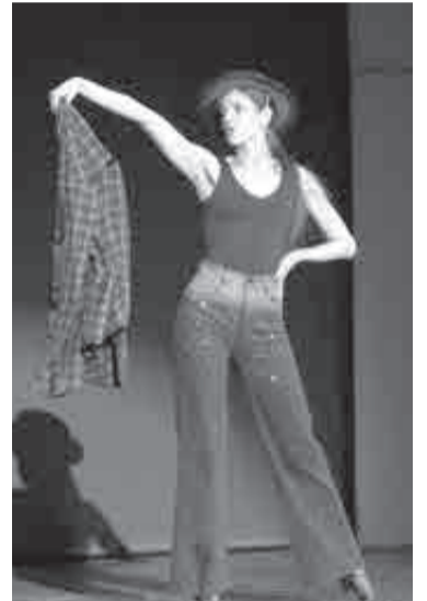
Когда пиджак становится партнером в песне...

Чем он сумел так всех порадовать? Пронзительным испол-