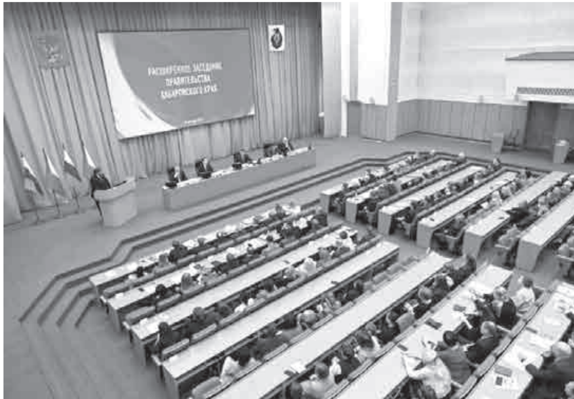
Итоги одного нацпроекта подвели, скоро начнется новый.

1,4 млрд рублей потрачено на культурный нацпроект в крае