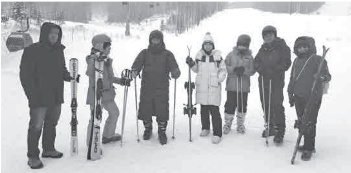
Китайские эксперты на себе испытали прелести русской зимы.

Здесь стоит напомнить, что это не первый такой визит. Так, этой осенью туркомпания из Китая уже посетила наш край, но тогда это происходило в рамках так называемой «реверсной бизнес-миссии». Итогом переговоров стало подписание шести экспортных контрактов с компаниями края на предоставление туруслуг гостям из Китая. Организатором той бизнес-миссии выступил краевой Центр поддержки экспорта, работающий в рамках нацпроекта «Международная кооперация и экспорт».