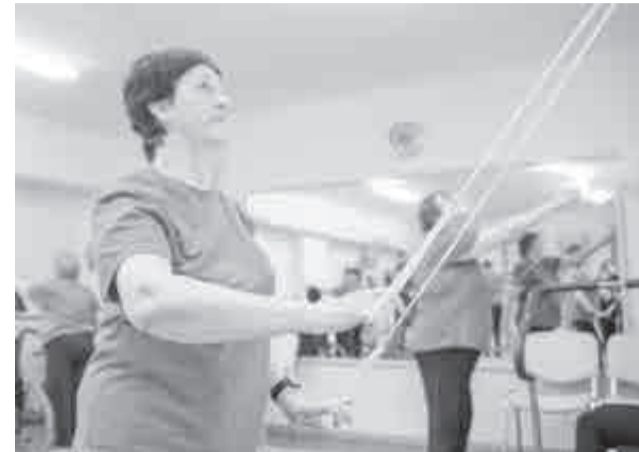
Еще усилие, не останавливаемся!

Академия уже провела здесь мастер-класс по настольным спортивным играм. В начале мероприятия подопечные Дома ветеранов под музыку сделали легкую разминку. Преподаватели и студенты кафедры адаптивной физ-