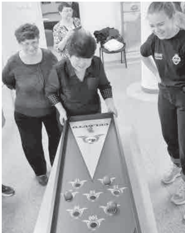
«Настолки» – это весело и полезно!