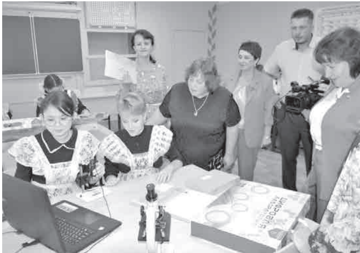
«Точка роста» теперь есть и в Эльбране.

Нацпроект «Образование» расширяется в крае