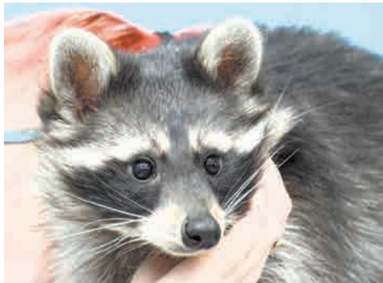
Милая мордашка.