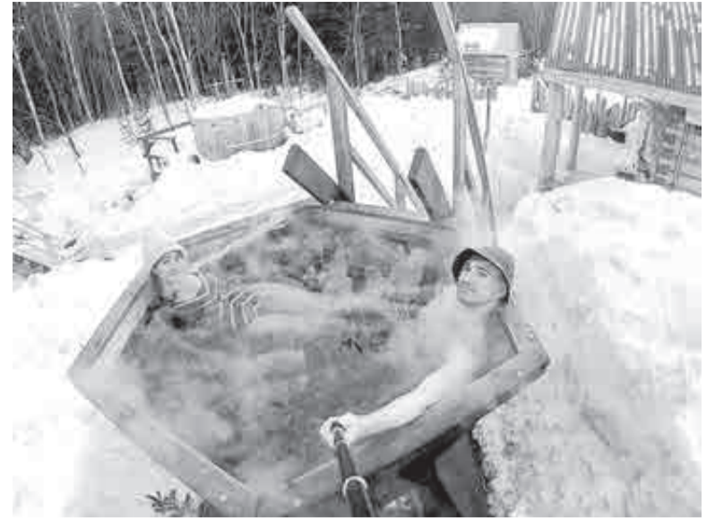
Баня бывает и такая.

Горнолыжный комплекс, который подходит не только для катания и тренировок, но и для отдыха. Номера гостиницы и коттеджи рассчитаны на одновременное расселение 250 отдыхающих. Вода подается из скважины на территории. Работают ресторан, кафе и бар. Еще тут есть банный спа-центр, катания на снегоходах, «ватрушках», лыжах, а также пункт проката спортивного инвентаря. Работают инструкторы и медики. Для детей оборудовано игровое помещение.