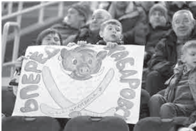
С Драконом кабанам и тиграм не повезло. Будет ли лучше со Змеей?