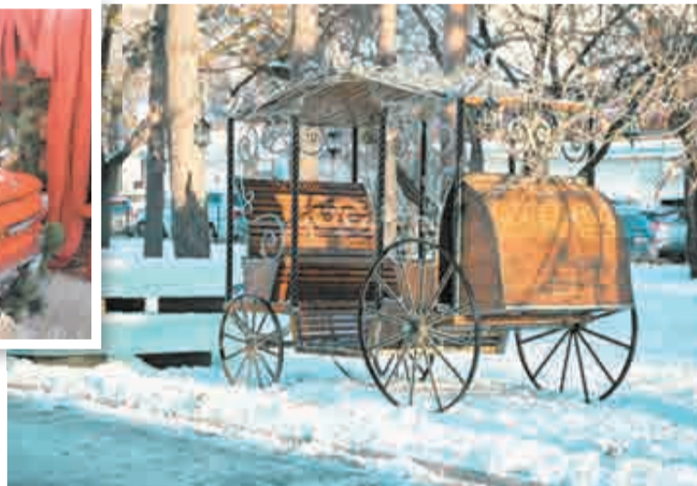
Новинка сезона – карета и городок возле центрального рынка.

Всего же в Хабаровске за неделю до курантов должны уже