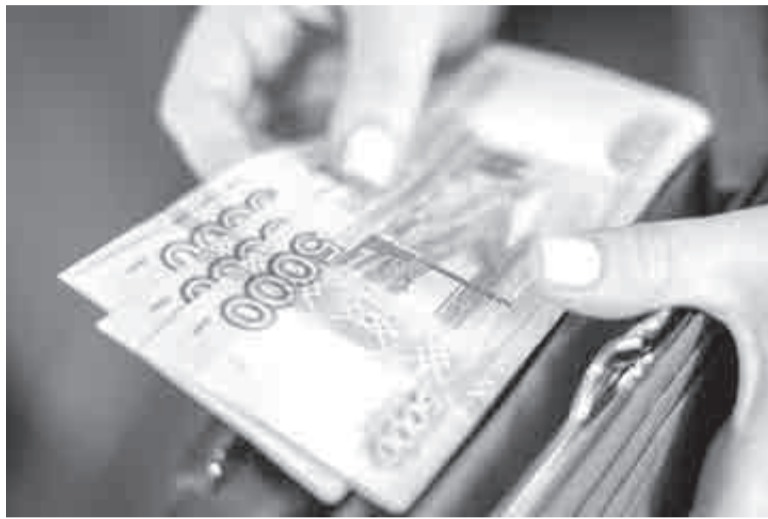
Состояние экономики влияет не только на кошельки, но и на общий настрой.