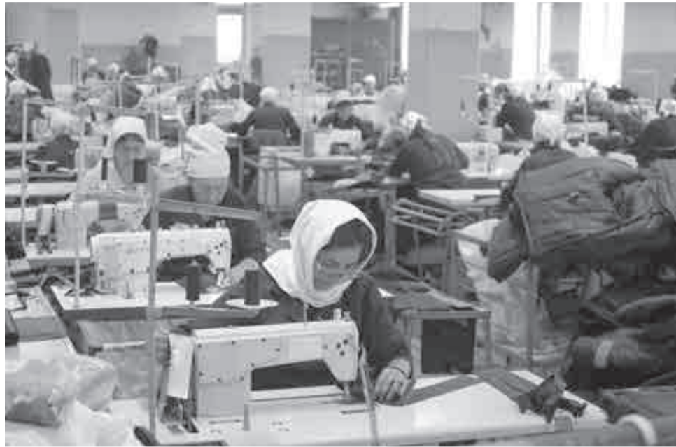
За долгие годы в колонии заключенные устают и от швейных машинок и от такой работы.