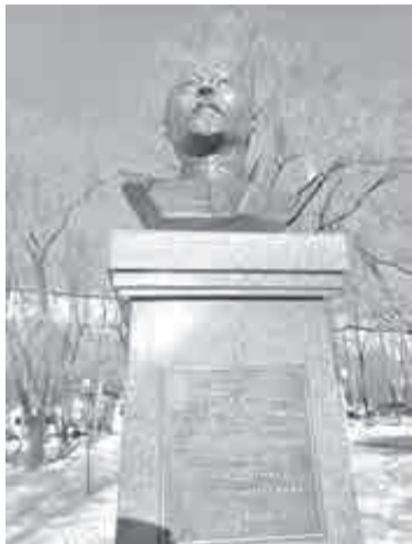
Стремление установить памятник создателю ВЧК в центре города объяснялось важностью «сохранить историческую память».

«Железного Феликса» увековечили в центре города