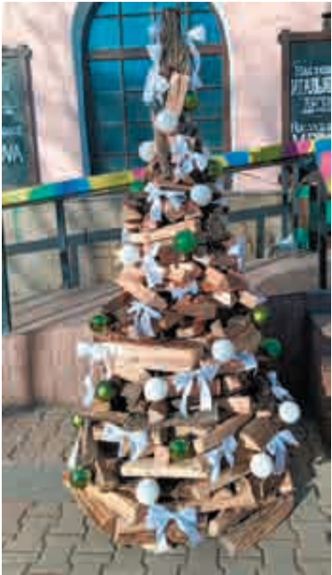
Елка на «дровах».

Хабаровск, как всегда, в преддверии новогоднего праздника заметно изменился. И хотя показалось, что казенные учреждения в этом году как-то скупы на яркость, однако коммерсантам отступать некуда, клиентов надо привлечь, впереди 11 дней каникул!