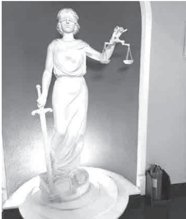
Говорят, Фемида должна быть беспристрастна. Однако статистика говорит о другом.

Оправдательных приговоров по-прежнему четверть процента