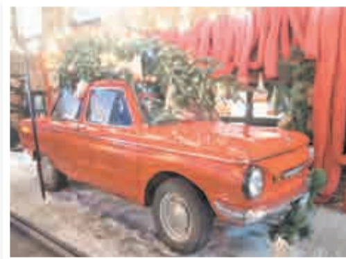
Авто – это вам не карета?

ваш надоел уже, а вот вечером – да, дорого-богато, на иллюминацию не поскупились.