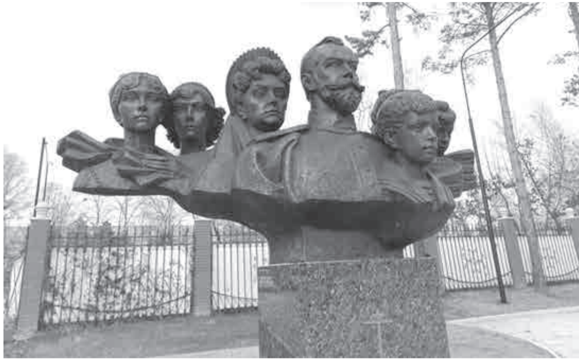
Любопытно, что в ноябре в Хабаровске с участием чиновников мэрии также открыли другой памятник — расстрелянной чекистами в 1918 году царской семье Романовых. Такой вот «плюрализм»!