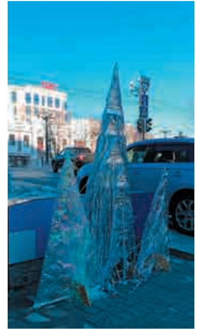
Дешево и очень сердито!

А в парке «Динамо» под партонажем мэрии, кроме городка с Гулливером, проходит уже 22-й