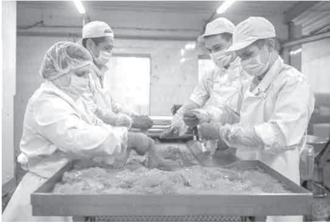
Рыбопромышленники считают, что икра и не может быть дешевой.

Дальневосточникам рекомендуют привыкать к новым ценам