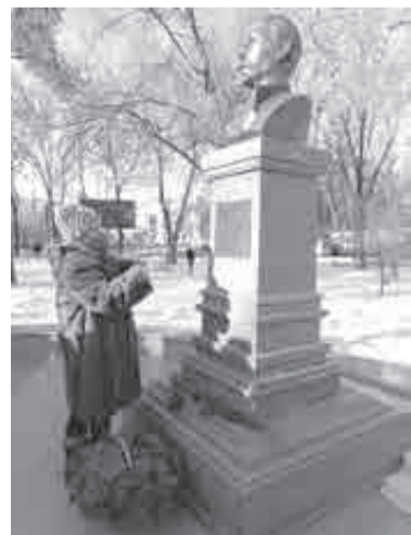
Цветы возложили скромно, но со вкусом.

Наконец, парни в шинелях вышли не зря — начал собираться актив ФСБ. Уже не молодые люди, одетые неприметно (в темное и серое), как, видимо, и полагается сотрудникам органов