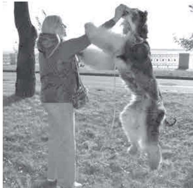
Вся жизнь с питомцами – больше для души, чем для заработка.

точно умалчивали о проблемах питомца. В анкете написано, что собака очень спокойная и добрая, а на месте тебя встречает агрессивный Бобик, который так и норовит вцепиться. И на месте нельзя уже отказаться от подопечного. За отказ – штраф и отключение от сервиса! Приходилось идти гулять, молясь, чтоб просто не загрызли. И никакой компенсации за это нет.