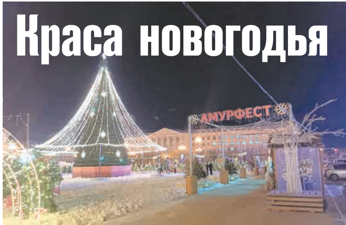
«Амурфест» скучен, а вот елка-«невеста» хороша?