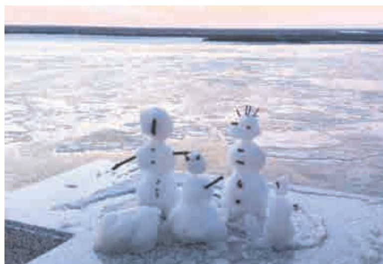
Снеговика на утесе.