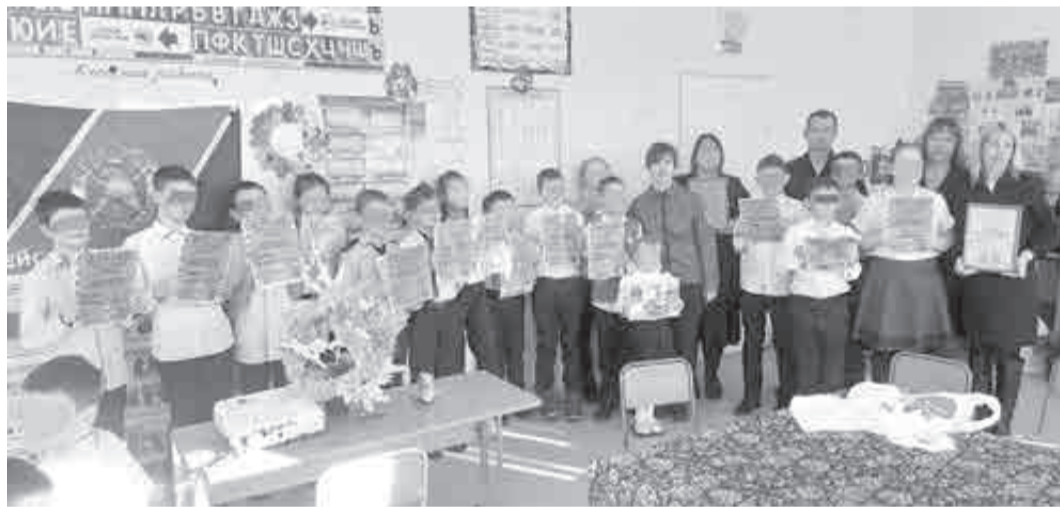
Юные участники акции в Дормидонтовке.

А в течение ноября во всех районах региона на базе школ и детских центров проходили различные спортивные, творческие, интеллектуальные, волонтерские мероприятия, направленные на приобретение детьми важных знаний