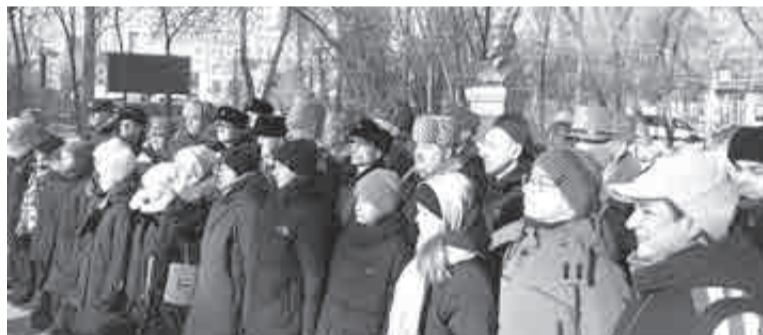
На фоне Феликса снимаются ветераны спецслужб и юные кадеты.

транспорт, ну, и, конечно, боролся с беспорядками. В этот день про эту заслугу Феликса говорили все.