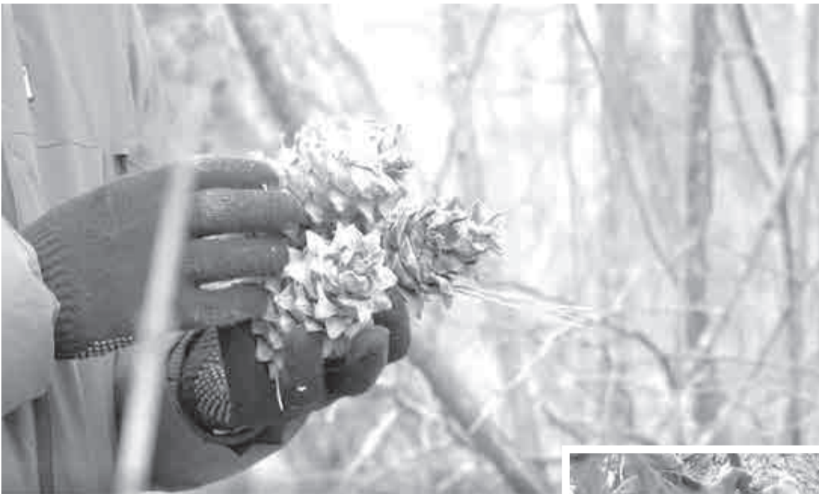
Где есть шишка, туда народ и тянется.

они становятся пропитанием для бурундуков, зайцев, кабанов, медведей. Ну и, конечно же, тигра, – проводит ликбез Виктор.