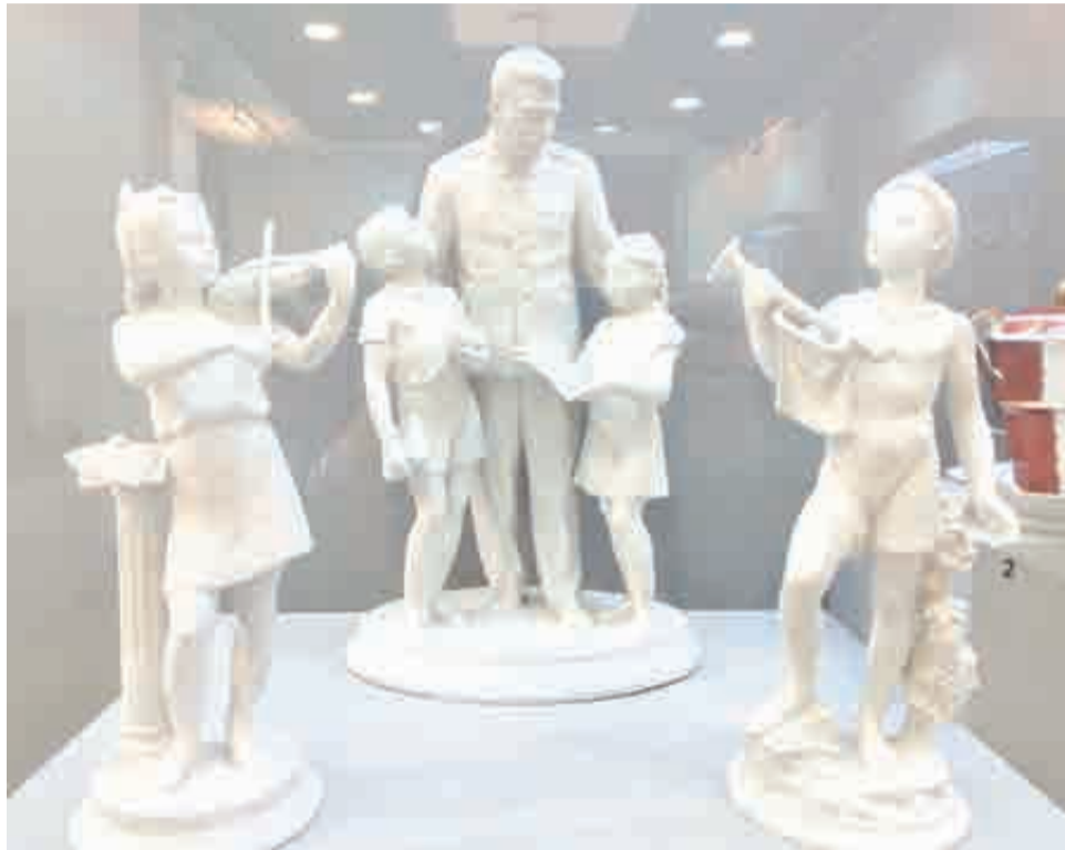
Вождь с детишками, ну, лепота же?