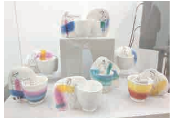
Пить – сложно, любоваться – можно.

Выставка «Фарфор и время» будет работать для посетителей до 31 января в выставочном зале № 4 на втором этаже.