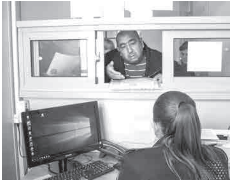
В проколах в нашей миграционной политике порой обвиняют лишь самих «понаехавших» или недобросовестный бизнес, указывают некоторые эксперты.

При этом нельзя не отметить, что и в Хабаровске, и в Приморье проекты постановлений поддержали большинством голосов.