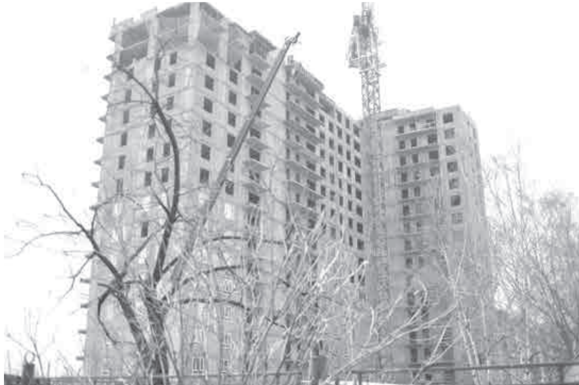
На этапе строительства в РФ находится рекордное количество многоквартирных домов.

«Риск банкротств застройщиков исключить нельзя. Но говорить о возможных массовых банкротствах я бы не стал. Согласно отчетам публичных девелоперских компаний, чьи акции торгуются на бирже, за минувшие годы их чистая прибыль выросла в разы. У застройщиков есть запас прочности, подушка безопасности, и это видно на цифрах. Скорее всего, теперь им просто придется адаптироваться к более низкой маржинальности и оптимизировать расходы».