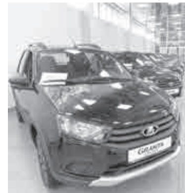
20 авто марки «Лада» получили хабаровские медики в декабре.

семи авто в медорганизации Комсомольска-на-Амуре.