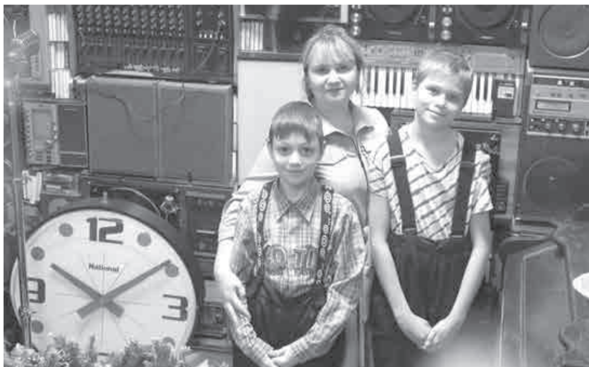
Музыкальный музей порадовал многих.

Новую турпрограмму разработали в регионе