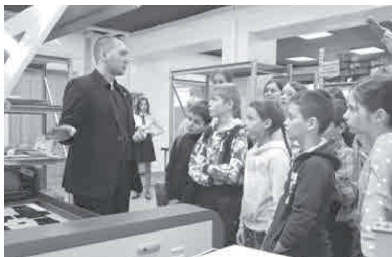
В вузе экскурсанты приобщились к науке.

Старт проекта семейного отдыха в крае приурочен к «Году семьи», завершившемуся в России, а также направлен на поддержку нового нацпроекта «Семья», реализация которого начнется в 2025 году.