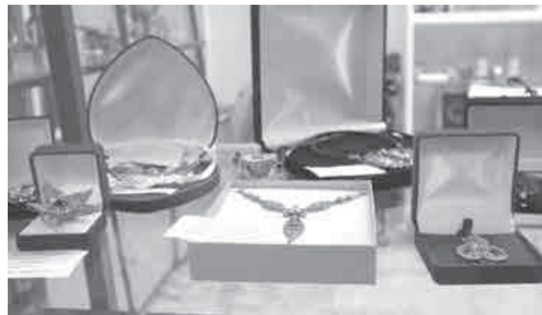
В музее кафедры художественной обработки металла оказалось неожиданно прекрасно.

Во время телемарафона «Большая семья – большое сердце» многодетные родители рассказали о мерах поддержки правительства и показали заранее снятые ролики о своем быте. В рамках проекта также выпущены листовки с историями больших семей Хабаровска и запущен чат-бот для общения с ними.