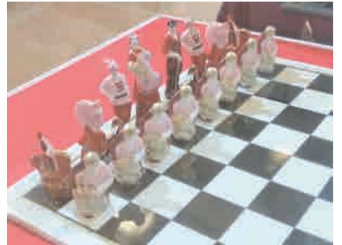
Шах и мат – белой гвардии!

Еще одна витрина – сталинский ампир 30-40-х годов. Здесь расположилась скульптурная композиция под известным лозунгом: «Спасибо за наше счастливое детство». К ней относится еще одна работа Данько