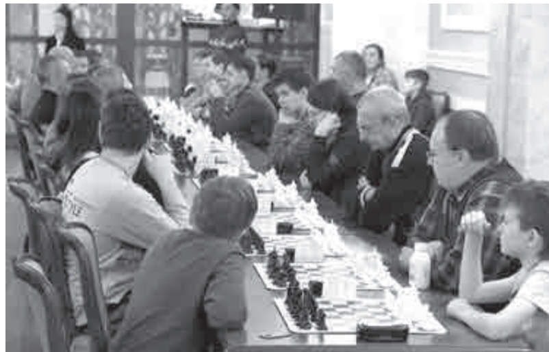
На турнире играли люди самых разных возрастов и уровня игры.