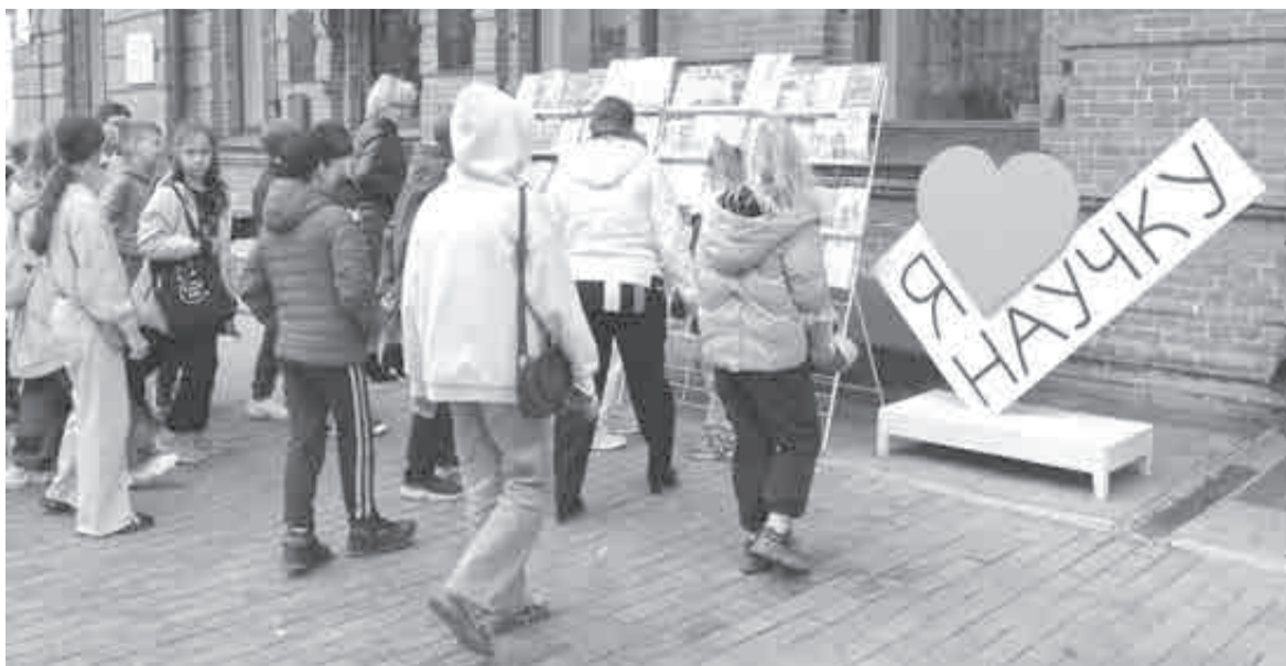
Здесь проводят разные акции, в том числе для юных читателей.

– За годы работы библиотечный фонд увеличен колоссально – на сегодня коллекция включает