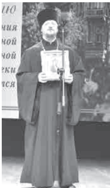
Подарки «науке» в духе времени.

История библиотеки началась в конце XIX века, когда приамурский генерал-губернатор Сергей Духовской начал хлопотать об открытии в крае Приамурского отдела Императорского русского географического общества.