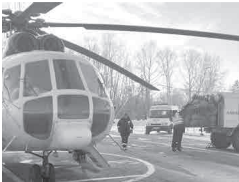
По возвращении воздушного транспорта врачи доставляют пациента на носилках с борта в автотранспорт и перевозят в медучреждение.

У скорой помощи в крае есть колеса, крылья и винты