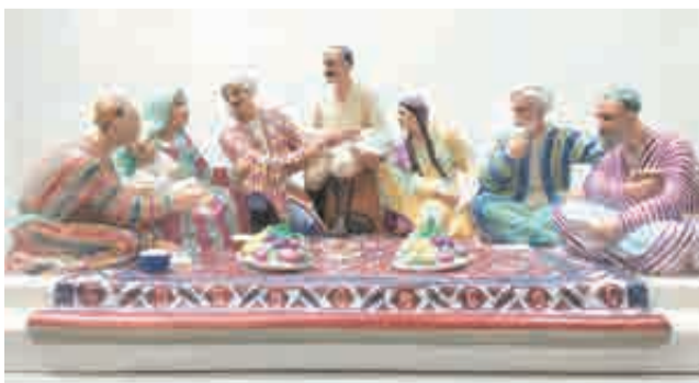
Сталинскую Конституцию в 1936 году тоже принимали единодушно.