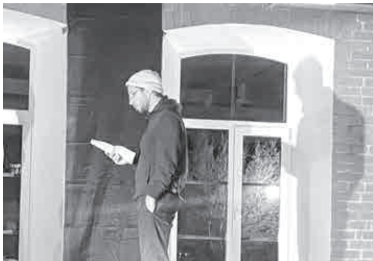
Он и сам не знал, зачем забрался сюда.

Сергеевна стояла в тонком свитере и тяжело дышала от ужаса. Что делать теперь? В руках – лишь фонарик, телефон забыла схватить. И как сообщить теперь о происшествии на вверенном ей под охрану объекте?