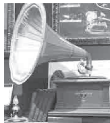
А вы еще не бывали в «Музее говорящих машин»?

«В числе партнеров проекта семейного отдыха мы бы хотели видеть вузы и средние профессиональные учебные заведения края, вместе с ними планируем разработать несколько маршрутов».