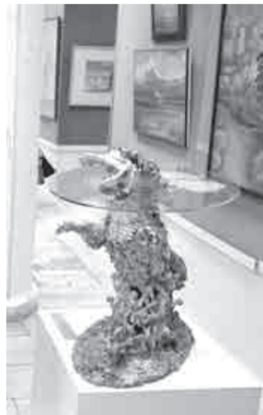
Она еще раз критически посмотрела на экспонаты современного искусства и вернулась к рабочему месту.

Крик звучал странно. В это время на улице спящего города она, похоже, совсем одна. Закрыты кафешки и магазины – соседи художественной галереи. Ни в одном окне не горит свет, даже на дороге пусто. Настал тот час, когда ночь полностью владеет миром.