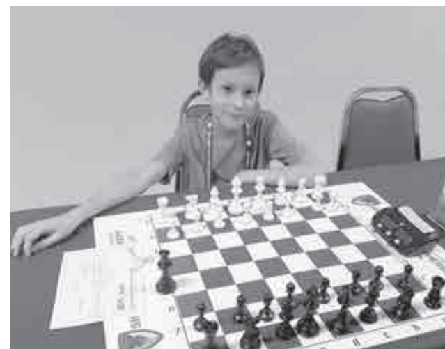
Юный чемпион.