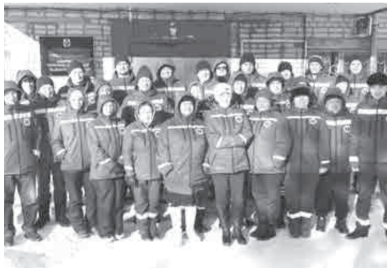
Коллектив центра медицины катастроф делает важнейшую работу.

фарктами, травмами различной сложности, а еще беременные, а также нуждающиеся в хирургической помощи из отдаленных поселков и райцентров. Произведено 10 вылетов санитарной авиации в самые разные районы края. Оказывается и дистанционная помощь с помощью телефонных консультаций и видеоконференций.