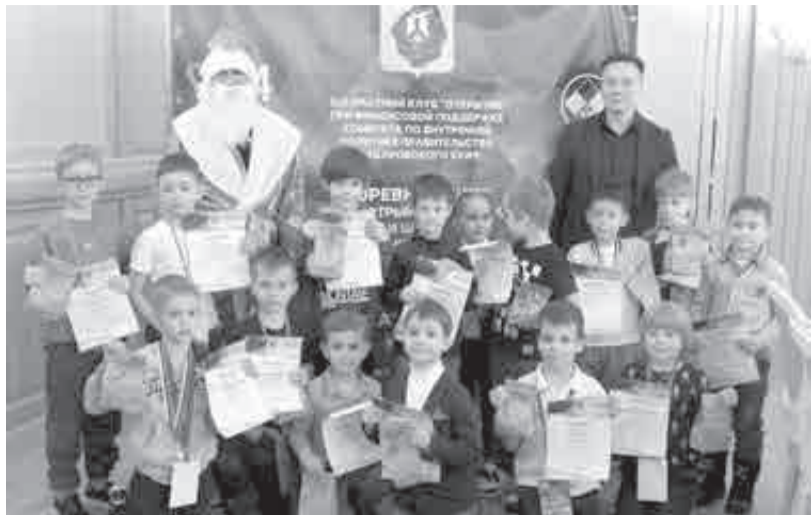
Дедушка поздравил всех участников.

– Мы рады, что свои выходные дни вы посвящаете такой древней игре как шахматы. Я желаю: пусть победит сильнейший. И