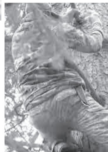
Основной урожай шишек – там, наверху.

Но это все для личного потребления, а вот промышленникам приходится решать вопрос на месте, особенно если заготовка идет глубоко в тайге. Там, кстати, меньше шансов, что застанет