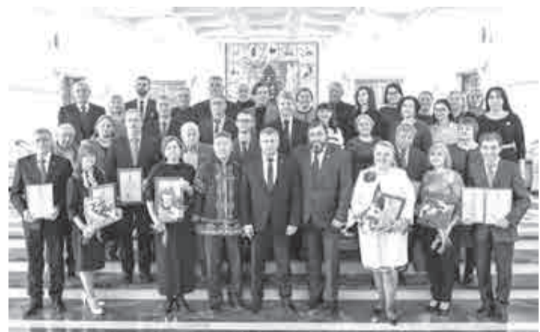
Новые лауреаты, фото на память.

За серию произведений «Сэвэны» в номинации «Народное художественное творчество» награжден заслуженный