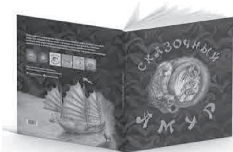
Так выглядит новая книга.