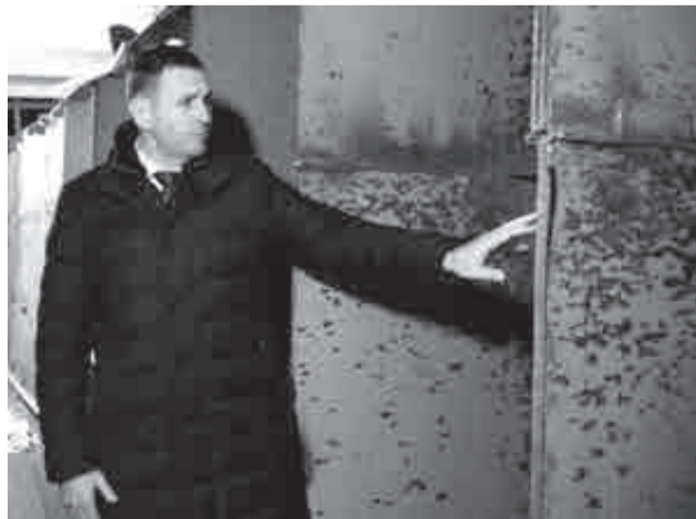
Губернатор в запущенном тире.