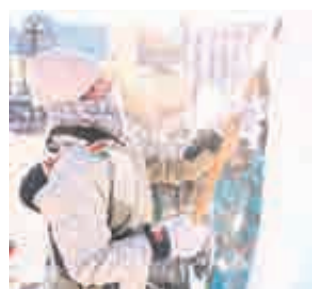
Со льдом работать непросто!