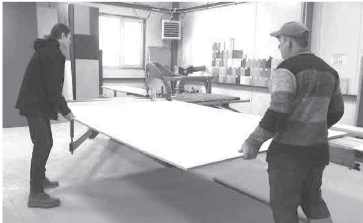
Без поддержки бизнесу было бы совсем непросто.

В пандемию, говорит Темнов, производство резко выросло в объемах. Возможно, это связа-