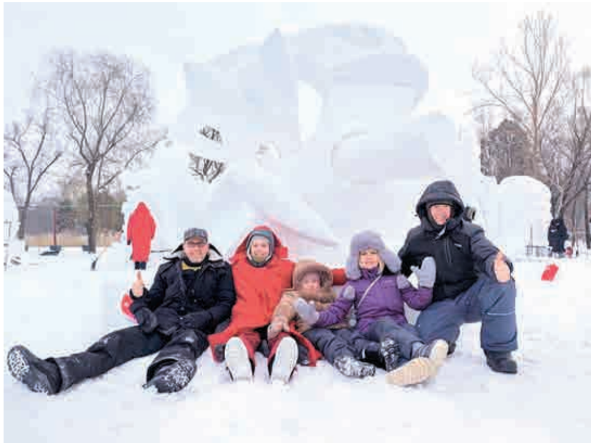
Авторское прочтение символа «Инь и Янь» принесло команде российских художников победу в Харбине.

«Чистая абстракция, но всем всё понятно»