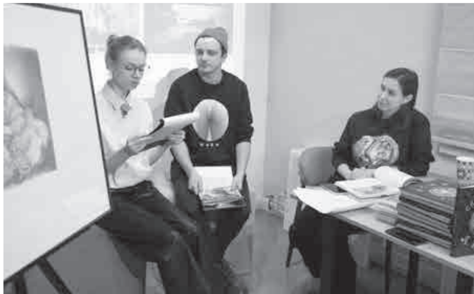
Артисты ТЮЗа так прочитали сказки, что писательница (справа на фото) призналась, что теперь мечтает о спектакле по книге.