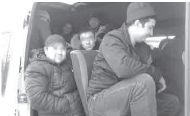
Полиции по закону дано право выдворять нелегальных приезжих без обращения в суд.

Прежняя процедура, когда депортация могла назначаться судьей или должностными лицами погранслужбы, была довольно сложная и затянутая. Теперь ее решили значительно упростить, из-за чего правозащитники уже и