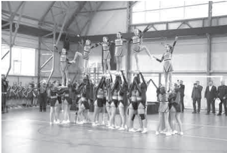
В новом модульном зале можно заниматься самыми разными видами спорта.

– И она может и должна использоваться для подготовки не только спорта высоких достижений, наших сборных команд, но и в первую очередь – для подготовки будущих бойцов, тех, кто хочет приобщиться к этому виду спорта, для наших детей! И этот объект может спокойно сам себя окупать при должной организации работы, –