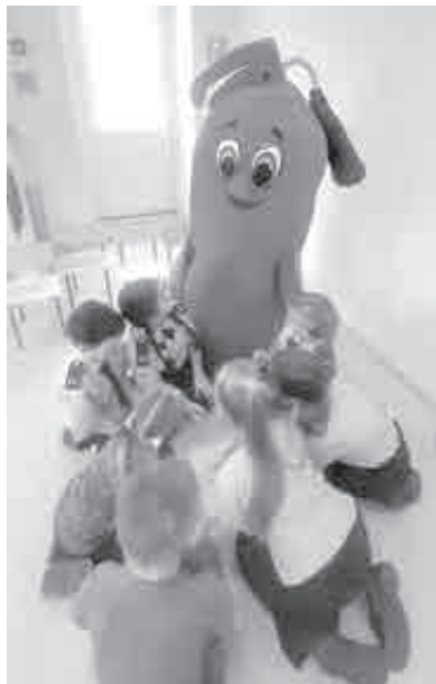
Дети были в восторге от встречи с таким персонажем.

При любой чрезвычайной ситуации звоните «112».