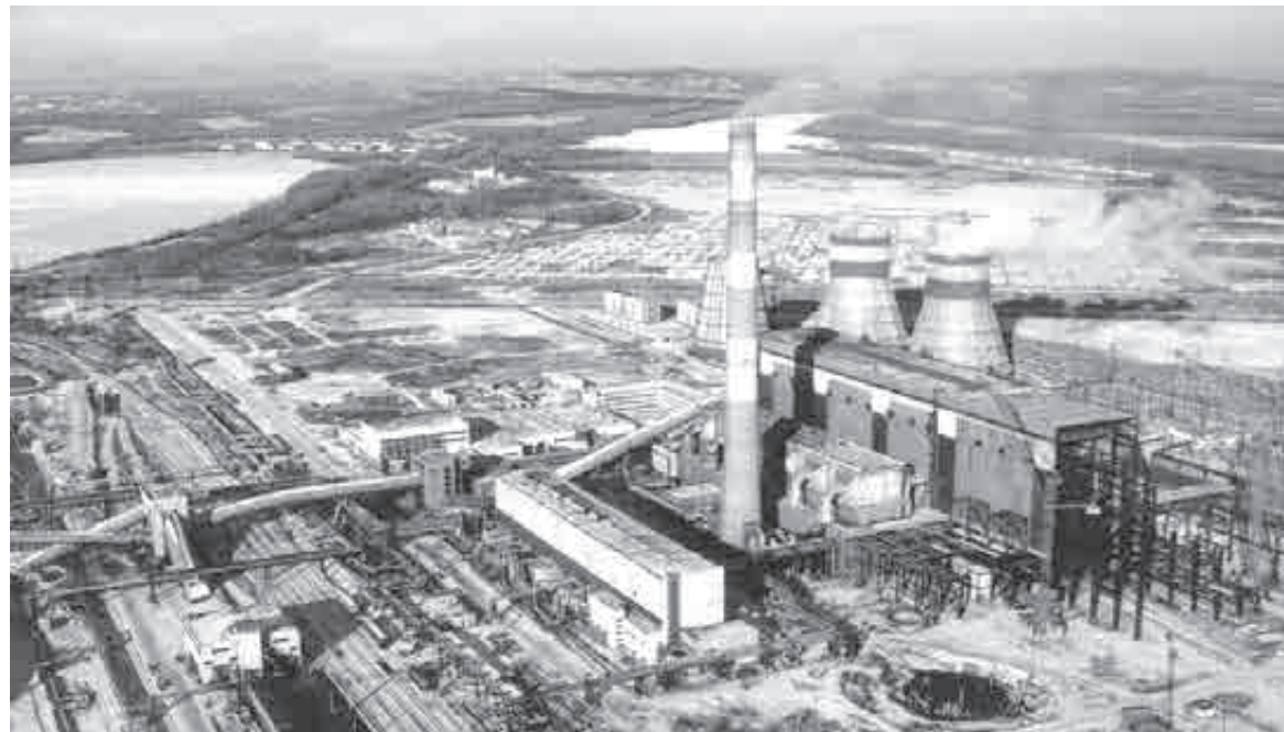
Февраль еще в полном разгаре, энергетикам пока рано расслабляться...

Ремонт энергообъектов в крае продолжается