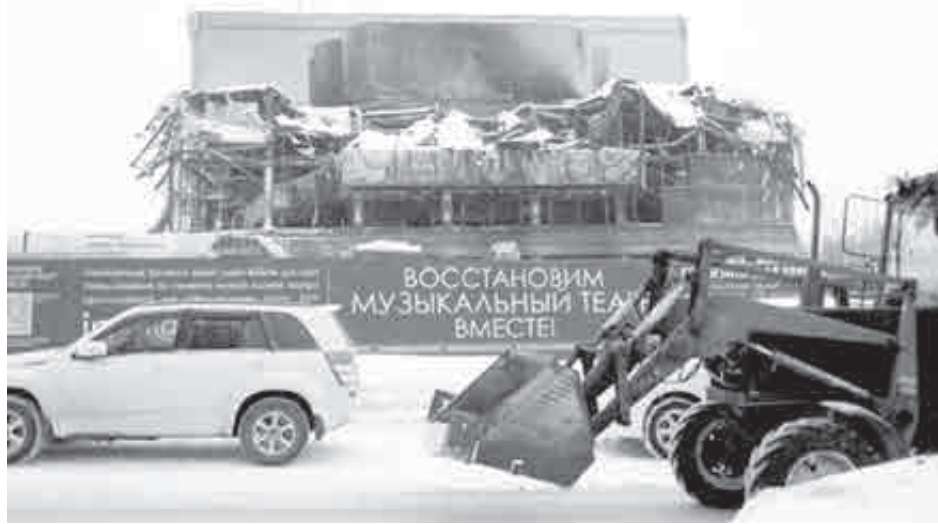
Барельефы восстановят и установят в виде композиции рядом с бывшим театром. А вот что будет на его месте – пока непонятно.

проекта театра, ведь представленные на суд людей эскизы вызвали много вопросов.