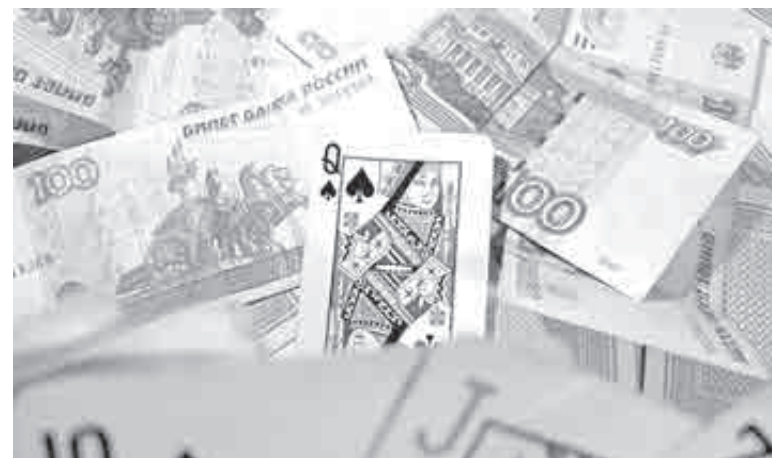
«Вышла на биржу», мечтала, что «выйдет в дамки», но заигралась все-рьез...

– Еленочка Владимировна, надо действовать быстро – мы можем поднять два миллиона!