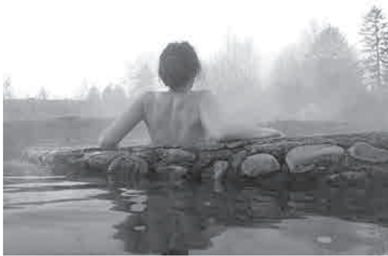
«Утром здесь – тишина, вокруг никого, а ты лежишь в теплой воде, и не хочется тебе уезжать ни в какой Хабаровск!»

А про водоросли скажу: приезжали как-то на источники дамочки, из Кореи вроде... Как увидели эти зеленые наросты – щетками соскребли все, чторосло в бассейнах, намазали на себя, взяли с собой. Сильные, видать, микроорганизмы, если в такой концентрации кремния и фтора, да еще и при высокой температуре, растут! – уверен он.