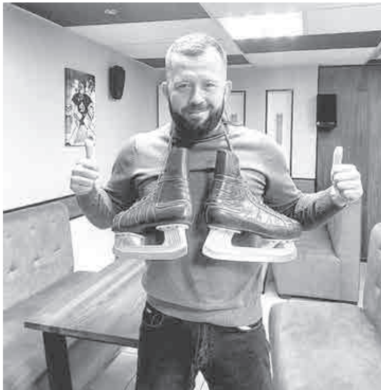
Не время вешать коньки на гвоздь!