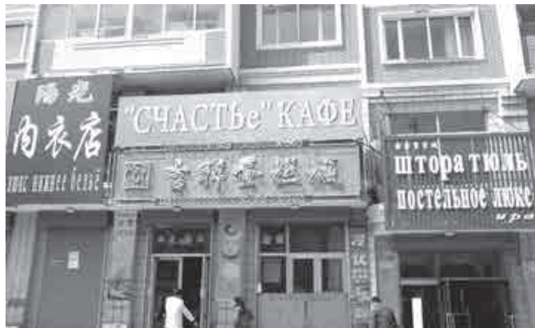
И все же пока в жителях России больше видят потенциальных туристов и клиентов, чем коллег. Конкуренция за рабочие места в Китае очень высока...

Согласно данным Росстата на начало года, за январь-ноябрь 2024-го общий турпоток в Хабаровский край превысил 1 млн 253 тыс. поездок: это на 64,6 тыс. больше, чем за 11 месяцев 2023 года. А недавно в Минтуризма региона сообщили, что в 2024 году в край въехало порядка 30,4 тыс. гостей из КНР – это 3,5 раза больше, чем годом ранее. При этом, как передавал «Интерфакс», по данным генконсула КНР в Хабаровске, в 2024-м генконсульство выдало почти 30 тысяч виз россиянам, что на 36% больше, чем в 2023 году. Сейчас в консульстве организовано два «окна»: одно – для физлиц, другое – для представителей турфирм. Тариф за оформление снижен с 3,3 тыс. до 2,5 тыс. руб., увеличено число дней приема, сообщили в Минтуризма края.