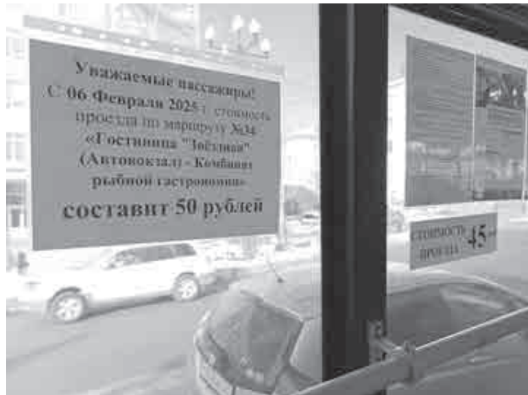
Граждане уже даже особо не возмущаются. Видимо, внимательно следят за новостями?

За всё заплатят пассажиры и перевозчики?