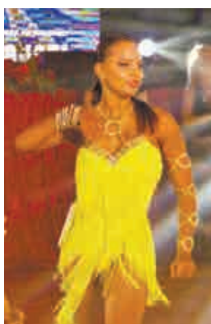
В лучах софитов.

– Я очень рада, что наше танцевальное направление, соло латина, растет и развивается такими темпами. Сегодня в течение