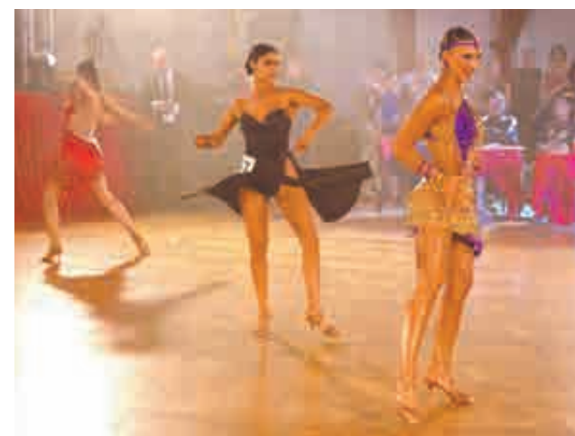
Каждый номер здесь уникальный, ведь конкурсантки должны импровизировать. Услышав музыку, они мгновенно подбирают свои отработанные движения к нужному стилю танца.

Завороженные зрители с трудом очнулись после выступления. Оттанцева-