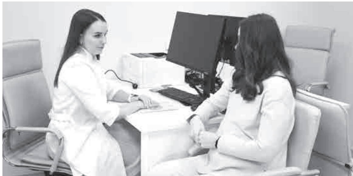
В новой клинике уже идут приемы.