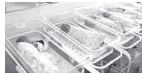
Новая техника позволит спасти больше жизней...

– С помощью нового оборудования мы в динамике можем наблюдать за ростом эмбриона. Ранее эмбриологи следили за развитием клеток в статике, и когда несколько эмбрионов достигали одинаковой стадии развития, это приводило специалистов к непростоному выбору. Сейчас, когда есть возможность просмотреть запись развития эмбриона за несколько секунд, сразу наступает понимание, у какого лучше потенциал для того, чтобы наступила