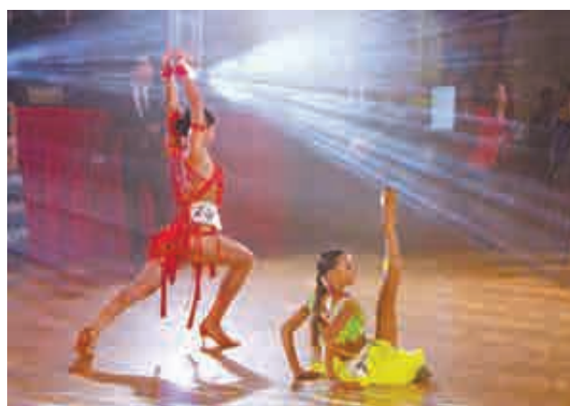
Пасодобль подобен корриде. Вот только бычков нигде не видно...

«Соло латина» – латиноамериканская программа спортивных бальных танцев (ча-ча-ча, самба, джайв, румба, пасодобль), адаптированная под сольное исполнение, то есть без танцевального партнера. Среди целей «Кубка Балхауса» – формирование культуры подрастающего поколения Дальнего Востока, популяризация и развитие «соло латины», пропаганда здорового образа жизни, эстетическое воспитание населения, поддержка талантливой молодежи.