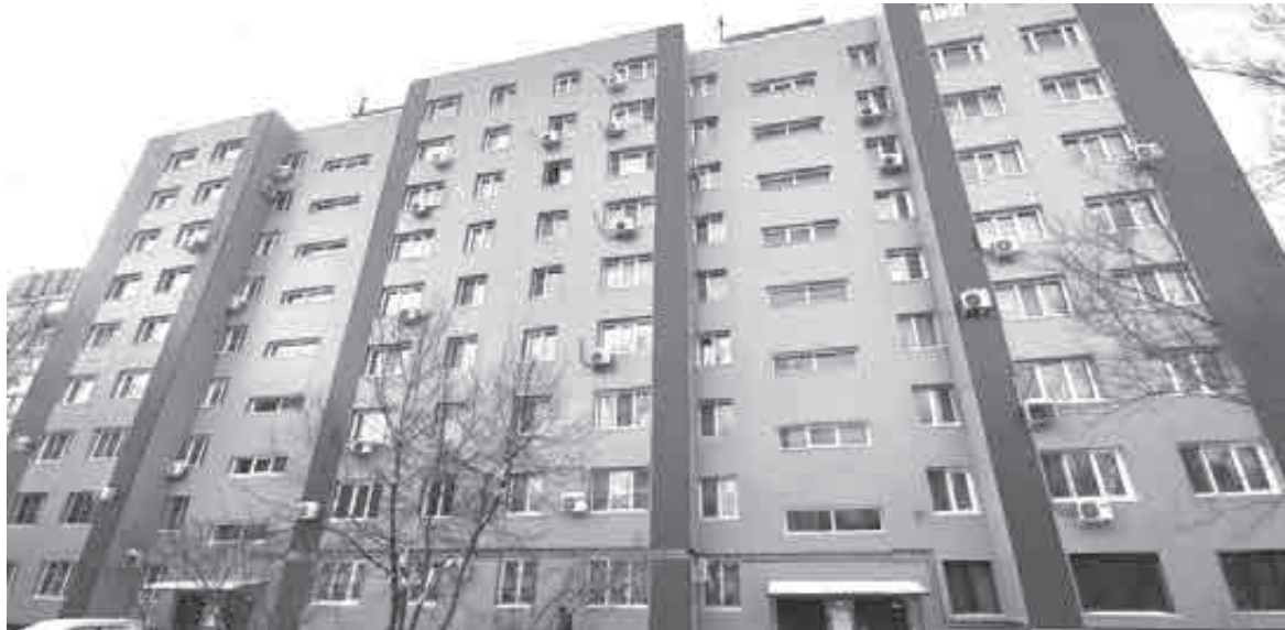
Люди готовы на многое, чтобы решить злободневный квартирный вопрос.

Между тем, в крае в этом году на улучшение жилищных условий