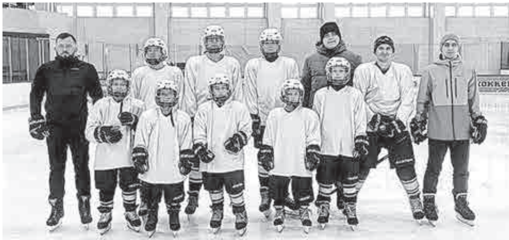
Мы в ответе за тех, кого тренируем?

Мария Минчева