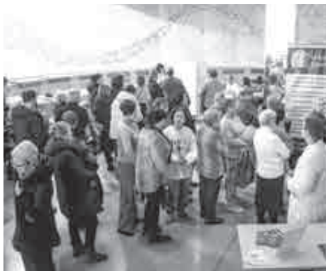
Люди и сами прекрасно понимают, что рак можно и нужно выявить заранее.

Так, врачи краевого кожно-венерологического диспансера проверили 219 человек на предраковые заболевания кожи на открытых участках тела: у 25 обнаружены изменения, их направили на дополнительное обследование. Специалистами краевого онкоцентра проводились УЗИ-исследования щитовидной железы: осмотрено 29 посетителей, у одного есть подозрения на рак – он оперативно направлен к онкологу. У четверых обнаружены узлы щитовидной