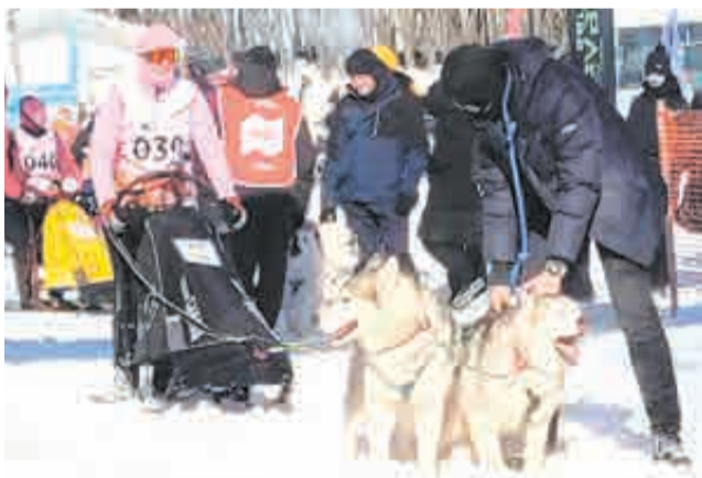
На старте было тяжело сдерживать четвероногих участников.

В ходе «Амурской метели» также прошла традиционная акция помощи бездомным животным «Собака-обнимка» (0+), где каждый мог сделать фото с животными и внести посильный вклад. Как сообщили в правительстве края, поддержка направлена общественным организациями «Милосердие», «ХелпХаски» и «Добрый дом». Помощь принималась в виде денег, медикаментов, кормов, пеленок и ветоши.