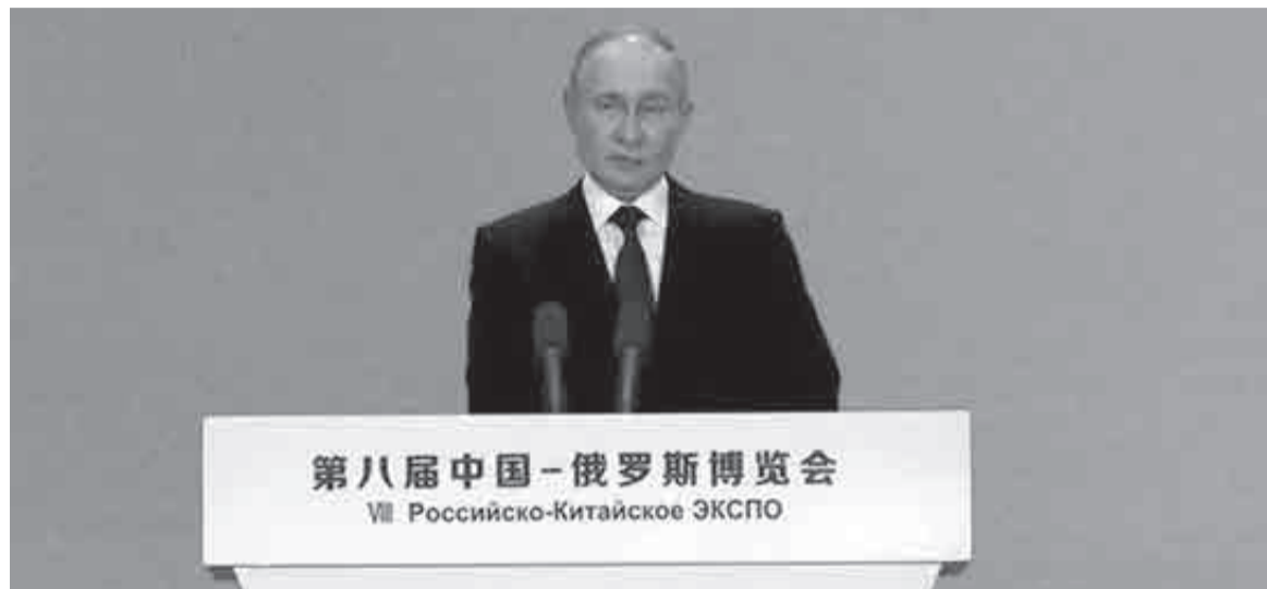
В прошлом мае Владимир Владимирович гостил на большом форуме в Китае. Возможно, этой весной уже высокие китайские гости пожалуют на большой форум в Хабаровске?

Уже известно, что ключевыми темами хабаровского форума станут: совместное освоение острова Большой Уссурийский, расширение экономического и инвестиционного сотрудничества, налаживание прямого диалога между предпринимателями двух