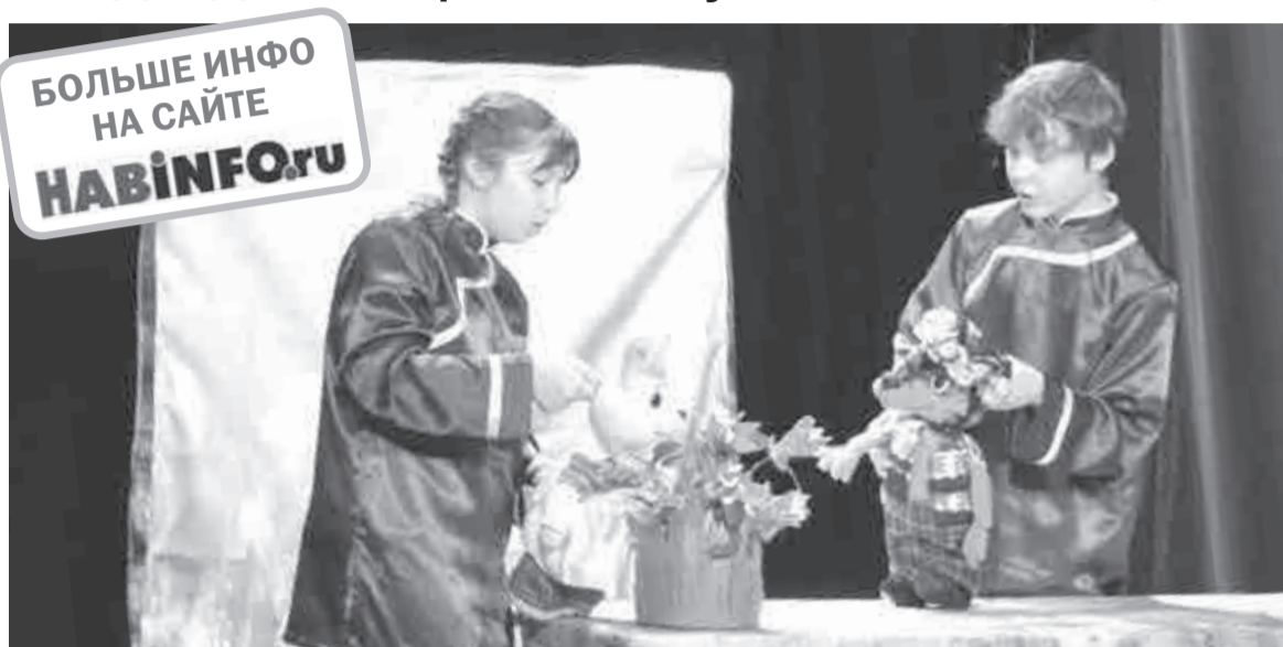
Юные артисты на сцене действуют вместе с куклами.

А вот коллектив из Бурятии «Вытворяшки» – артисты опытные, они уже трижды участвовали в конкурсе «Первые шаги», в прошлом году взяли Гран-при отборочного тура и получили путевку в Москву. Именно им выпало открывать нынешнюю программу. Ребята показали постановку «Сказки для Алёнки» (12+).