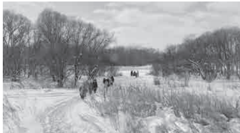
Паломники на пути к речке.