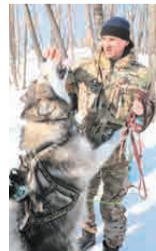
Кушай, друг!

– Наконец-то мы снова вернули этапы Кубка России (0+) на наш Дальний Восток, – говорит она. – Это такие гонки, где че-