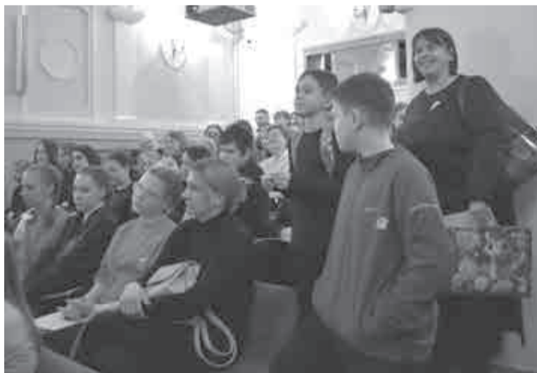
Участники фестиваля из зала наблюдают за выступлением других конкурсантов.