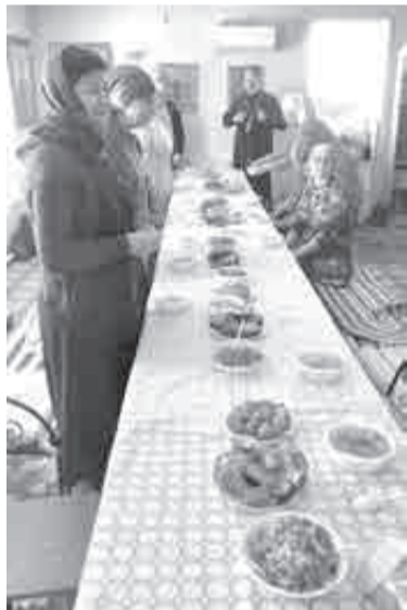
Стол для паломников.

стого свежего снега. И тут же застреваем возле ветшающей лачуги, ворота которой украшают странного вида лики. За нашими попытками выползти из снега равнодушно наблюдает местный мужичок и более эмоционально – собачья стая. Эти к чужакам нетерпимы. Облаяли от души и отбыли по своим песьим делам.