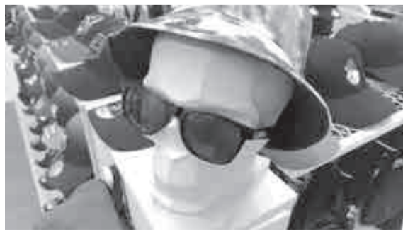
Мечтать об отпуске никогда не рано!