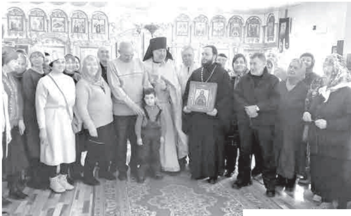
Фото на память в местном храме.

«Нельзя, чтобы люди забывали, что происходило»