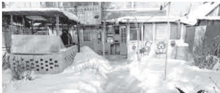
Многие плюсы выбранной дачи видны зимой и летом. А вот с минусами сложнее...

на продажу в районе Матвеевского шоссе – аэропорта «Хабаровск Новый». Средний ценник на участки в этом районе – от 600 тысяч до трех миллионов рублей.