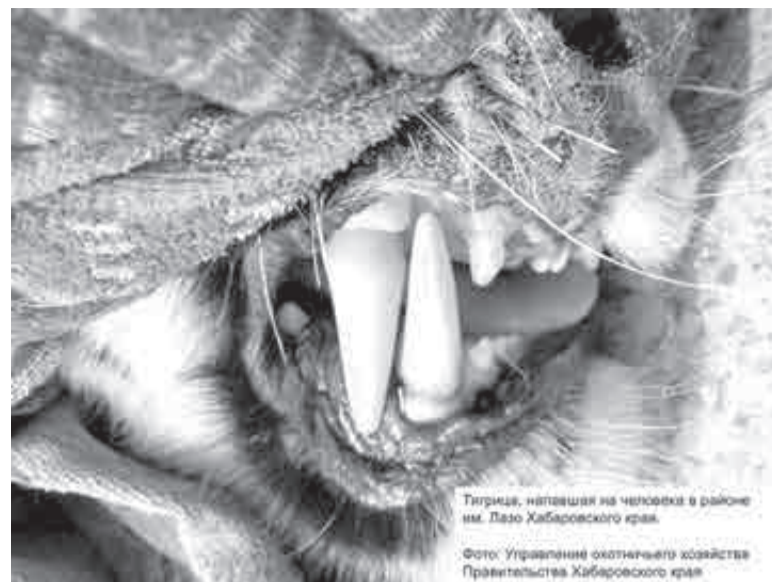
Тигрица, напавшая на человека в районе им. Лазо Хабаровского края.

– В прошлом году наш институт вошел в систему госцентров секвенирования (один из методов выявления причин наследственных патологий – Прим. «ХЭ») для обеспечения мониторинга циркуляции патогенных микроорганизмов в рамках программы «Санитарной щит России». Самое главное, что у нас появилось оборудование для секвенирования – в том числе полноразмерного генома человека. Секвенировать геном тигров было бы очень интересно. Мы готовы включиться, не скажу, что в революционную, но в смелую программу по секвенированию сначала митохондриального, а затем и полного генома всех особей тигров, которые обитают на территории Дальнего Востока. Что касается ветеринарного, микробиологического сопровождения программы контроля среды обитания тигра, то мы работаем с рядом ветеринарных клиник Владивостока по болезням кошачьих и готовы за внебюджетный счет включить в свои исследования образцы амурских тигров, если на то будет политическая воля, – резюмировал он.