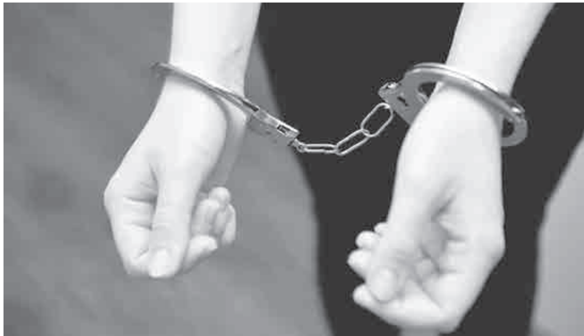
Женская дружба закончилась плохо. Почему так?

Ленке так стало себя жаль, что она расплакалась и немного даже повыла о своей бабьей доле. Беда! – Ну, подруженька, я этого так не оставлю! – Ленка погрозила кулаком в сторону стенки, за которой мирно спали изменщицы. Кинулась на балкон, достала из ящика баллончик с белой краской и выскочила в подъезд. Не сразу, но удалось вывести баллончиком обидное слово на двери соседки. Пусть все знают, что тут