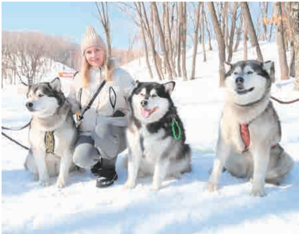
Вот это красавцы!

Медали разыграли в четырех дисциплинах: там, где каюр бежит за собакой на лыжах, а также где едет на нартах, а в упряжке у него – от двух до шести псов. Всего же, как сообщили в Минспорта края, здесь было более 70 спортсменов и 140 собак.