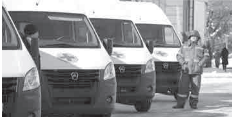
14 машин останутся в Хабаровске.

17 машин «скорой помощи» купили для края