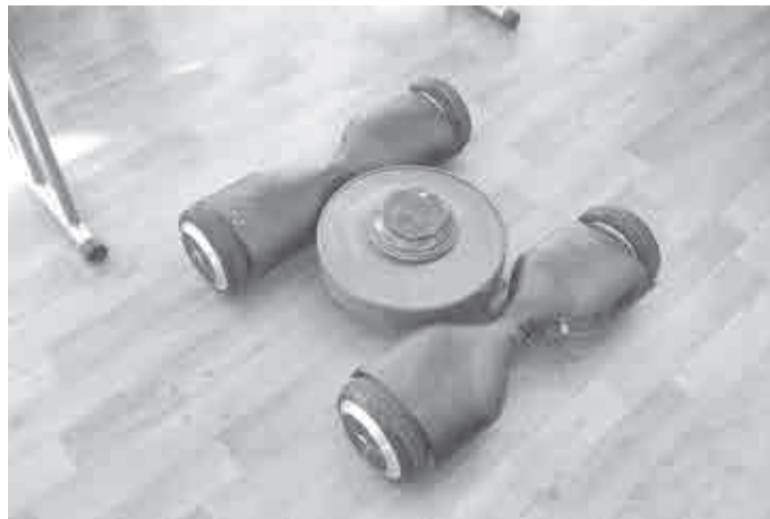
Мина на гироскутерах.

«Техника – это возможность прикоснуться к современной истории. Действительно понять, что идет война, идут боевые действия!» – цитирует пресс-служба правительства края сказанные на открытии форума слова Романа Грекова, замкомандующего войсками ВВО по военно-политической работе.