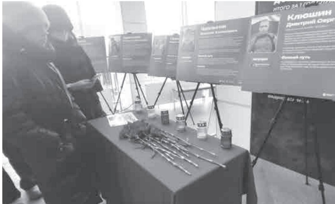
Цветы и свечи для убитых.