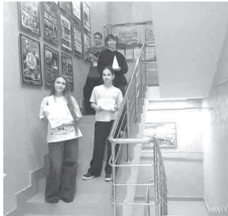
Учащиеся одной из отремонтированных в прошлом году художественных школ.

Острый вопрос не только для нашего края – нехватка кадров в сфере культуры. Так, в детских школах искусств региона сейчас имеется более 50 вакансий педагогов и концертмейстеров, большинство из них – в отдаленных районах. Для решения этой проблемы министерство культуры края ведет работу со студентами, участвует в программе «Сбере-