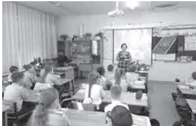
В школах тоже проходят познавательные лекции сотрудников центра.

Помимо выездных мероприятий наш замечательный центр проводит экскурсии по открывшимся залам центра. Ребятам показывают и рассказывают об истории, демонстрируют пожарную и спасательную технику, инвентарь и боевую одежду. Важная часть рассказа – как не допустить пожар и как вести себя при пожаре. Детвора с