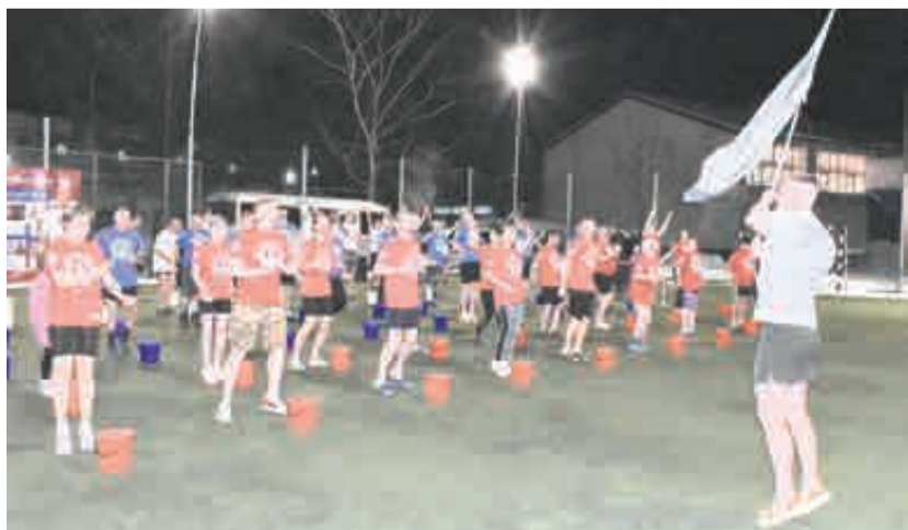
Разминка с флагом.