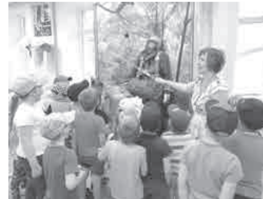
Познавательная экскурсия для юных.

интересом слушает и изучает макеты, ребят знакомят с благородной и отважной профессией пожарного.