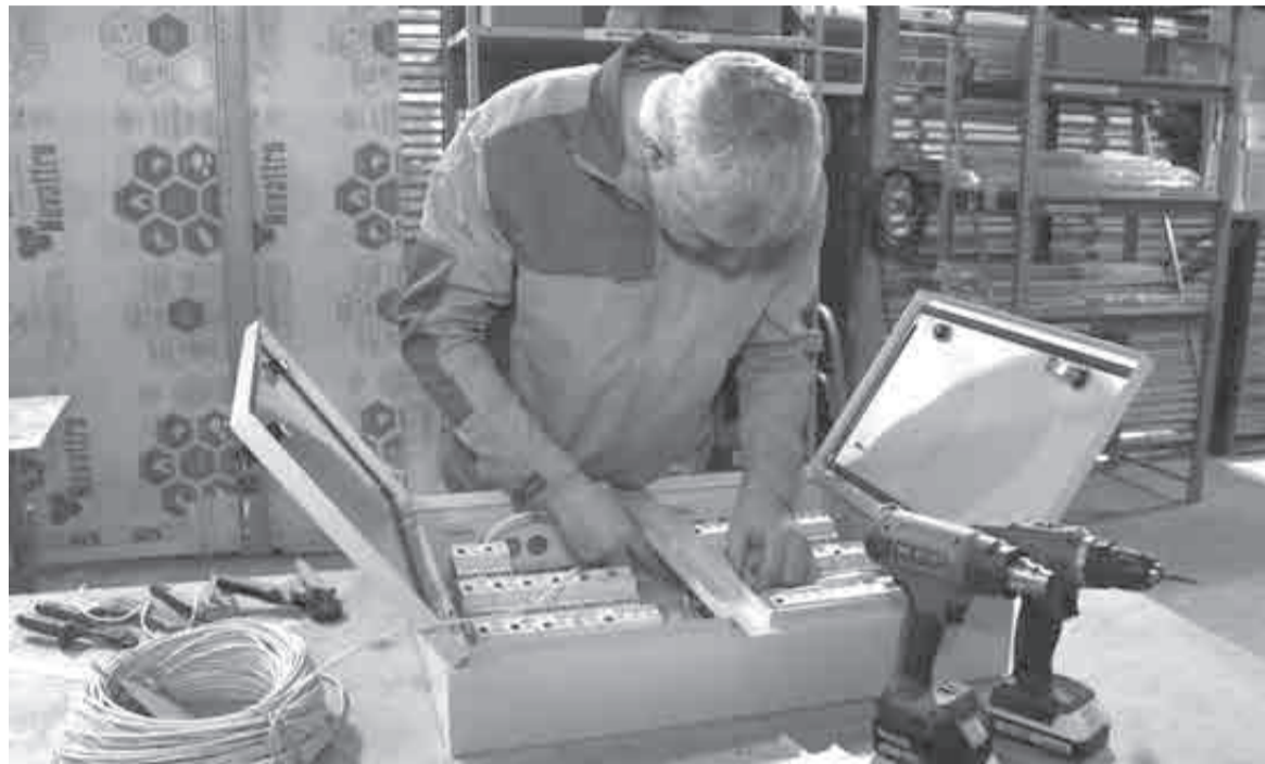
Уже 45 компаний стали участниками нацпроекта в крае.

Как улучшают эффективность на предприятиях края