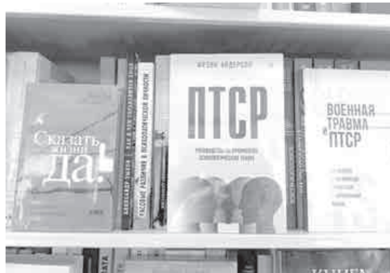
В книжных магазинах отделы «Психология» с книгами 18+ нынче одни из важнейших.

Происходят обычные и безопасные вегетативные изменения. Но живот поурчит и перестанет, ладонки высохнут, сердце успокоится — и все будет хорошо. Точнее, все уже хорошо: раз человек обращает внимание на