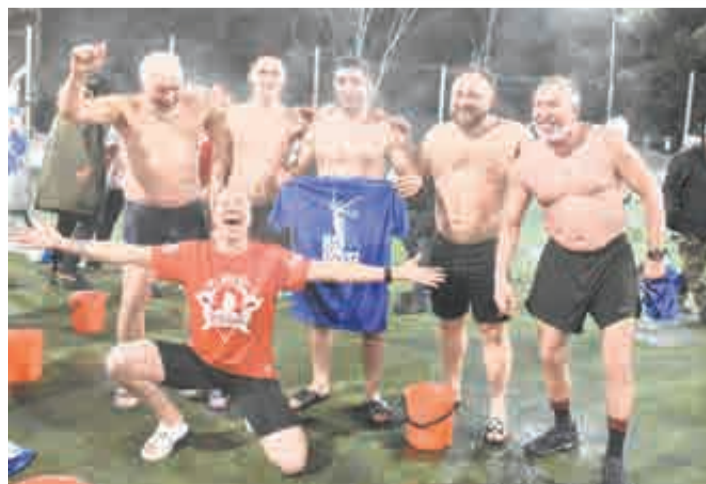
Горячие эмоции, холодная вода...