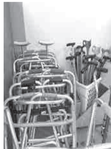
В прошлом году услугой проката средств реабилитации воспользовались более 1600 человек.

реабилитации. Так, в прошлом году медицинскую помощь в шести краевых медорганизациях получили более 2500 участников СВО и членов их семей.