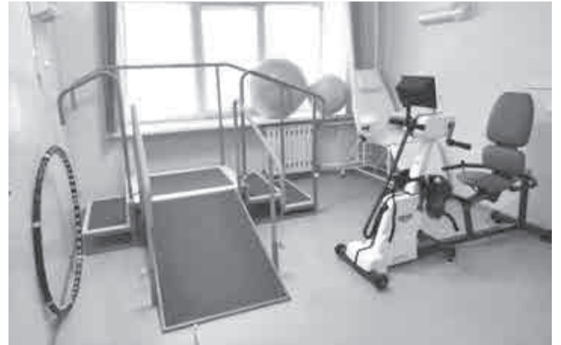
Средства реабилитации бывают разные.

Как дополнили в Минздраве региона, в медучреждениях помощь в реабилитации участников спецоперации будет только увеличиваться. Для этого за три года – с 2025 по 2027 годы – выделят более 106 млн рублей учреждениям здравоохранения: на оснащение медизделиями, увеличение коечного фонда и объемов по амбулаторной медицинской