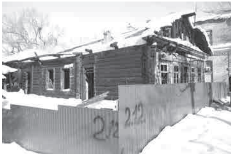
На месте сгоревшего доходного дома на улице Дьяченко губернатор предложил построить культурный или социальный объект.

Между тем, как доложил на заседании министр культуры края Дмитрий Кузнецов, система образования в области искусства в регионе состоит из 40 муниципальных детских