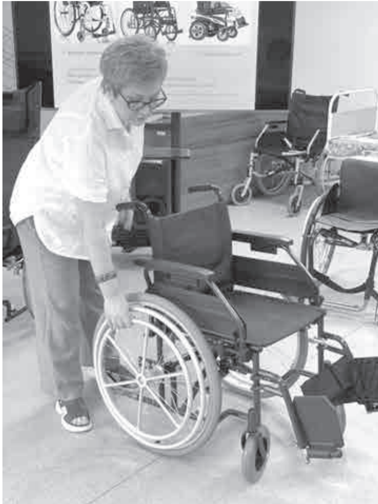
Наиболее востребованы у граждан ходунки и костыли, трости и кресла-коляски...

Активная жизнь и реабилитация для инвалидов края возможна