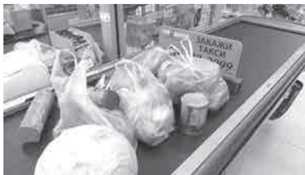
Покупки лучше совершать по заранее составленному списку.

Клубные карты или программы лояльности есть практически у каждой крупной сети. Так покупателям предлагают некий «особый статус» и некое материальное поощрение