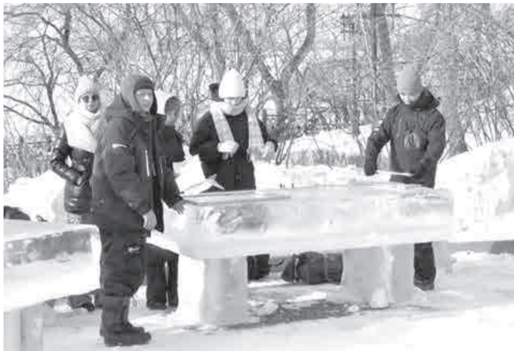
Кипит работа на морозе!

фестиваль снежных фигур (0+), а тут другой материал.