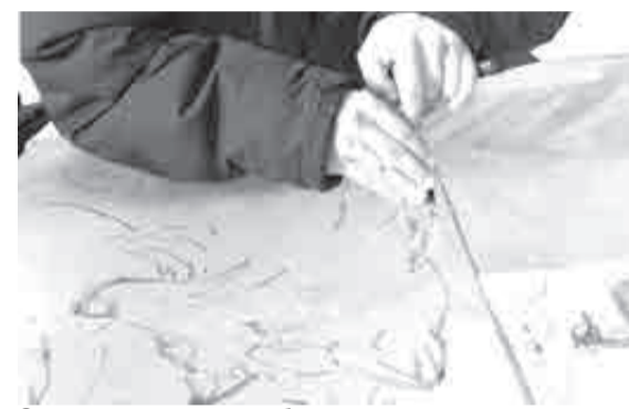
Самая тонкая часть работы – вырезаем рисунок на льду.