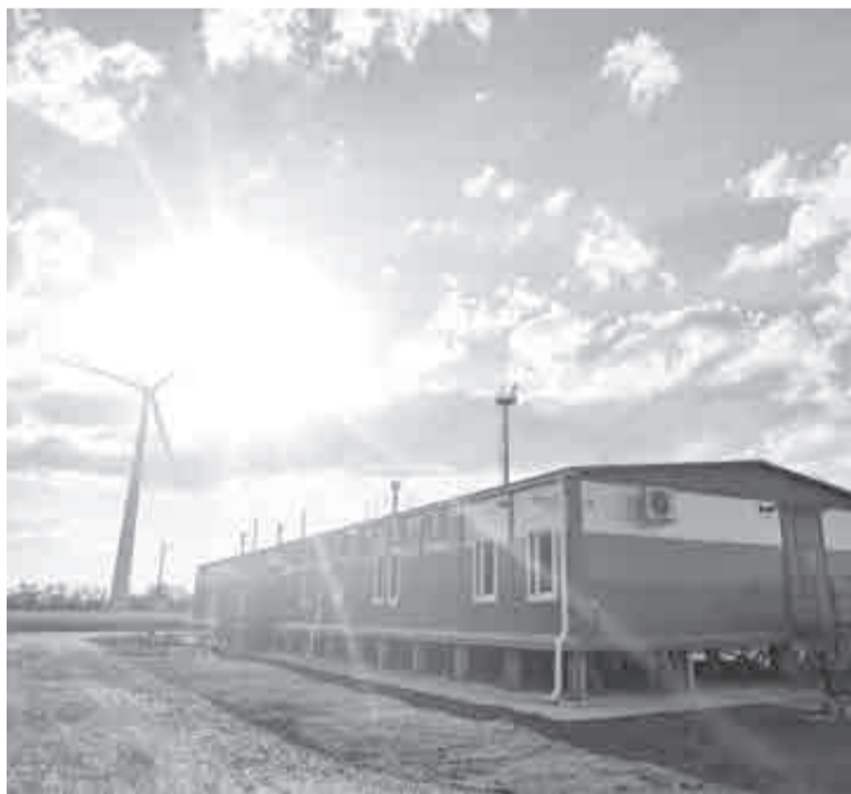
Компания «НЭР Восток» запустила производство блочно-модульных и быстровозводимых зданий на территории ТОР «Хабаровск».

данных и упрощает процесс отчетности. Информация о налогах и льготах поступает напрямую из ФНС, что позволяет резидентам избежать дополнительного ввода данных.