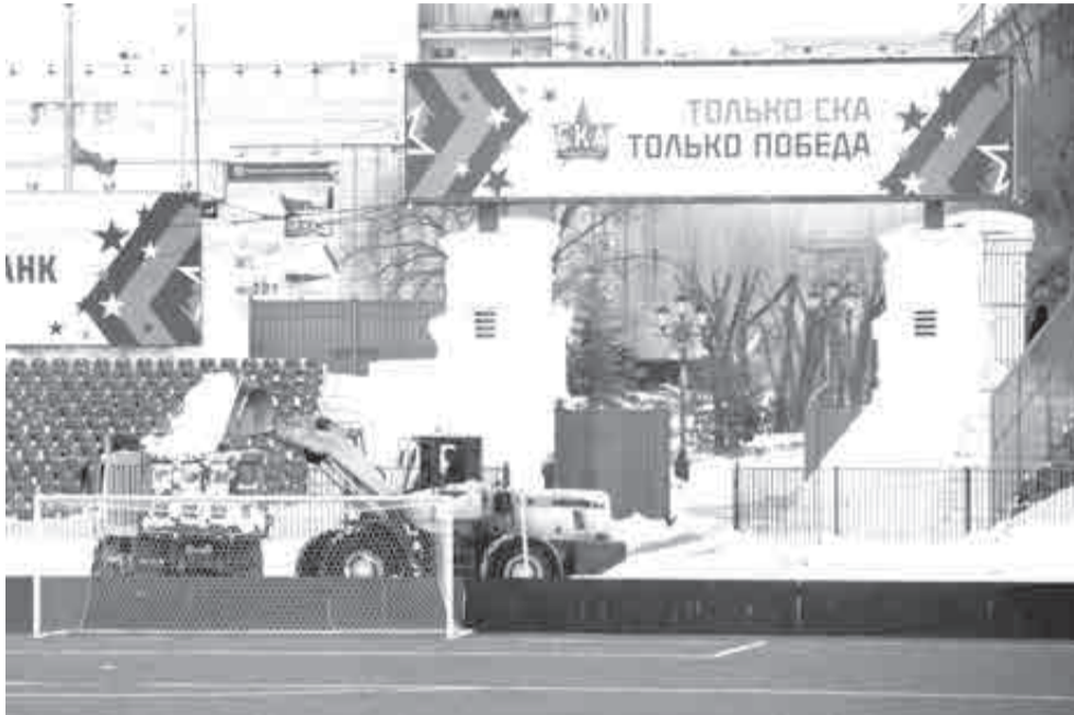
Поле почистили, подогрев работает, заверили в клубе.

Костяк, букмекеры и «поляна» с подогревом