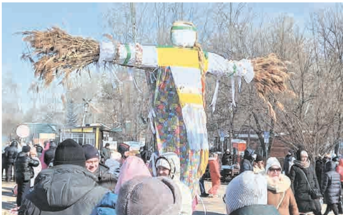
Это чучело так и не сгорело. Будет ждать следующей весны?

Обычно щеголять красивым нарядом Масленице недолго – всего день. Сжигают на праздник, чтобы так проводить зиму и дать дорогу теплу и Весне. В этот раз ей удалось избежать огненного конца: из соображений безопасности пришлось отказаться от обряда. Сильный ветер спутал планы. Вот теперь и гадай – придет весна в Хабаровск или нет?