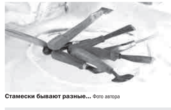
Стамески бывают разные...

Проект реализуется при поддержке Президентского фонда культурных инициатив. Организатором выступает региональное отделение «Творческий союз художников России» при поддержке министерства культуры региона, краевого колледжа искусств, Дальневосточного художественного музея и краевого парка им. Н.Н. Муравьева-Амурского.