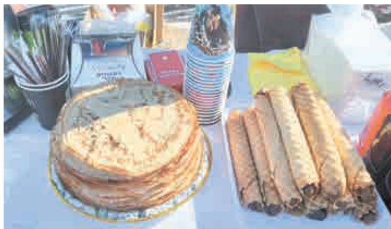
Кроме традиционных блинов и каши кушали тут и плов, и вафли, и шашлык...

– Март – самый любимый месяц мужчин, правильно я говорю, мужчины?