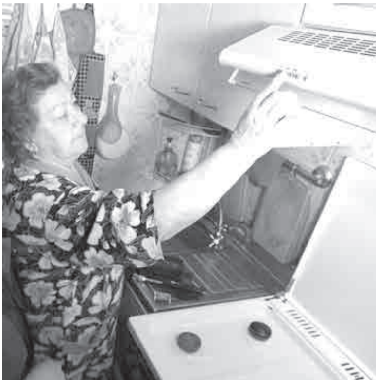
Хорошо, если ваш дом газифицирован. А если – нет?

Почему у хабаровчан взлетели платежи за электричество