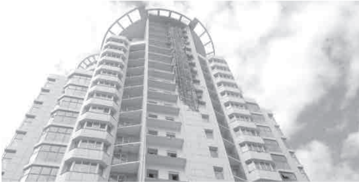
Дольщикам ЖК «Утес» решено выплатить компенсацию.

право участника долевого строительства, — заявил Дмитрий Демешин.