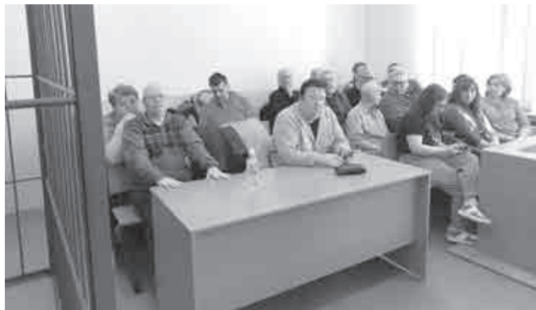
В ожидании приговора.