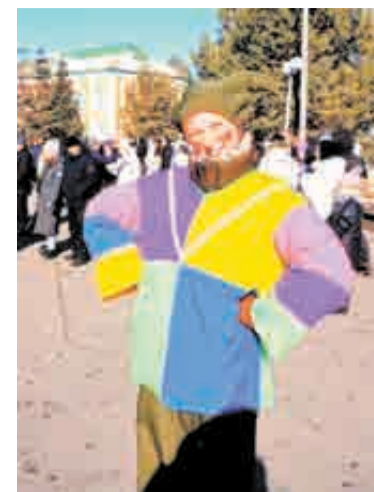
Какой праздник без скоморохов?

Наталья. – Никогда не ела кашу на праздниках, не понимала, что народ так за ней рвется. Теперь и я буду знать!