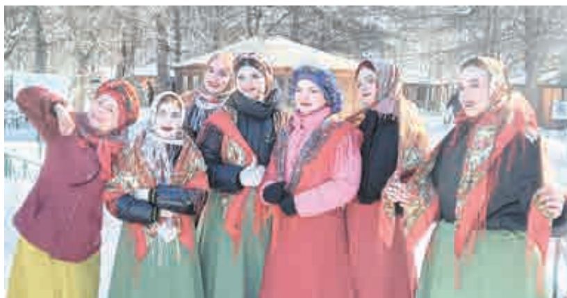
Провожали зиму с песнями...

– Реально, очень вкусная каша! – признается хабаровчанка