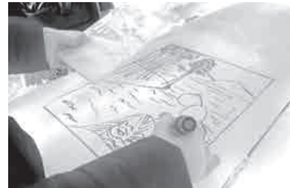
Эскиз утвержден, теперь можно переносить его на лед.