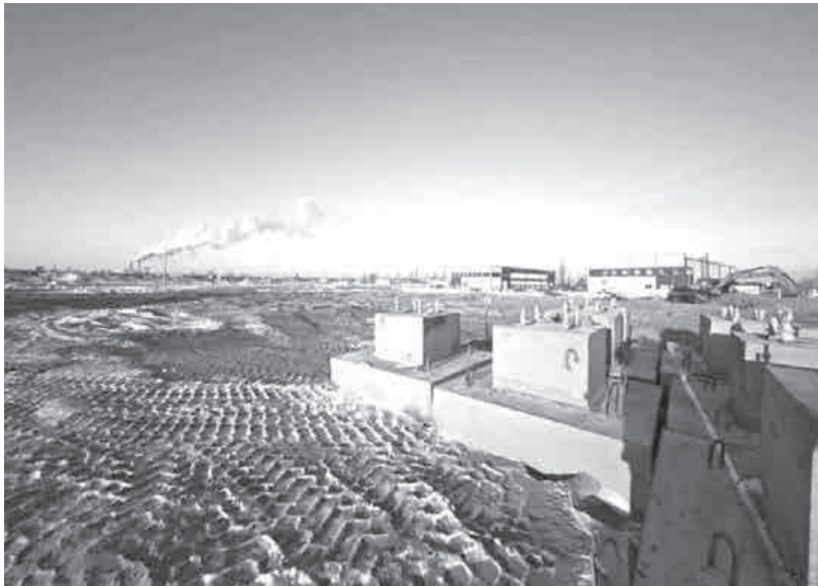
Тем временем, КРДВ приступила к возведению двух производственно-административных зданий на площадке «Парус» в ТОР «Хабаровск».