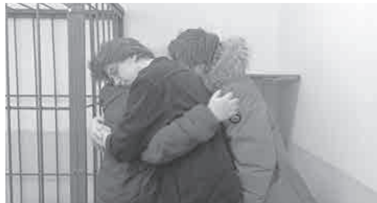
Семейные объятия после оглашения неожиданного решения суда.

«Я принесу больше пользы, если буду на свободе. Последние дни показали, что мир возможен! А мои навыки работы со словом