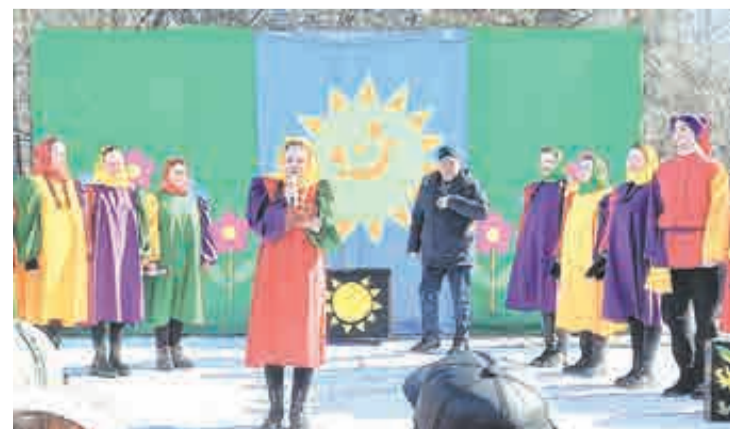
И мэр тут был.