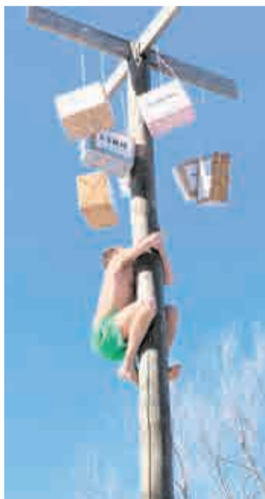
Так можно показать удаль. И заработать приз!