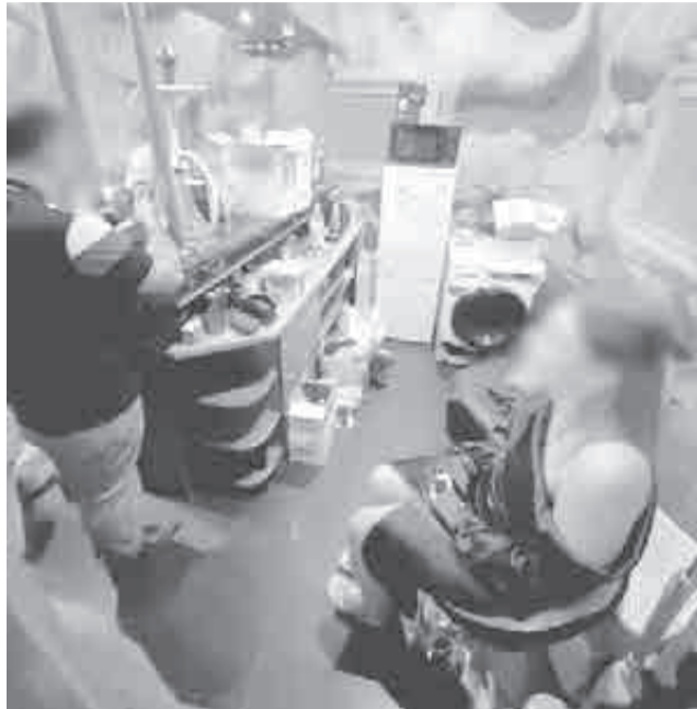
В пяти массажных заведениях региона было выявлено 15 «сотрудниц».

– Неужели все как одна шалавы?! Кстати, вот вам, юнцы, задание: найдите мне телефон продажной девки, а я пока схожу, сниму номер. Дядя Сережа – щедрый! – он похлопал себя по карману, в котором лежал телефон, с засунутой под чехол банковской картой.