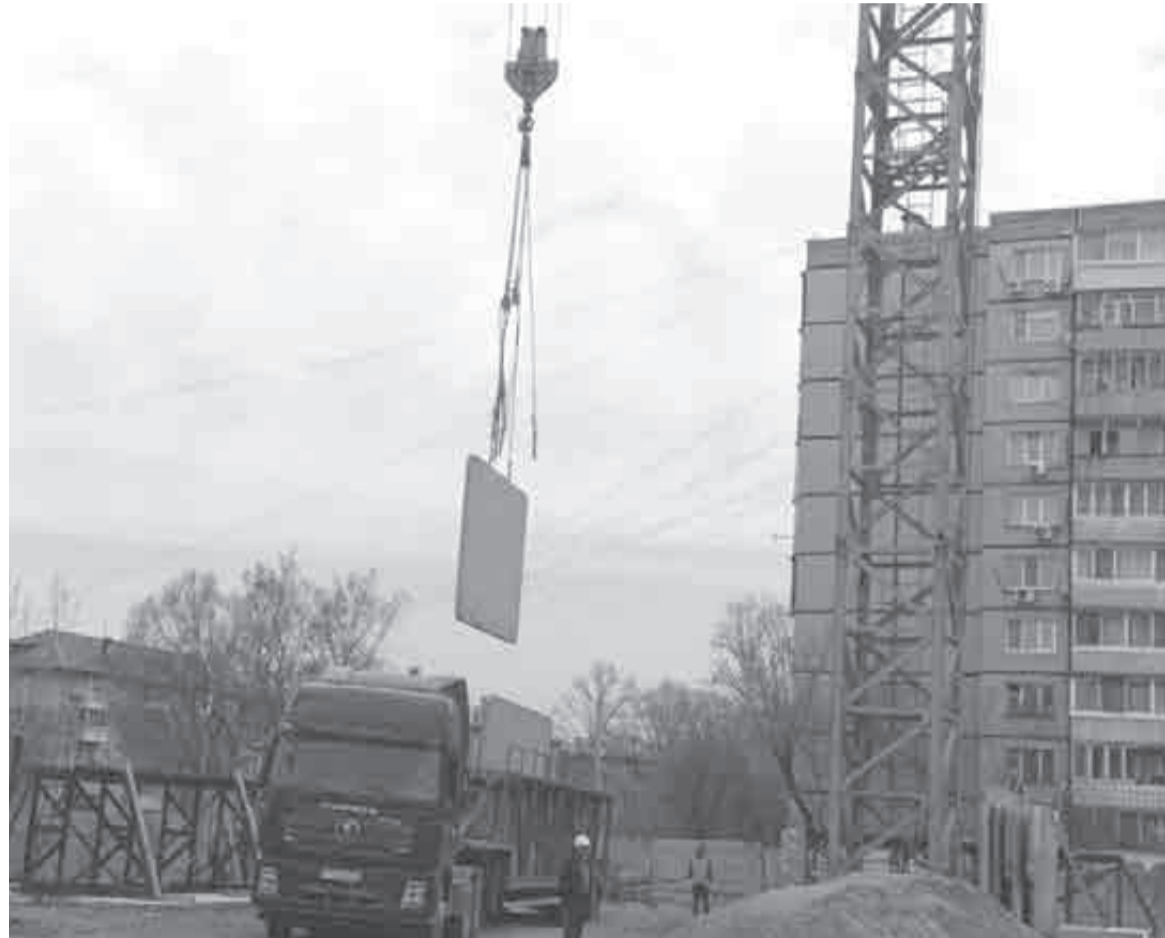
На 1 февраля в крае в стадии строительства находится 1,3 миллиона квадратных метров жилья в многоквартирных домах.

В Хабаровске прошла встреча губернатора Хабаровского края с начальником Дальневосточного управления Банка России