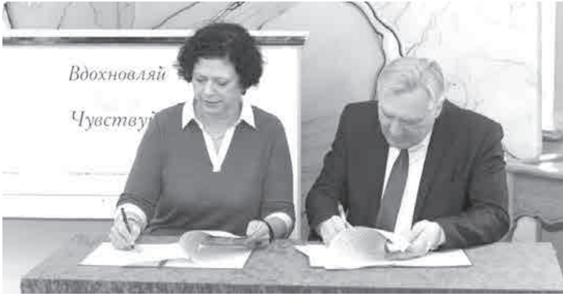
В рамках церемонии открытия проекта состоялось подписание соглашения между Хабаровской краевой филармонией и Хабаровским краевым колледжем искусств.

Благодаря проекту «Музыкальный семестр» школьники и студенты от 14 до 22 лет, а также все желающие смогут посещать в Хабаровской краевой филармонии концерты, лекции, экскурсии, литературно-музыкальные спектакли и творческие встречи с музыкантами и артистами по Пушкинской карте. Проект продлится до 21 мая, всего запланировано 14 мероприятий. Присоединиться может любой желающий.