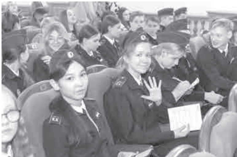
Благодаря проекту школьники и студенты от 14 до 22 лет смогут посещать мероприятия по Пушкинской карте.

21 мая – оркестр русских народных инструментов «Русский оркестр» представит программу «Вне времени. Джаз/танго/музыка кино» (6+).