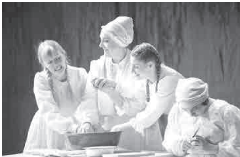
«В деревне Анатовка с давних пор жили русские, украинцы и евреи. Жили вместе, работали вместе, только умирать ходили каждый на свое кладбище...»

В Хабаровском театре драмы вновь премьера