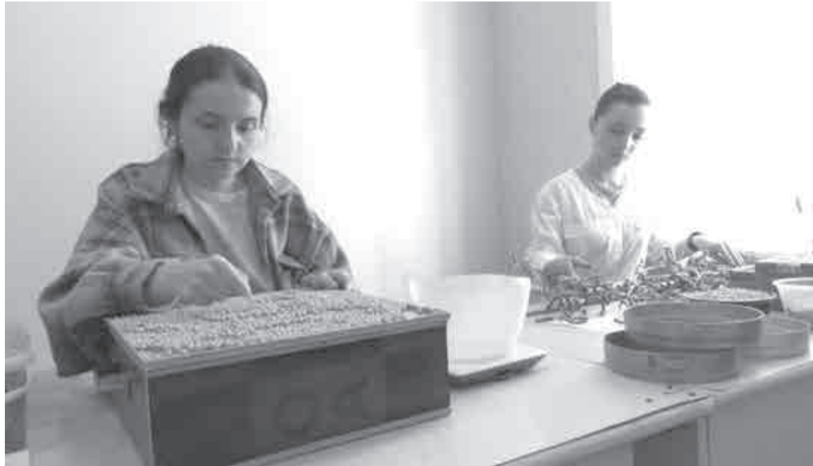
Хабаровские ученые работают над новыми сортами сои.

заменяли значимую долю импортных семян кукурузы на отечественные. Дальневосточному институту сельского хозяйства поставлена задача разработать высокоурожайный сорт кукурузы для наших климатических условий! – отметил министр.