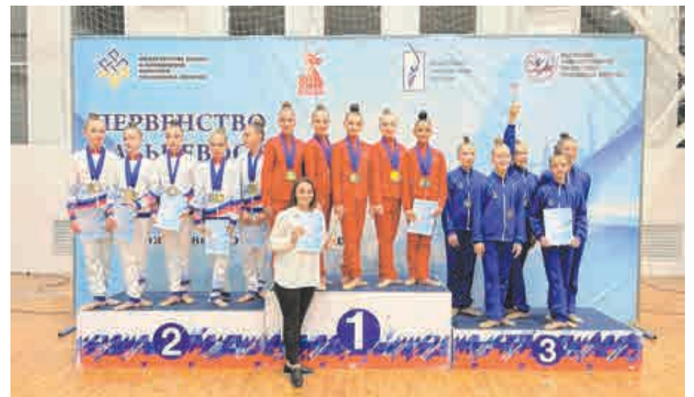
Хабаровские гимнастки всегда на пьедестале побед.