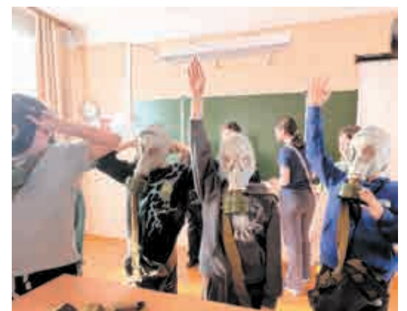
Младшие школьники продемонстрировали свои умения и навыки.

Проведение Всероссийской военно-патриотической игры «Зарница 2.0» приурочено к 80-летию Великой Победы, Году защитника Отечества в России, Году духовно-нрав-