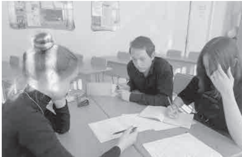
Профориентационные уроки по программе внеурочной деятельности «Россия – мои горизонты» проходят в школах края для ребят 6-11 классов. Мероприятия проекта входят в нацпроект «Молодежь и дети».

Не хватает сегодня и профессионалов, работающих с людьми. Никогда не уйдут с рынка труда такие специальности как учителя, медики, тренеры, психологи. И в этом направлении также можно начинать с колледжа после девятого класса.