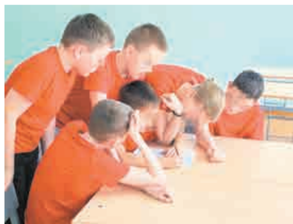
Участники игры «Зарница 2.0» должны разбираться в стратегии и тактике.

Как пояснили в комитете по делам молодёжи правительства Хабаровского края, муниципальные этапы будут идти до 16 апреля, далее последуют региональные – с 17 апреля по 31 мая. Окружной этап игры для средней возрастной категории пройдёт в июне и июле, а старшие ребята поедут на окружные сборы. Победители представят Дальний Восток на Все-