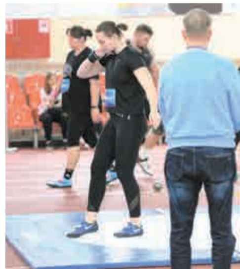
Хабаровские легкоатлеты завоевали серебро в толкании ядра.