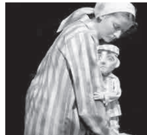
Спектакль «Станция Тевли» в 2021 году вошел в лонг-лист премии «Золотая маска» и стал лауреатом нескольких престижных фестивалей.