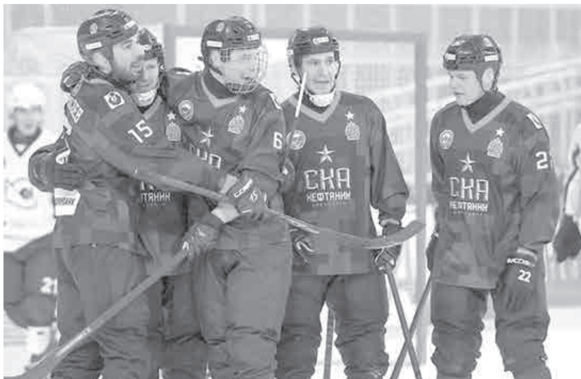
Смогут ли в этом сезоне бендисты выиграть медали?

И уж совсем неожиданно до трех матчей затянулась битва седьмой и второй команд «регулярки». Сильно ослабленный и омоложенный «Енисей» на родном пятидесятилетнике привлек