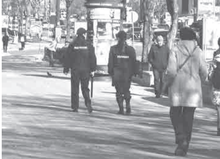
«Деятельность ведущих служб полиции существенно затруднена. В среднем по России за последние пять лет количество выставляемых ежедневно нарядов сократилось на четверть».

Кадровый вопрос в МВД дозрел до дефицита сотрудников