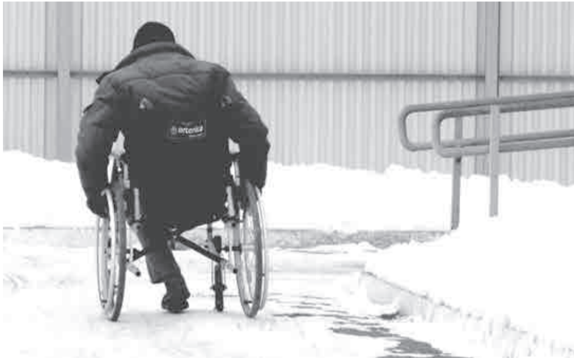
«В прошлом году за решеткой было две тысячи инвалидов, нуждающихся в технических средствах реабилитации, из которых 1,8 тыс. были ими обеспечены».

За решеткой остаются многие тысячи инвалидов