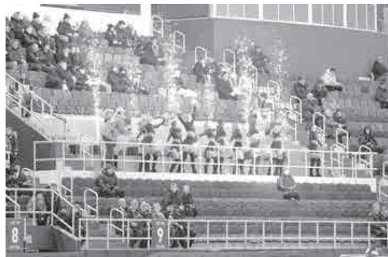
Даже в лучшем случае сейчас стадион «Ерофей» бывает наполовину пуст. Или наполовину заполнен?

Первый полуфинальный матч чемпионата России (0+) между хабаровским «СКА-Нефтяником» и архангельским «Водником» начнется 12 марта в 19:00. Повторная встреча в Архангельске стартует 15 марта в 20:00 по хабаровскому времени. Если каждая из команд выиграет по матчу, то в Архангельске 16 марта пройдет третья игра – для выявления финалиста. В Хабаровске 22 марта в 15 часов неудачники полуфиналов разыграют «бронзу». В этот же день финал Суперлиги примет Кемерово, матч запланирован на 15 часов местного времени (18:00 хбр).