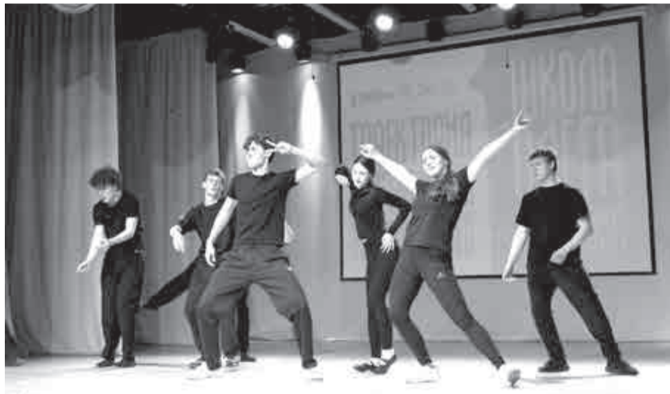
Семерка финалистов – на сцене.