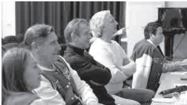
Члены жюри – за работой.

Но и про идею школьного театрального образования мастер, который был ректором Школы-студии МХАТ с 1985-го по 2000 год, никогда не забывал. В