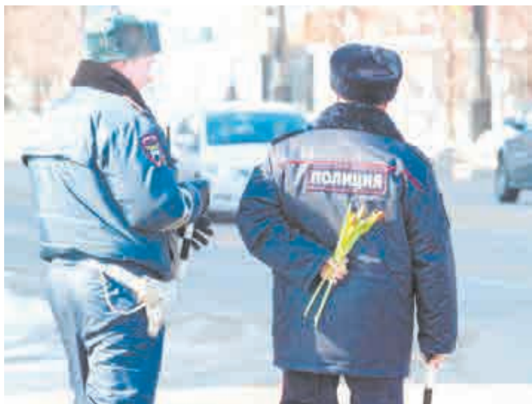
Кого-то ждет приятный сюрприз.

Голосование, прошедшее по нацпроекту «Жилье и городская среда», с 2025 года будет проходить в рамках нового нацпроекта «Инфраструктура для жизни». Среди показателей, которые надо достичь в рамках нацпроекта к 2030 году – благоустройство не менее чем 30 тысяч общественных территорий, а также реализация не менее чем 1600 проектов победителей всероссийского конкурса создания комфортной городской среды.