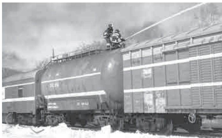
Был задействован пожарный поезд.

гражданской защите организовал прием заявлений от граждан через портал Госуслуги, органы местного самоуправления и МФЦ.