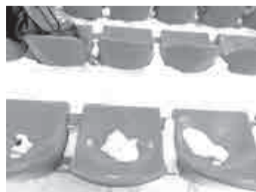
Хабаровские болельщики, сидя в сугробах, пока именуют такой футбол «зимним видом спорта»...

К слову, для «Сочи» эта хабаровская победа стала чуть ли не пирровой. Вернувшись домой, явный фаворит остушился в игре с плетущимся в конце таблицы