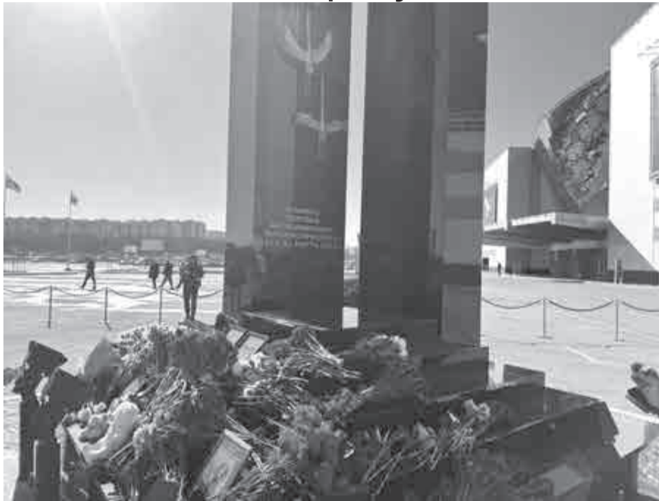
145 человек погибли в результате теракта в столичном «Крокус Сити Холле». Еще более 550 человек пострадали. В годовщину трагедии около концертного зала открыли официальный мемориал — девятиметровую стелу из черного камня. На ней изображены 14 белых журавлей — символы трагедии. И надпись: «В память жертвам бесчеловечного террористического акта 22 марта 2024 года». Автор проекта — президент «Крокуса» Эмин Агаларов.

Пострадавшие от теракта рассказали о событиях в «Крокусе»