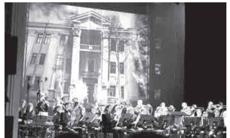
Концерт в честь юбилея.