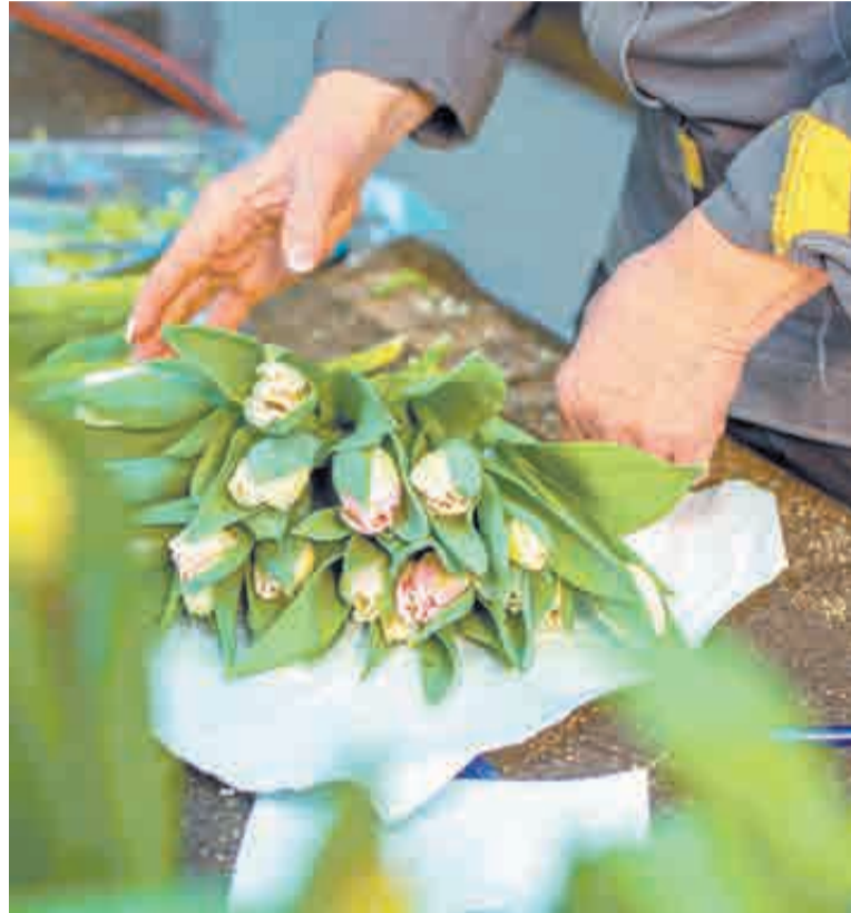
Эти цветы любят деликатность.

МБУ «Горзеленострой» основано еще в 1934 году как «Горзеленхоз», общий стаж работы уже 90 лет! Предприятие не раз переименовывали, но его функции – неизменны: организация зеленого строительства, капремонт и содержание зеленых насаждений в Хабаровске.