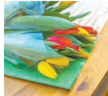
Букет к вручению готов!

хабаровчанок не только весной, даже летом их можно было увидеть на клумбах Комсомольской площади. Однако городские цветоводы пока отказались от красивой идеи.