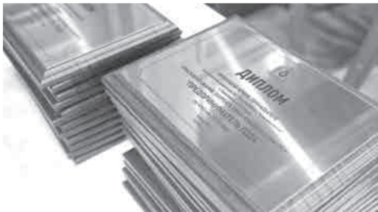
За неделю после старта организаторам предпринимательского конкурса поступило семь первых заявок.