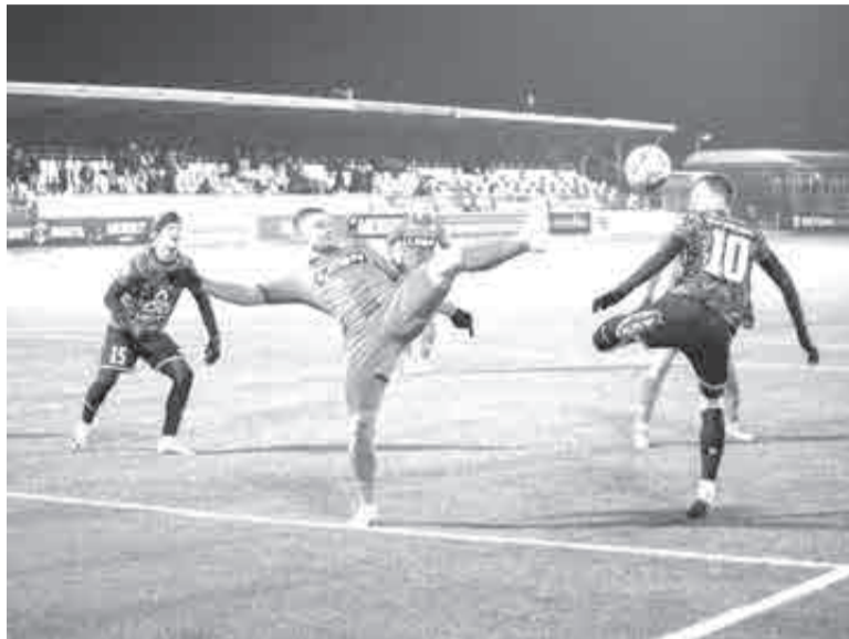
В весеннем футболе всегда много тяжелой борьбы, далеко не всегда на это приятно смотреть.

гости спокойно отбивали атаки, не давали доводить их до логического конца в виде ударов, зато сами уверенно обсновывались на подступах у штрафной хозяев. Впрочем, по паре моментов обе команды за тайм создали, но не сказать, что стопроцентные.