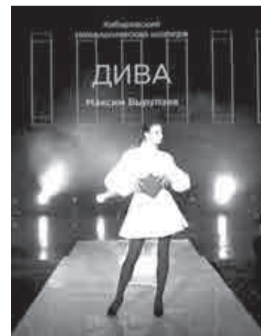
Во время демонстрации коллекции хабаровского дизайнера.

«В Москву я поехал за конструкторской уверенностью: чтобы понимать в мелочах, как создавать любую одежду. Там было очень много заказов. Месяцу меня был наставник, а дальше уже со-