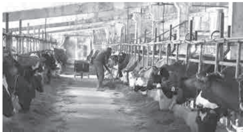
Уход за животными – постоянный труд.