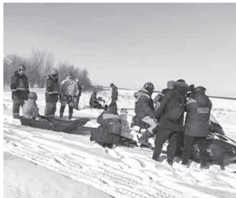
Эвакуация «пострадавших» с места бедствия.

В ходе учений отрабатывались действия по оповещению и эвакуации населения, оказанию первой медицинской помощи пострадавшим, а также размещению людей в безопасных пунктах.