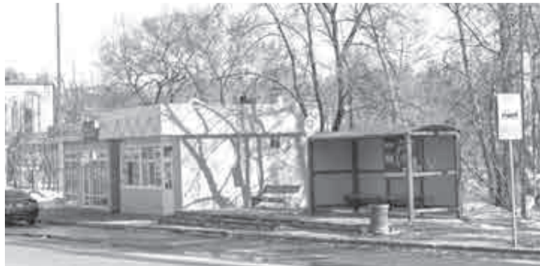
Десятки тысяч рублей расходов предлагается возложить на торговый бизнес на остановках. А бизнес такое потянет?

Как НЕ решается деликатная проблема в Хабаровске