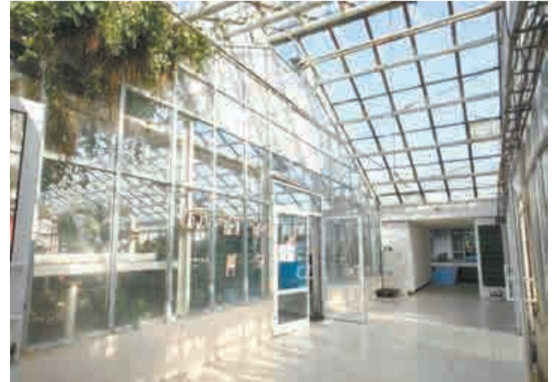
В муниципальной теплице для цветов созданы все условия.

Кстати, живописные тюльпаны в прошлом году радовали