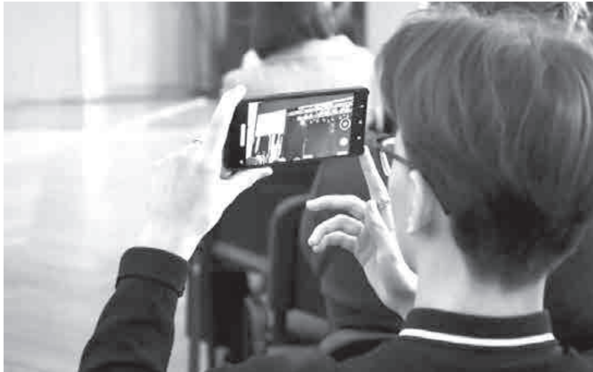
Начинать и организовывать свое дело можно при помощи мобильного. И, конечно, знания полезных цифровых ресурсов.

подачи заявки на нужную услугу занимает до 10 минут.