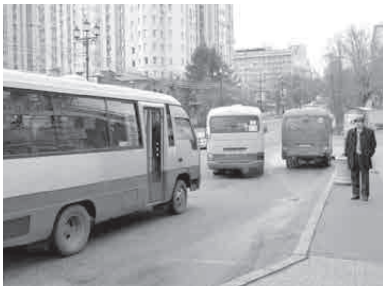
Больше всего он любил «работать» в маршрутках: тут пассажирам тесно, а ему – удобно.