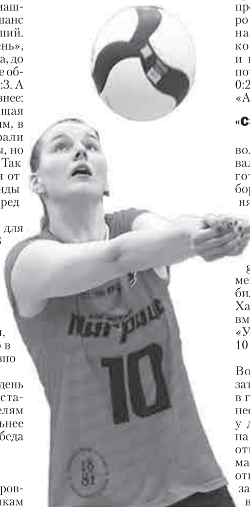
«Тигрицам» еще есть за что сражаться!