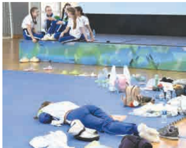
У одних – байки, у других – отдых.

Что ж, могу подтвердить: пилонный спорт – очень красивое