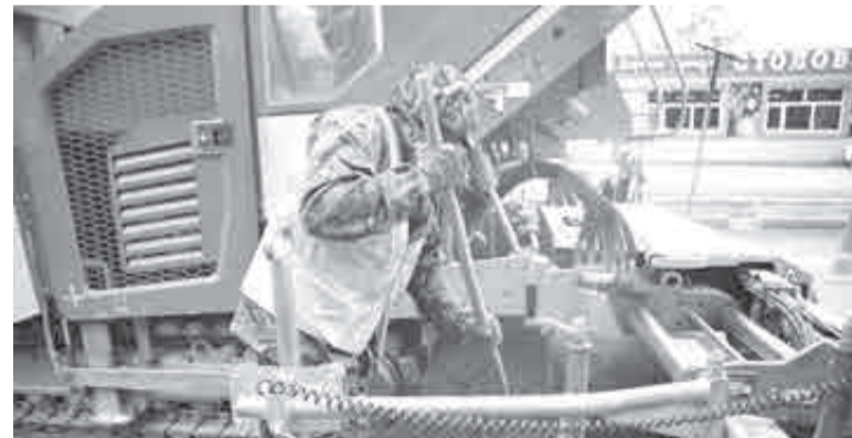
Дорожники уже готовятся к новому сезону.

На конец прошлого года в стране свыше половины региональных и более 85% дорог в крупных городах с пригородами соответствовали современным требованиям. В Хабаровском крае эти показатели выше. Доля находящихся в нормативном состоянии дорог в Хабаровске составляет 85,86%, в Комсомольске-на-Амуре – 87,75 %, по региональной дорожной сети – 60,9%, сообщили в правительстве края. И напомнили: в рамках нацпроекта «Безопасные качественные дороги» с 2019 по 2024 годы в регионе обновлено более 820 км дорог, а также 98 мостов протяженностью свыше 2400 погонных метров.