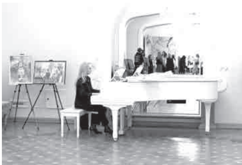
Работа по обновлению учреждений отрасли будет продолжена – но уже не в рамках нацпроекта «Культура», а в рамках нацпроекта «Семья».

Дополнительно в 2024 году в краевую сферу культуры привлечено 350,6 млн рублей – это средства президентской «Единой субсидии». Благодаря этому в регионе приобрели 11 транспортных средств в учреждения культуры, оборудование для проведения массовых уличных мероприятий, оснастили краевой музтеатр, краевой колледж искусств и краевую филармонию.