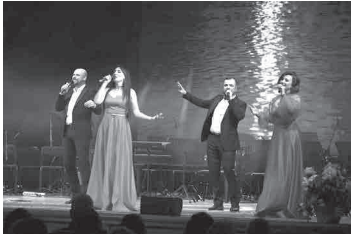
Естественно, что для работников культуры в честь праздника устроили большой концерт.

Лучших работников культуры отметили в крае