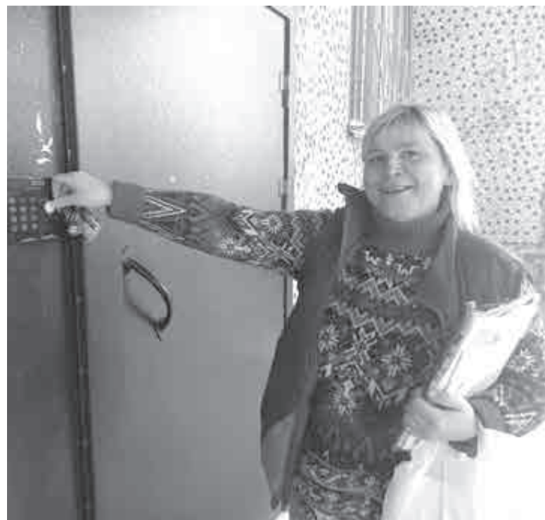
Важно не забыть связку домофонных ключей от всех подъездов района.