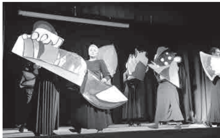
Декораций на сцене не было, но кое-что зрелищное авторы придумали.

– Попробуйте просто вслушаться вместе с нами, продышать, прозвучать. Это же эксперимент, мы сознательно отошли от привычного чтения стихов под фонограмму. У нас практически все время идет живой звук. Много – шепотом. Мы старались прийти к графичной, минималистичной форме. Чтобы достичь состояния поэтического языка. Мы перемешали профессиональных музыкантов и актеров с непрофессиональными людьми, которые просто пришли, пожелали и попробовали себя в этой стезе. Этот не игра-действие, а игра – состояние, – объясняла Ольга.