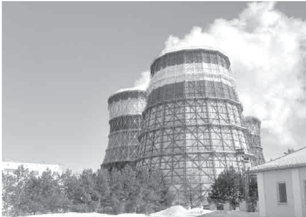
«Невозможность обеспечивать запросы энергетиков говорит о реальном состоянии дел с импортозамещением энергетического оборудования в РФ».

Стране нечем заменить советские электростанции