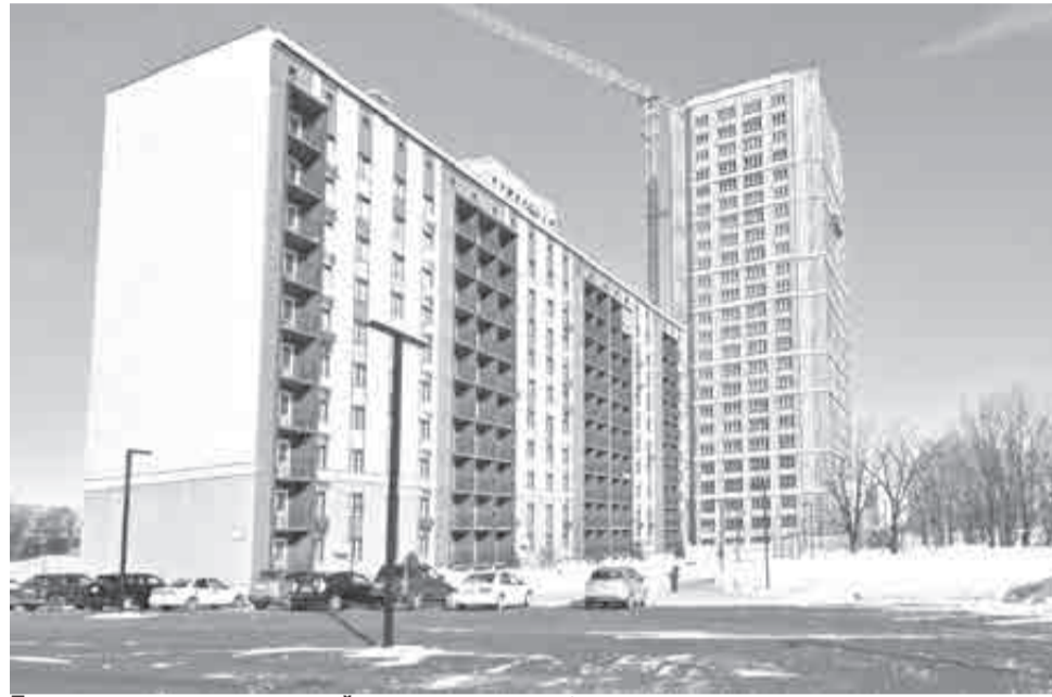
Пусть не сразу, но квартирный вопрос решается.

для проживания жилья находится на особом контроле губернатора.