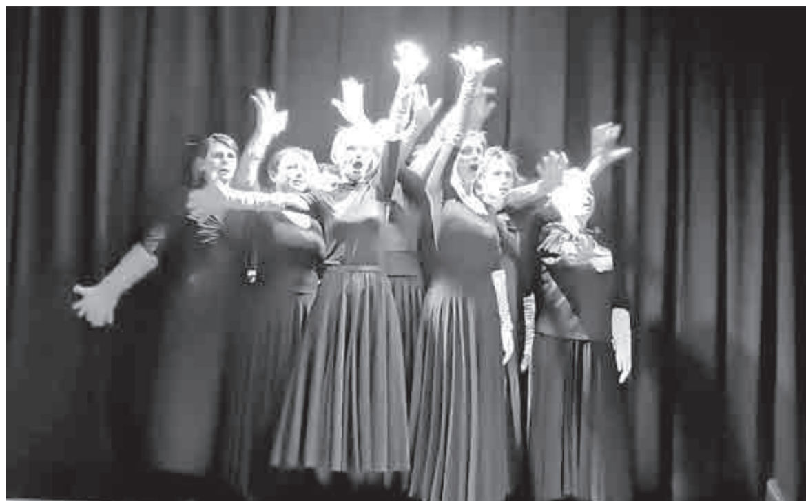
12 женщин, каждая – со своей историей и интонацией.