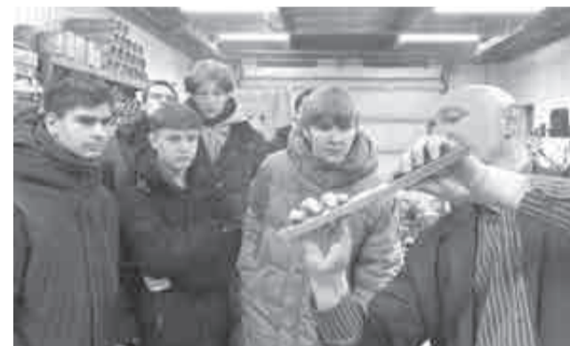
Экскурсия на предприятие.

– Участие в неделе промышленного туризма – возможность для подрастающего