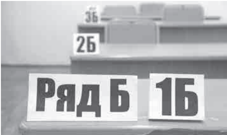
А в нумерологию вы верите?

дело того стоит... И вот так, раз за разом, по частям, испугавшаяся провалить экзамены и расстроить родителей ученица перевела неизвестно кому, скрывающемуся за аватаркой гадалки, без малого 4 млн рублей, благо имела к ним доступ.