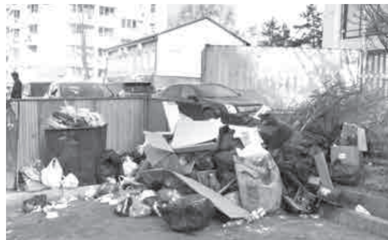
Проекты в Солнечном районе и в Хабаровске должны сократить количество свалок и внедрить вторичную переработку отходов в крае – естественно, в рамках нового нацпроекта «Экологическое благополучие».

ля за кубометр (сейчас – 656,63), а по индивидуальному жилому дому (ИЖД) – 583,1 руб. (сейчас – 529,13).