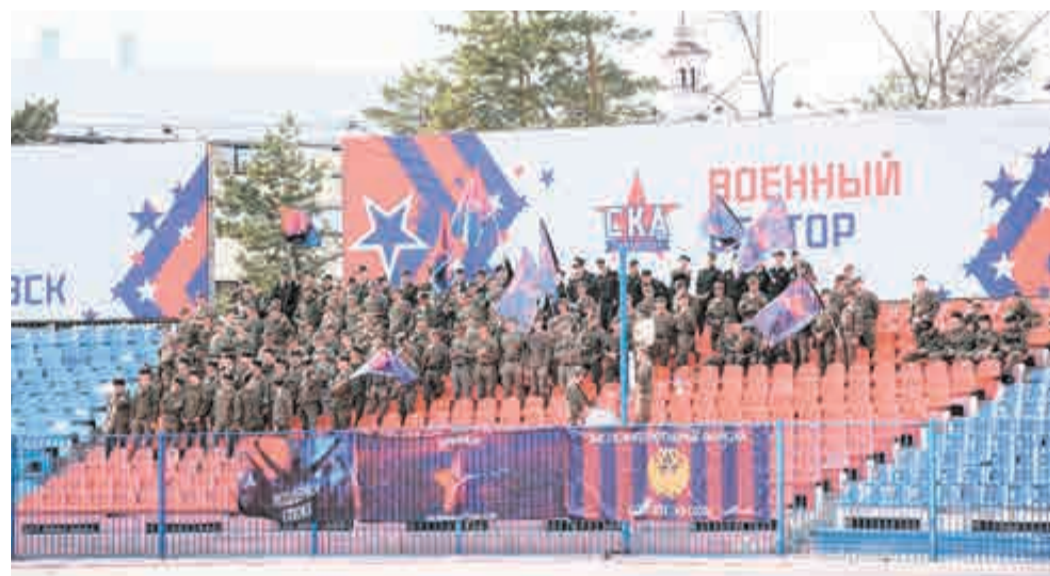
Так выглядит «военный сектор».