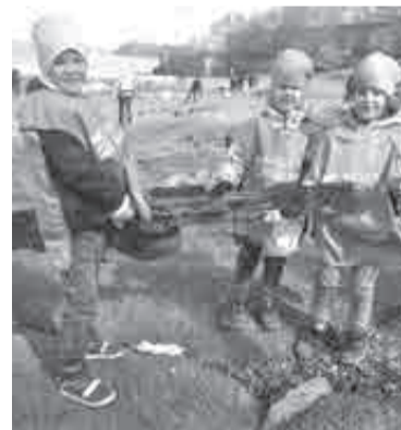
В акции может участвовать любой желающий.

В апреле старт акции в регионе дадут жители Нанайского района – они выйдут на уборку берегов водных объектов в