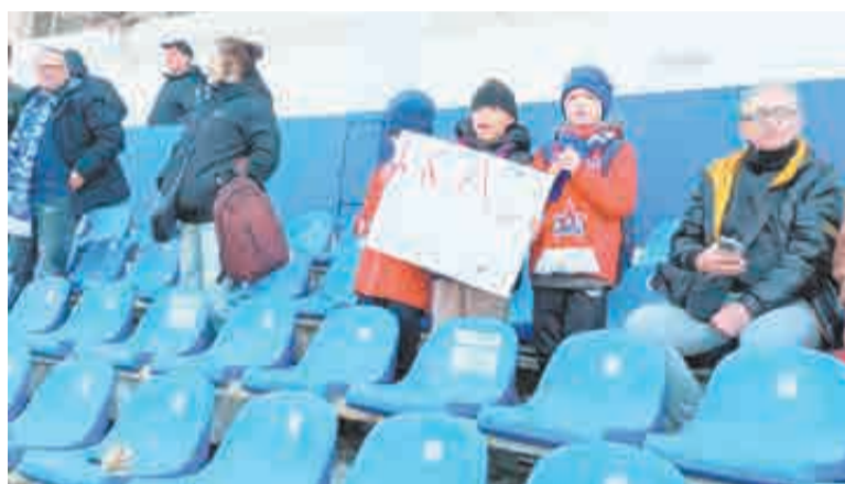
«Балтийские» болельщики остались довольны результатом, а вот наши – расстроены.

*** Так что на стадион Ленина, где на прошлой мартовской игре было меньше полутора тысяч зрителей, на сей раз пришло втрое больше людей. Скажем, помимо почти сотни фанатов СКА, которым, как и военным, на арене выделен отдельный сектор, из Калининграда прибыл небольшой отряд «бал-