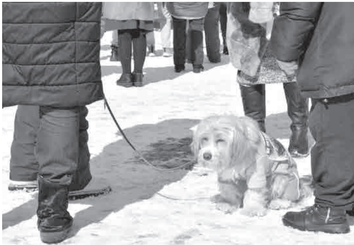
Хозяйка в своем Джеке души не чаяла. И даже не думала, что они расстанутся надолго...

« Это, наверняка, гаишники что-то химичат: ставят не там знаки, подкручивают ограничения. Иначе чем объяснить, что за год собралась коллекция из 12 штрафов?!»