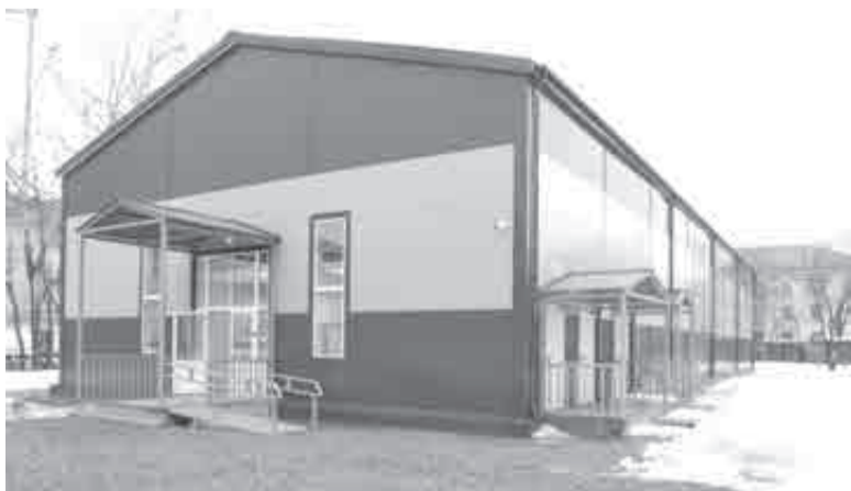
Типовые спортзалы, по идее, должны строиться быстрее.

В рамках «Межотраслевой программы развития школьного спорта в Хабаровском крае» сообщалось о том, что в регионе реализуются проекты «Баскетбол в школу», «Волейбол – в школу», «Футбол – в школу», «Мини-футбол – в школу» и программа «Плавание для всех». Также в крае продолжается реализация всероссийского проекта «Самбо в школе».