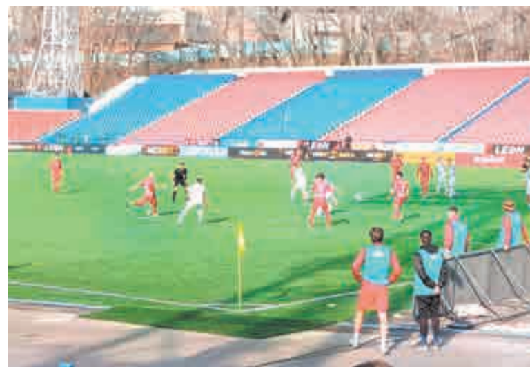
Восточная трибуна все еще ждет ремонта и пустует.