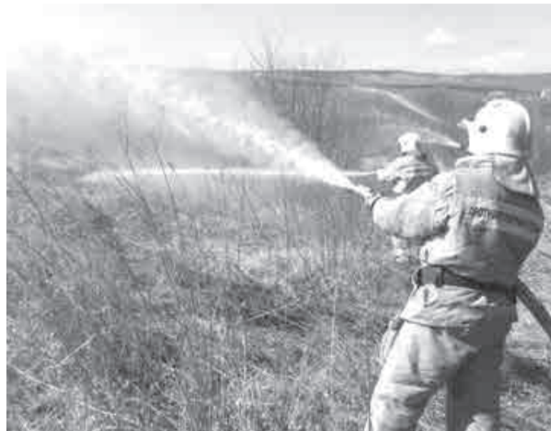
Почти 300 тысяч гектаров тайги уничтожил огонь в крае в прошлом году.