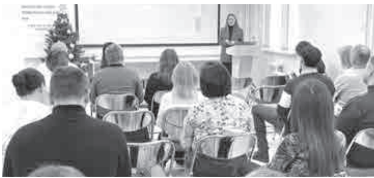
В хабаровских структурах поддержки бизнеса регулярно проводят обучение для коммерсантов.

По вопросам получения поддержки инвесторы могут обращаться в АНО «Агентство привлечения инвестиций и развития инноваций Хабаровского края» по телефону: 8800-700-1927, по электронной почте: agency@invest-khv.ru или оставить обращение на портале.