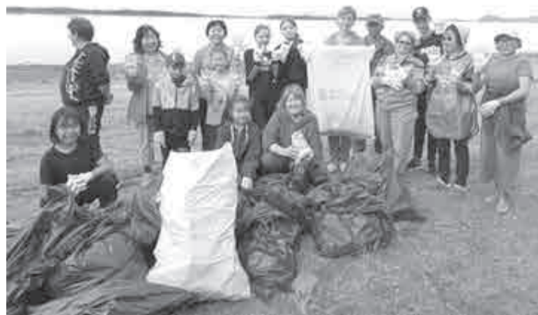
На 21 апреля запланирован субботник в районе завода «Дальдизель» в Хабаровске.

том числе берега Амура и его проток в границах Хабаровска и Хабаровского районов. Эколо-