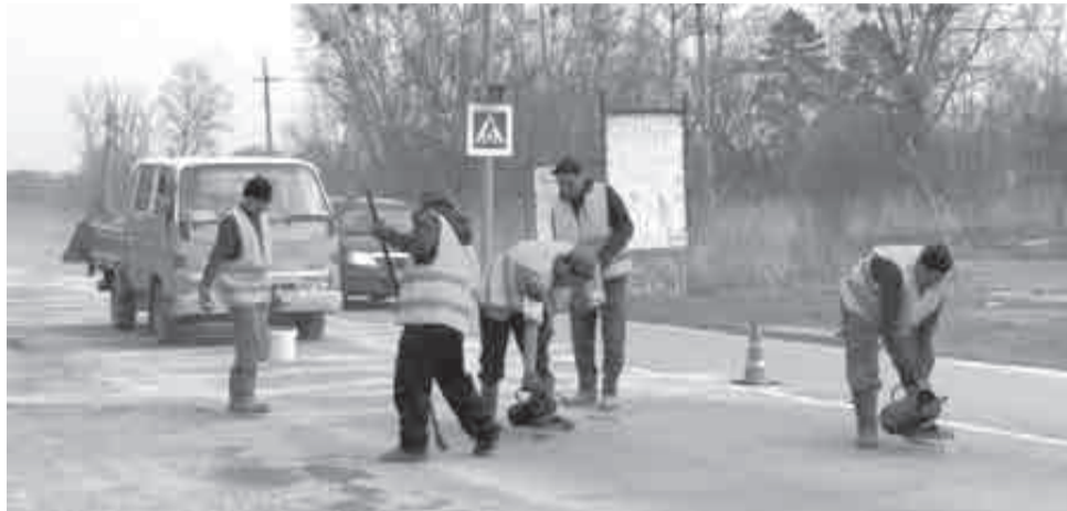
Дорожники начали сезон.

В ближайшее время дорожникам предстоит проверить более чем 120 участков краевых магистралей в 16 районах. При этом специалисты выполняют обследование покрытия и конструктивных элементов дорог и мостов на наличие разрушений и дефектов, препятствующих безопасному и комфортному проезду.