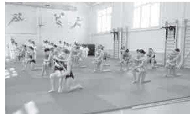
На открытии школьного зала в Ванино.

Киокусинкай внедряют в школы уже три года.