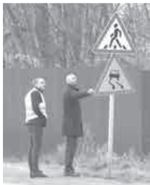
Знаковый контроль.

Как напоминают в Минтрансе региона, обновленные по дорожному нацпроекту объекты находятся на гарантии в среднем в течение пяти лет после их сдачи в эксплуатацию. При выявлении замечаний подрядные организации несут обязательства по их устранению.