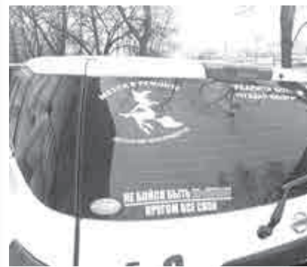
Судя по наклейкам, водительнице нравится самовыражаться. Но все ли разделяют ее радость?

Но, по словам автоинспекторов, пока подобных жалоб от горожан к ним не поступало. С этим же вопросом мы обратились к полицейским.