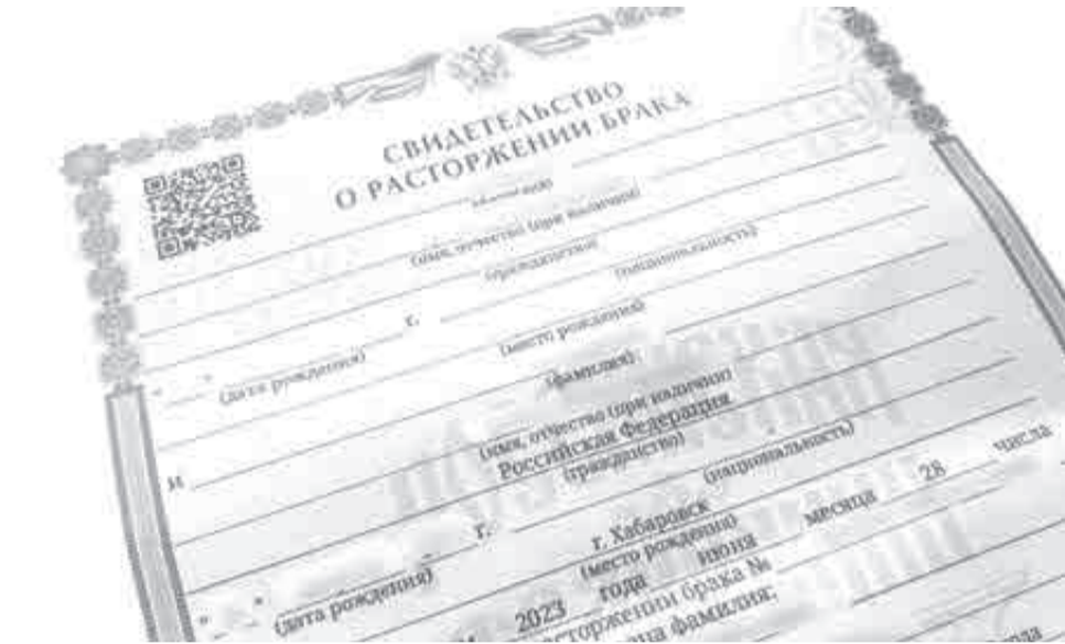
Ради получения такой бумажки люди идут на многое. И многое теряют...

– Если дело дошло до суда, это минимум полгода. И еще больше – если речь идет о разделе имущества. У меня было два дела, которые выходили за годичный срок. И чем больше