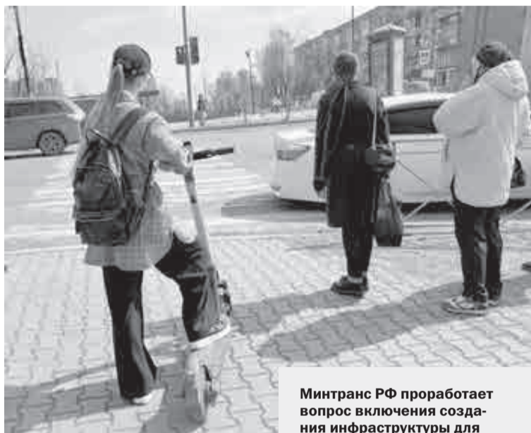
Далеко не все любители СИМов спешиваются перед «зеброй».

Хотя в целом правила передвижения на СИМах по городу остались те же. Ныне на прокатном устройстве погонять не удастся. Сервис настроен так, что позволяет ездить со скоростью не более 25 километров в час, а кое-где придется сбавить до 15 км, а то и до 5 км/в час. Скажем,