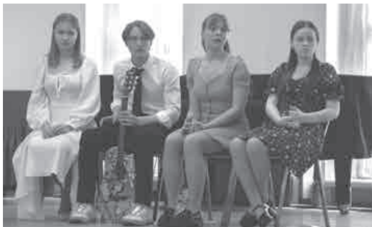
В ожидании прослушивания.

– Я не буду отвечать, ведь успех – это всегда опасность. Но то, что мы смогли приехать и посмотреть на ребят талантливых, чтобы они