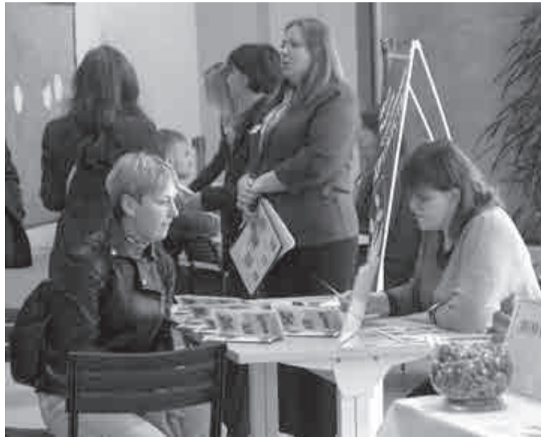
Сотни хабаровчан пришли сюда в поисках работы.

В Хабаровске вновь прошла краевая ярмарка трудоустройства