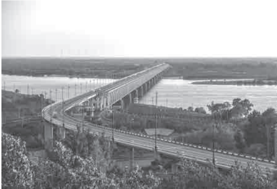
Эксперты говорят: нам есть чем гордиться.