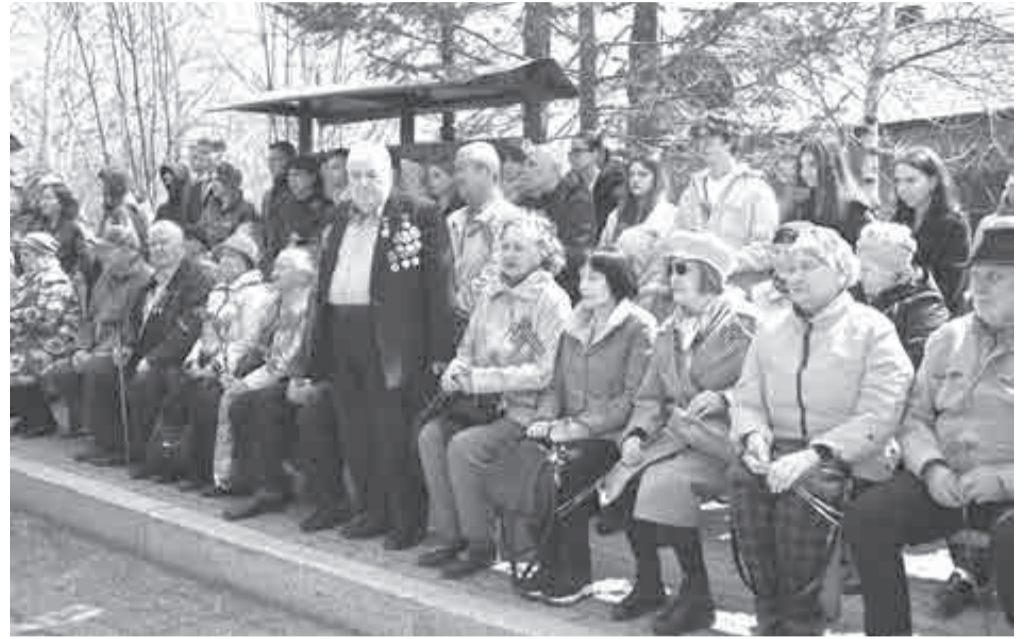
49 бывших узников фашизма еще живы в крае. В апреле в Хабаровске возложили цветы в честь международного дня освобождения узников фашистских концлагерей.

Между тем, в апреле еще один музей – столичный «Музей Победы» совместно с «Цифровой экосистемой МТС» и онлайн-кинотеатром KION запустили всероссийский проект по сбору писем сыновей и матерей