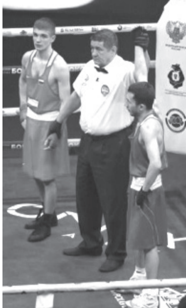
Интересным вышло и соперничество с узбекскими спортсменами.

Констатируем: в мировом боксе произошел настоящий раскол. При этом осенью, как сообщал «Форбс», стало известно: МОК