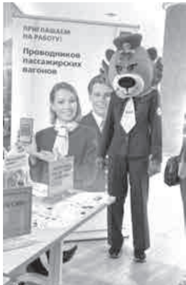
Был на ярмарке и креатив.